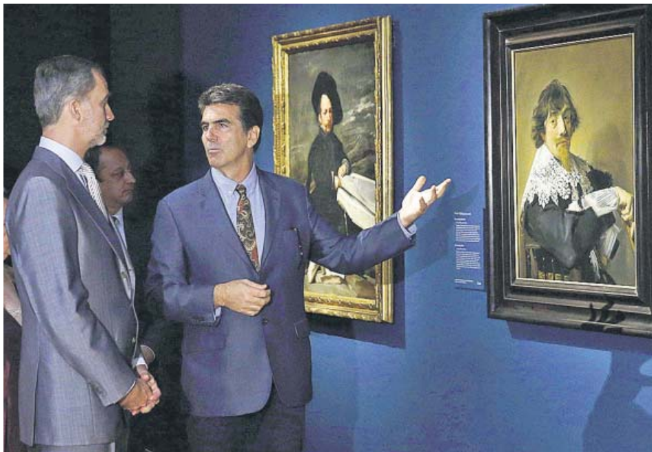
Felipe VI, en la inauguración de Velázquez, Rembrandt y Vermeer. Miradas afines.