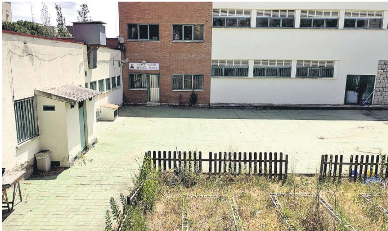
El colegio Méndez Núñez de Hortaleza sufrirá mejoras en cocina, aseos y patio.

El Ayuntamiento de Madrid realizará durante este verano 235 obras de mantenimiento y conservación en 114 los colegios públicos de la capital. El coste de los trabajos será de 20,1 millones de euros y las actuaciones se producirán en