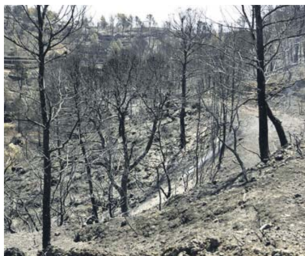
Una de las zonas afectadas por el fuego en Tarragona.

Después de sembrar la polémica al decir que el apoyo recibido por parte de la Unidad Militar de Emergencias (UME), así como del Ministerio de Agricultura, es una ayuda que Cataluña también ofrecería a un vecino, Buch volvió a agradecer ayer el apoyo que