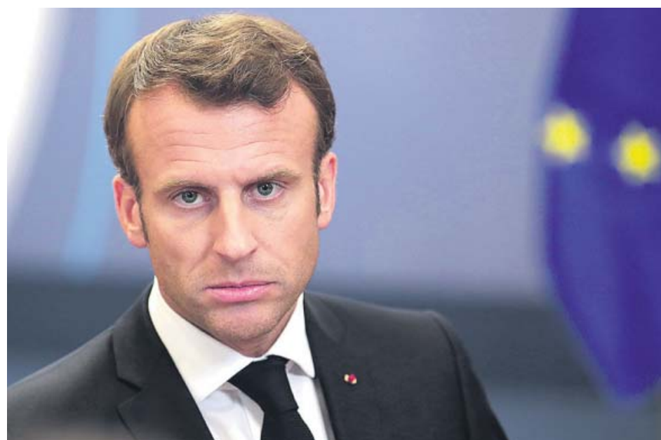
El presidente francés, Emmanuel Macron, ayer en Bruselas en el Consejo Europeo.

España parece que va a sacar poco provecho de ese tira y afloja entre familias europeas. Con los altos cargos muy lejanos para un representante español, Sánchez aspira a obtener un puesto de segunda línea. El Alto Representante sigue siendo una opción, pero muy lejana, por lo que Nadia Calviño o Teresa Ribera —Borrell ha perdido opciones— podrían optar a una Comisaría relevante o una vicepresidencia de la Comisión. ●