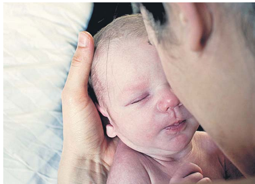
Las ventajas de este contacto no solo son para el bebé, también para los padres.

La Agencia Estatal de Meteorología (Aemet) mantiene para hoy la alerta amarilla por al-