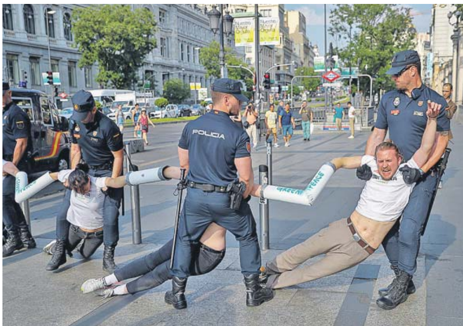
Activistas de Greenpeace cortaron, ayer, accesos al tráfico en Madrid Central.