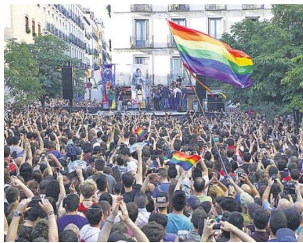
La plaza de Chueca (Madrid), durante las fiestas del Orgullo.