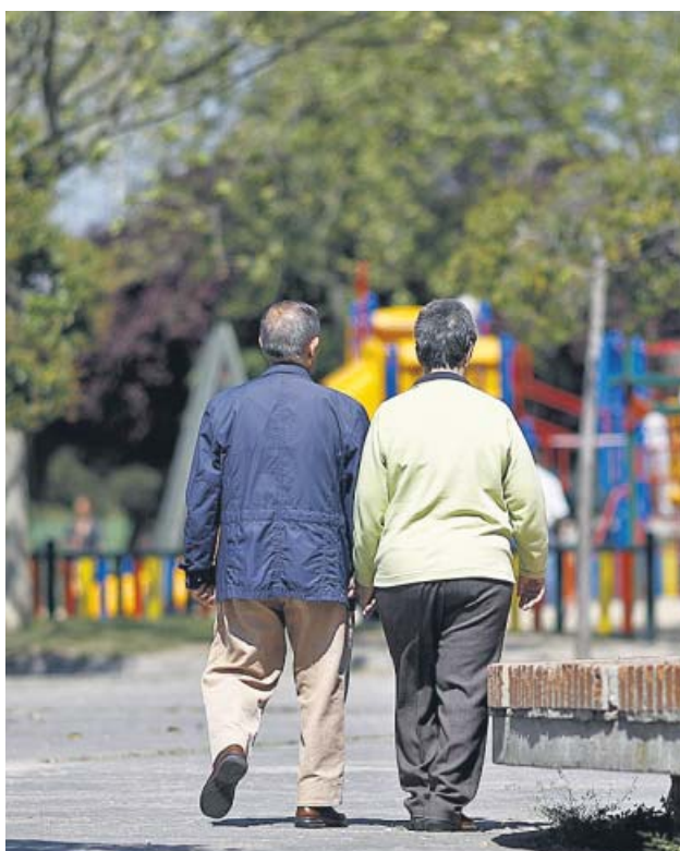
Una pareja de personas mayores paseando por un parque.