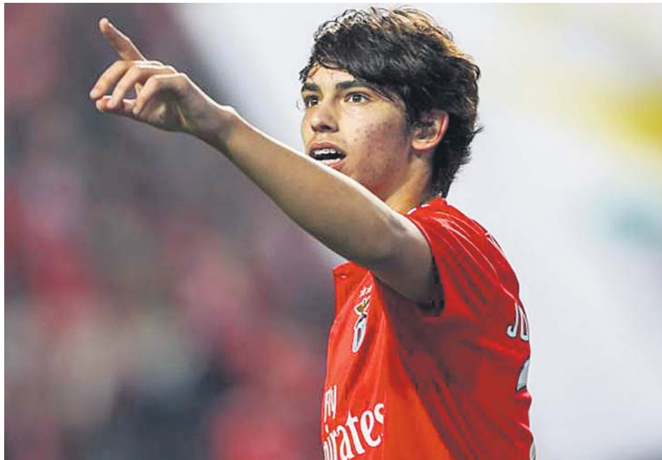
Joao Félix celebrando un gol en un partido con el Benfica.

Joao Félix, una apuesta personal de Simeone, estaba en la agenda de grandes clubes europeos, especialmente del