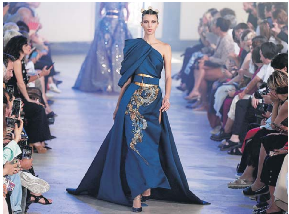
Una modelo desfilando con una de las creaciones de Elie Saab, ayer, en París.

Puedes leer muchas más noticias sobre famosos en nuestra edición digital.