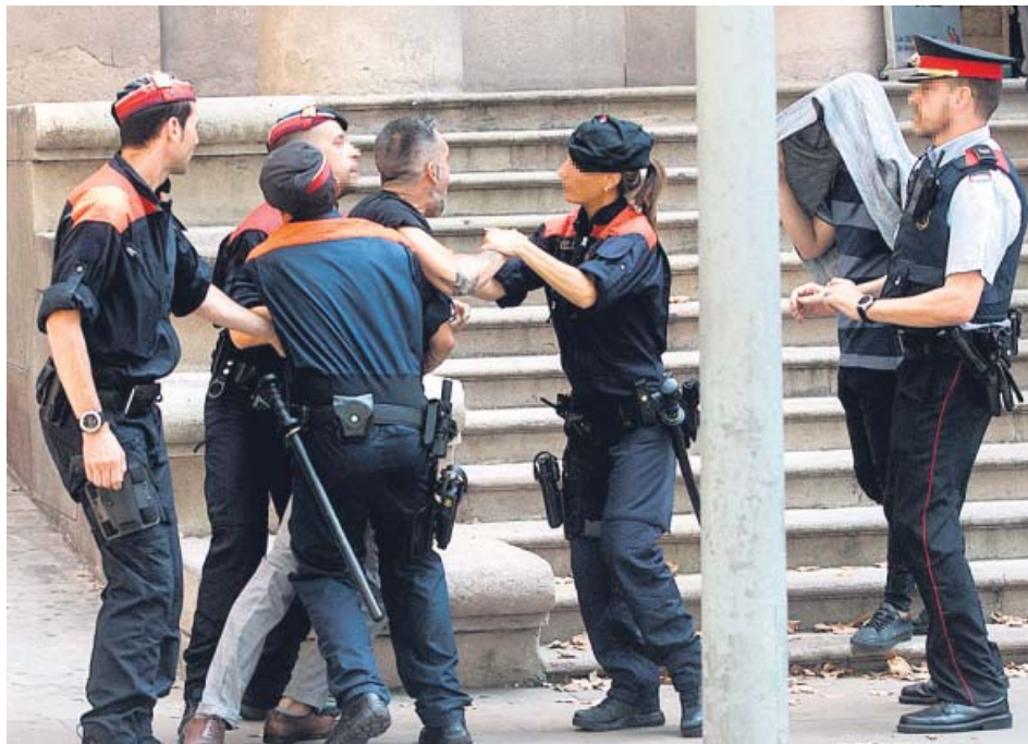
Los Mossos d'Esquadra contienen al tío de la menor de 14 años.

La sesión del juicio de los presuntos autores de la violación se suspendió por una cuestión personal que afectaba a uno de los letrados de la defensa. ●