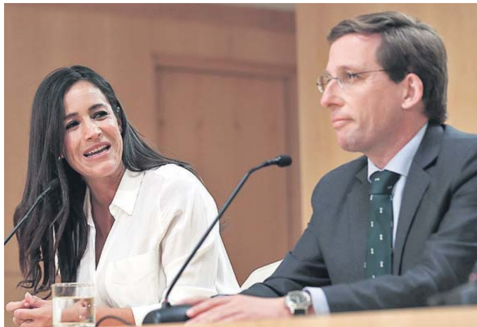
La vicealcaldesa de Madrid, Begoña Villacís, junto al alcalde José Luis Martínez-Almeida.

los Desarrollos del Sureste «entienden que hacer vivienda en Madrid es una urgencia social» y que «el precio de la vivienda está llegando a unos puntos inasumibles. Y remarca: «Es en los Desarrollos del Sureste donde Madrid tiene una oportunidad para hacer vivienda de precio asequible y que no le fuerce a salir del municipio».