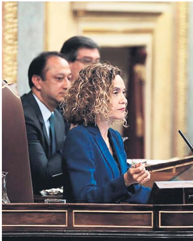
La presidenta del Congreso, Meritxell Batet.

Desde que se constituyó el nuevo Congreso el 21 de mayo, su órgano de Gobierno —la Mesa— y la Junta de Portavoces han decidido sobre el futuro de los diputados en prisión provisional. O sobre dónde ubicar a los grupos en el hemiciclo y repartir los despachos. No sin polémica, porque Vox denunció que a sus diputados les tocan menos metros cuadrados. Ayer aún coleaba la queja de este partido porque dice que el Congreso «viola las normas de prevención de incendios y seguridad en el trabajo». Pero la función de control al Gobierno