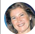
SARA BARAS La bailarina estrena Sombras en Londres

«Vas subiendo escalones y a veces no te crees que seas tú la que estás en uno de los de arriba»