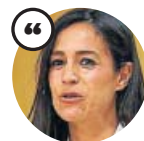
BEGOÑA VILLACÍS Vicealcaldesa de Madrid

«En los últimos cuatro años, aproximadamente, el precio del alquiler subió un 34% y el de las ventas creció un 36%»