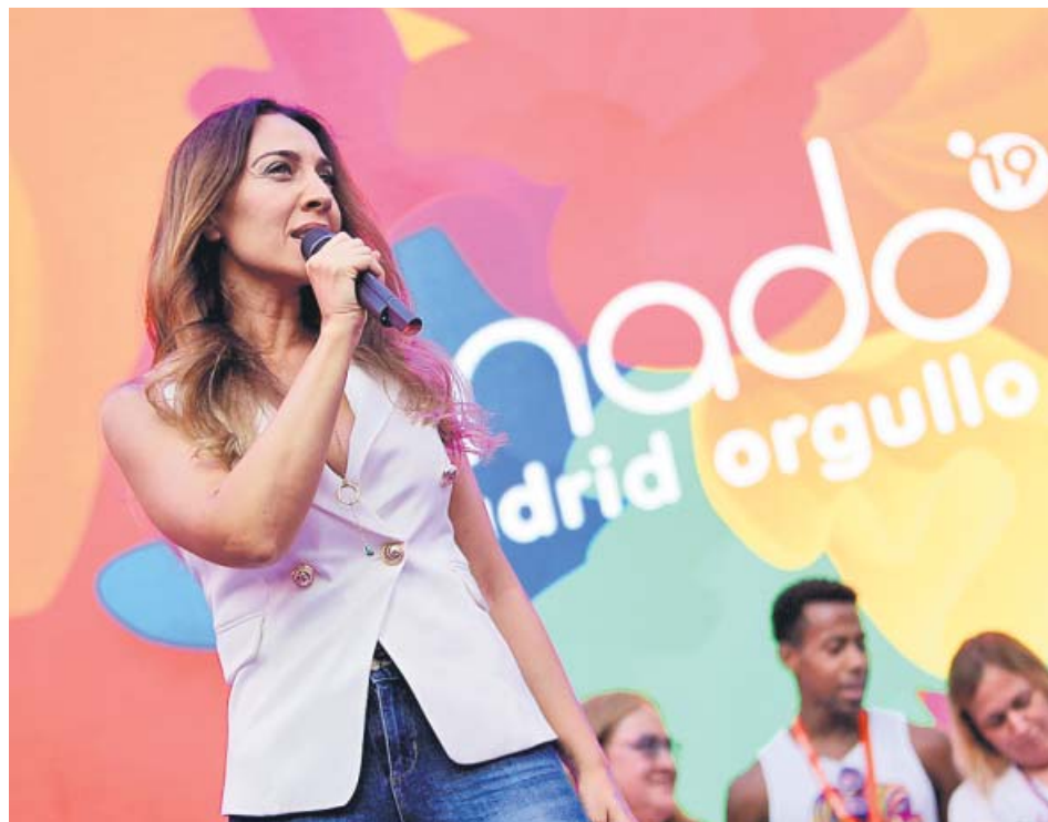
Mónica Naranjo se dirige al público en la plaza de Pedro Zerolo. JORGE PARÍS

La drag queen La Plexy fue la maestra de ceremonias y la encargada de dar la bienvenida a los asistentes en los momentos previos a la lectura del pre-