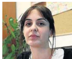
Rita Maestre Portavoz de Más Madrid

Dinero: 45.964 euros en dos cuentas bancarias. Bienes: Participaciones de entre el 33% y el 50% en tres inmuebles de Madrid y uno en Villanueva del Pardillo por un valor total de 169.925 euros.