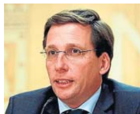
J. Luis Martínez-Almeida Alcalde de Madrid

Dinero: 52.389 euros en dos cuentas bancarias. Bienes: Un piso de 149.593 euros en Madrid; un 5% y un 6% de otros dos inmuebles heredados, una moto Yamaha Nmax y un coche Mercedes Benz Clase A.