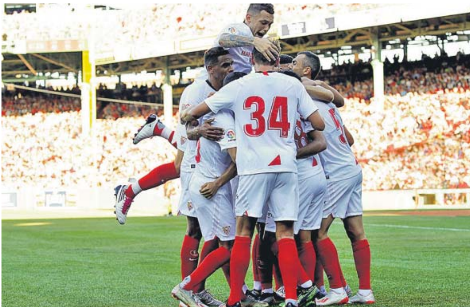
Los jugadores del Sevilla celebran uno de sus goles.

VICTORIA Los de Lopetegui derrotaron al Liverpool (2-1) con los goles de Nolito y el canterano Pozo DE JONG fue uno de los jugadores más activos del Sevilla, creando mucho peligro... sin puntería SALVAJE ENTRADA Gnagnon vio la roja tras un patadón a Larouchi, por el que después se disculpó