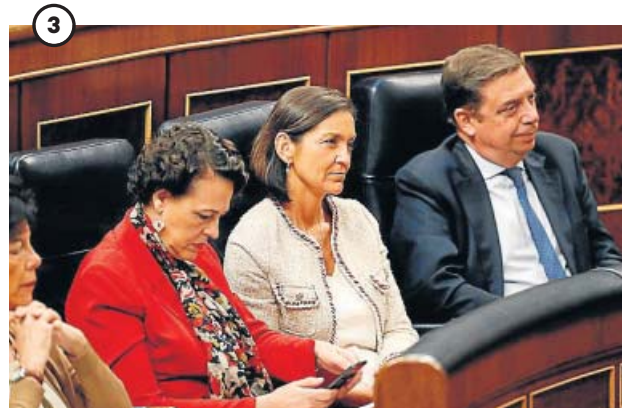
Todos los ministros presentes El Gobierno en funciones estuvo presente al completo en el Congreso de los Diputados. Ocuparon sus escaños para escuchar el debate y secundaron el mensaje de Pedro Sánchez