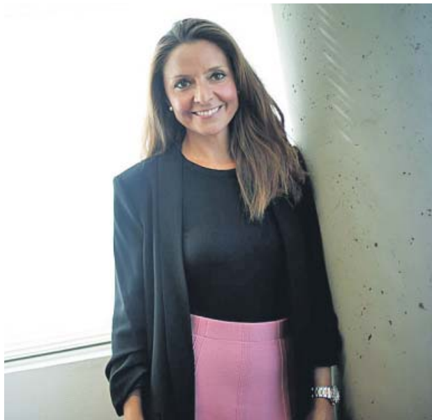
Leyva, autora de ¡Qué fácil es todo y cuánto lo complicamos! E.L.

Leyva estuvo unos meses buscando el puesto ideal hasta que se dio cuenta de que el problema no era el mercado sino ella misma, que no sabía qué quería hacer. «Una mañana me desperté con la intuición de hacer un retiro espiritual. Busqué lugares para pasar un fin de semana tranquilo en la montaña, en contacto con la naturaleza y donde pudiera hacer yoga y meditación o cualquier práctica que me diera paz», explica. «Buscando en internet, apareció la foto de un hombre que promociona-