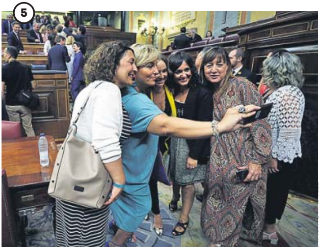
Reencuentro tras dos meses Los diputados regresaron a la Cámara dos meses después de su constitución. El Congreso había estado parado durante las conversaciones entre partidos.