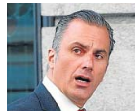
Javier Ortega Smith Portavoz de Vox

Dinero: 18.428 euros. Bienes: Participaciones de entre el 50% y el 87% en dos inmuebles en Madrid y uno en Ribadesella por un valor total de 718.662 € y 510.151 € invertidos entre acciones y bonos.