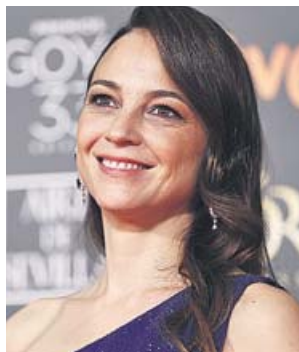
Leonor Watling protagonizará La templanza .

Como producto estrella, la plataforma estrenará El corazón de Sergio Ramos , una serie de ocho episodios sobre el icónico futbolista. ● R. C.