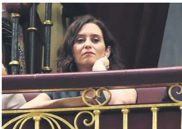
Ayuso, en el Pleno de investidura de ayer en el Congreso.

El principal escollo para la creación del nuevo Ejecutivo sigue siendo Vox. El apoyo del grupo liderado por Rocío Monasterio es imprescindible para que Ayuso pueda ser elegida presidenta en virtud del acuerdo de Gobierno que PP y Cs cerraron hace dos semanas. Pero, antes, Vox exige que