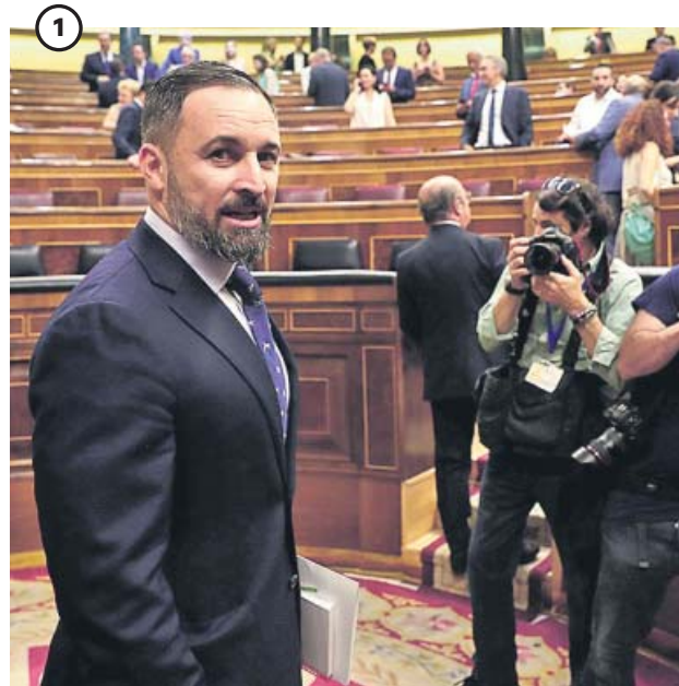
Abascal, en la tribuna El líder de Vox intervino por primera vez desde la tribuna del Congreso para rebatir a Pedro Sánchez y dejar claro su «no». Asimismo, los grupos ocuparon sus nuevas ubicaciones.

La primera jornada de la investidura dejó varios detalles, entre los que no faltó el mensaje secesionista ni el estreno de algunos diputados, así como la primera intervención de Vox.