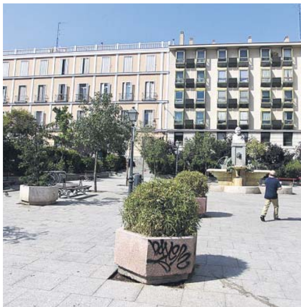
Un hombre paseando, ayer, por la plaza de Pedro Zerolo.