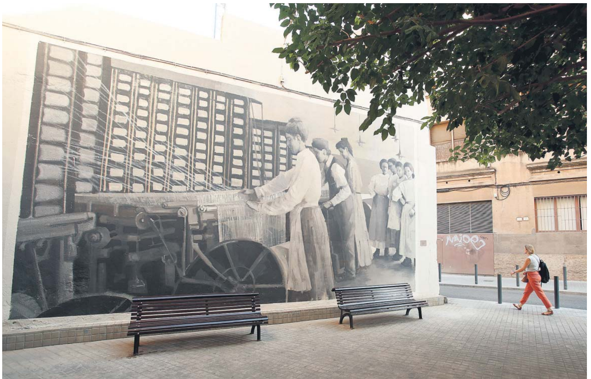
Un evocador mural pintado por el artista Slim Art nos recuerda la actividad que llevaban a cabo las hilanderas de las colonias textiles que marcaron el perfil de L'Hospitalet en buena parte del siglo XX. Aigües de Barcelona ha querido poner su granito de arena para recuperar una parte de la memoria colectiva y rendir tributo a las mujeres y hombres que, con su esfuerzo, contribuyeron a transformar nuestras ciudades y nuestras vidas.