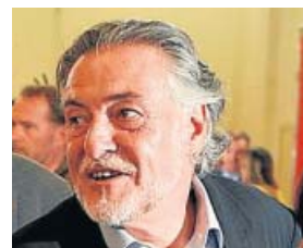
Pepu Hernández Portavoz del PSOE

Dinero: 13.000 euros en tres cuentas bancarias. Bienes: Ninguna propiedad registrada.