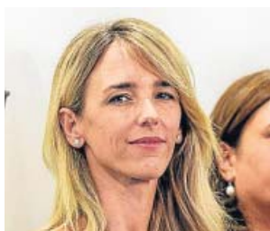
Cayetana Á. de Toledo Portavoz en el Congreso

Fue la número uno de la lista por Barcelona en las elecciones del 28-A. Presidenta de Libres e Iguales, se trata de la gran apuesta de Pablo Casado.