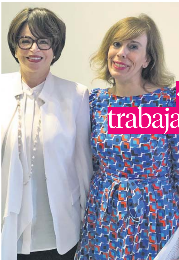
Valerie Jarrett (izda.), con la autora de la entrevista.

Valerie Jarrett, asesora de Obama en la Casa Blanca, habló con Inspiring Girls y 20 minutos en Nueva York, durante el Ellevest Network