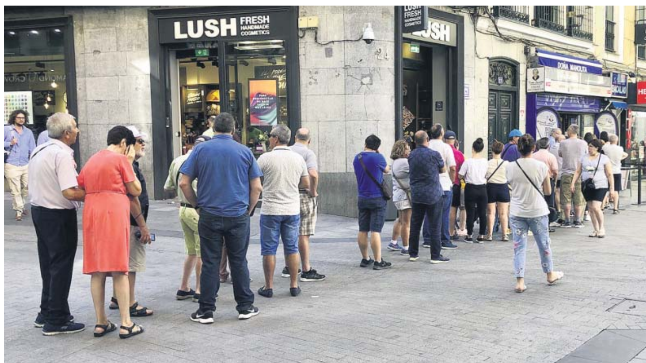
Decenas de personas esperaban ayer en la conocida administración para comprar sus décimos.

Jugar a la lotería siempre es un acto de fe. Nunca está garantizado el premio, pero hay administraciones que año sí y año también reparten miles de euros. Es el caso de la conocida administración Doña Manolita, en la ciudad de Madrid. Por eso, en la calle del Carmen de la capital se llevan registrando desde hace semanas colas de personas llegadas de todos los puntos de la geografía española para comprar los décimos del sorteo extraordinario de la lotería de Navidad del próximo 22 de diciembre. ●