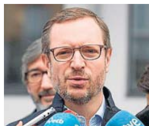
Javier Maroto Portavoz en el Senado

Fue la número uno de la lista por Barcelona en las elecciones del 28-A. Presidenta de Libres e Iguales, se trata de la gran apuesta de Pablo Casado.