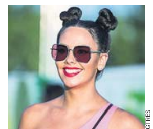
Una chef muy especial.

La presentadora preparará dos platos con langostinos en un 'showcooking'