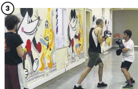
Actividades a elegir

Los jueves, viernes y sábados el colectivo Yogui no es solo un oso organiza una sesión gratuita de dos horas de yoga.