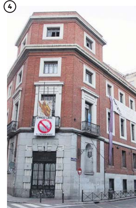
Pancartas y dibujos en su fachada

Gracias a las dimensiones del edificio La Ingobernable puede ofertar una oferta cultural muy heterogénea. En la imagen, tres chicos boxean.