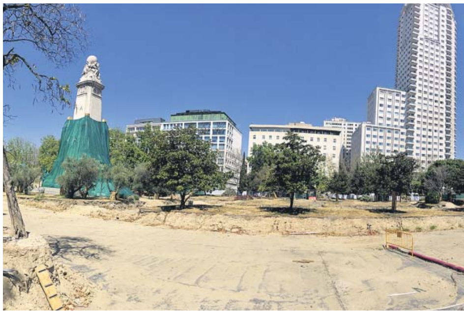
Estado actual de las obras de reforma de la Plaza de España. JORGE PARIS

Las obras de remodelación de Plaza de España acarrearán cortes de tráfico en algunas de las calles que rodean a esta plaza desde el próximo lunes. El acceso al túnel por la Cuesta de San Vicente, entre otros, permanecerá cerrado hasta agosto del próximo año. El Ayuntamiento distribuirá estos días 10.000 folletos explicativos con los itinerarios alternativos. ●