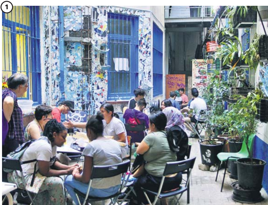
El patio del edificio, decorado por los propios integrantes de La Ingobernable

Desde Navidad, La Ingobernable ha acogido a tres grupos de refugiados que han utilizado el edificio como centro de día. En la imagen, un grupo de migrantes que cuentan con un grupo de apoyo charlan en el patio. La pared está decorada a mano por algunos de los miembros del colectivo.