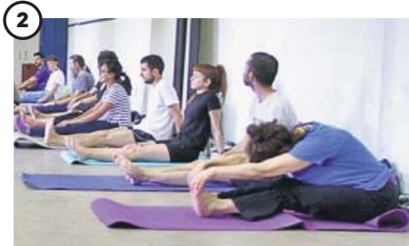
Dos horas de yoga durante tres días

Desde Navidad, La Ingobernable ha acogido a tres grupos de refugiados que han utilizado el edificio como centro de día. En la imagen, un grupo de migrantes que cuentan con un grupo de apoyo charlan en el patio. La pared está decorada a mano por algunos de los miembros del colectivo.