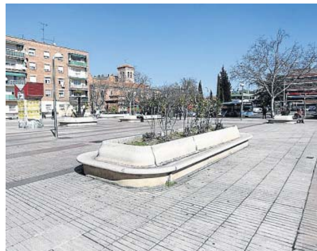
Plaza de los Misterios, en Ciudad Lineal. JORGE PARÍS

nuevo diseño que planeaban para la plaza Encuentro, el cambio de tráfico que traería las obras no convenció a sus residentes. En el caso de la plaza Puerto Canfranc (Vallecas) la falta de presupuesto haría inviable el proyecto, según calculan los socialistas. A estos problemas se suman otros legales y administrativos como la protección del BIC y los viajes del agua (plaza de la Duquesa de Osuna) u otros asuntos que superaban la intervención municipal. Así ocurre en la plaza Cívica San Blas donde sus vecinos, conscientes del problema, exigen el arreglo. «Ahora es un barrizal», explica la asociación del distrito. No son los únicos que discrepan de la decisión. En Ciudad Lineal, la plaza de