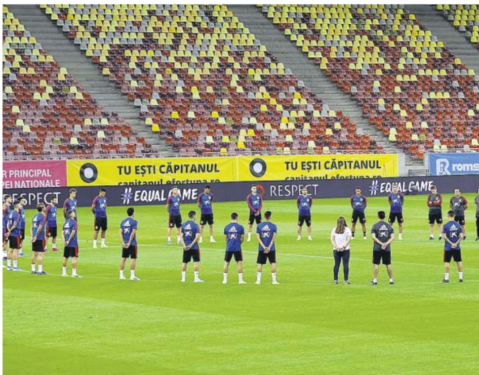
La selección guardó ayer un minuto de silencio por la muerte de Blanca Fernández Ochoa.