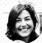
María José Rienda Sec. de Estado para el Deporte

Nos hizo soñar que una medalla olímpica era posible