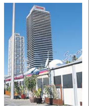
Imagen de la zona de ocio del Port Olímpic.

subieron este tipo de robos en el conjunto de Cataluña comparando los mismos periodos.