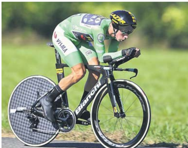
Roglic, durante la crono de Pau.

La Vuelta afronta las últimas oportunidades para desbancar al esloveno, que afronta optimista las etapas que faltan