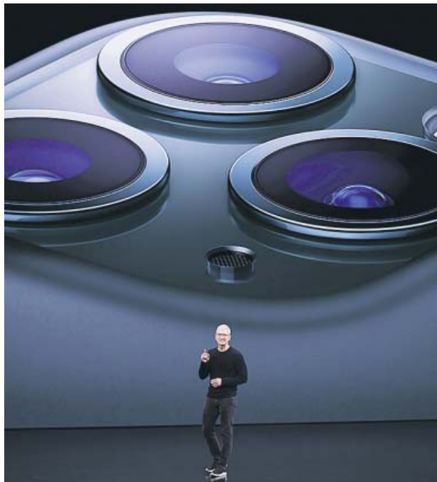
Tim Cook, director ejecutivo de Apple.

positivo de gama alta tiene, además, un módulo con tres cámaras traseras —normal, telefoto y ultra gran angular— y dos versiones, una de 5,8 pulgadas (desde 999 dólares) y