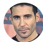
MIGUEL ÁNGEL SILVESTRE El actor es Ibar en la serie 'El corredor de la muerte'

«No soy vidente, pero creo en Pablo Ibar. La serie cuenta los hechos tal cual, la gente juzgará las contradicciones»