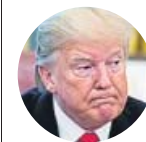
DONALD TRUMP Presidente de Estados Unidos

«No quiero que gente que no tenía que estar en Bahamas venga a EE UU. Incluida gente muy mala y miembros de bandas»