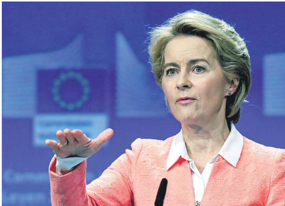
La presidenta de la Comisión Europea, Ursula Von der Leyen, ayer, en rueda de prensa.

La presidenta electa de la Comisión Europea, Ursula von der Leyen, presentó ayer su nuevo equipo de gobierno para la legislatura hasta 2024, un colegio de comisarios con mucho peso en áreas como el clima y la digitalización y con carteras para Italia, Francia o Irlanda. La estructura de la nueva Comisión —paritaria por primera vez— cuenta con ocho vicepresidencias, que incluyen tres ejecutivas que vertebran las prioridades de la conservadora alemana. ●