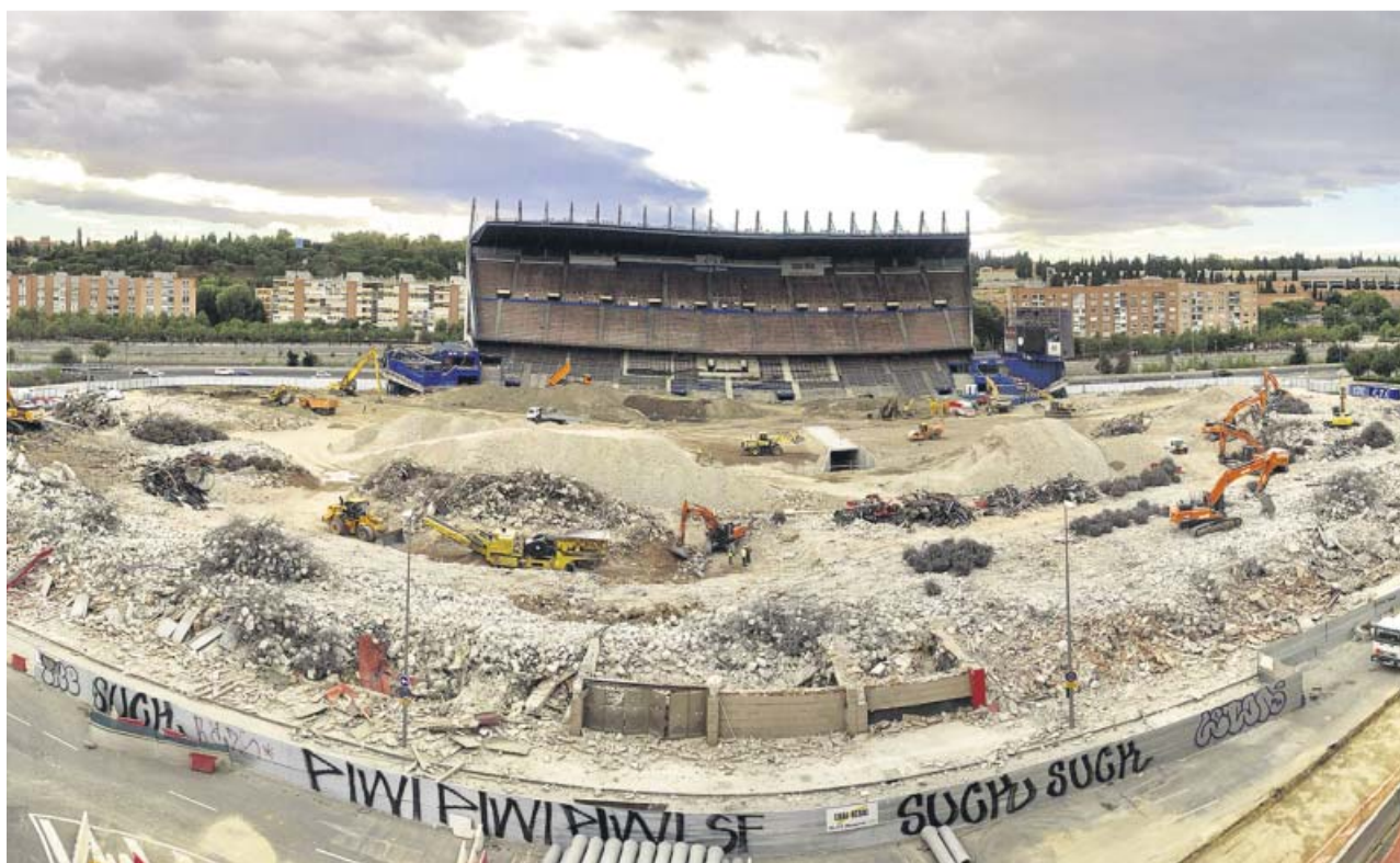
El estado del derribo del Vicente Calderón, ayer, con la grada sobre la M-30 todavía en pie.