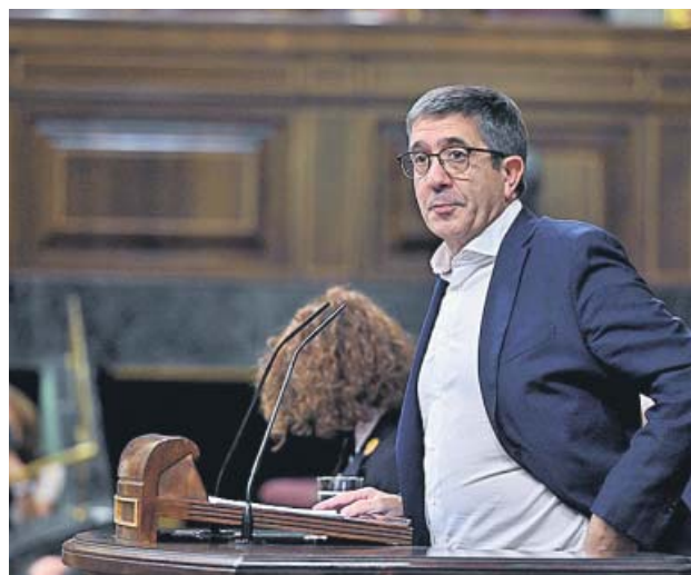
Patxi López, ayer en su intervención en el Congreso.

Se trata de la segunda vez que se toma en consideración esta propuesta, ya que la iniciativa decayó en la pasada legislatura después de que las Cortes se disolvieran por la convocatoria electoral, un escenario que podría volver a repetirse de no conformarse un Ejecutivo. La propuesta socialista para regular la eutanasia pide «reconocer