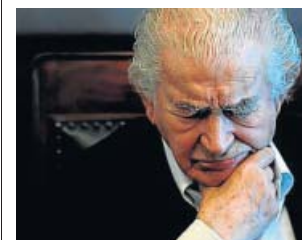
Gamoneda, Premio Cervantes 2006, ayer en Madrid.

El poeta Antonio Gamoneda, Premio Cervantes 2006, presentó ayer en Madrid Esta luz. Poesía reunida , volumen que recoge los versos que ha escrito durante más de siete décadas. Una obra que, a sus 88 años, «quiera o no, tiene que ser a la fuerza casi un libro testamentario», dijo. Además de esta poesía reunida, sus memorias también «están al caer», explicó el