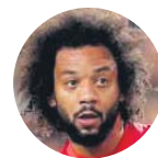
Marcelo Cervicodorsalgia postraumática