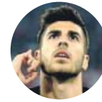
Marco Asensio Rotura ligamento rodilla izquierda