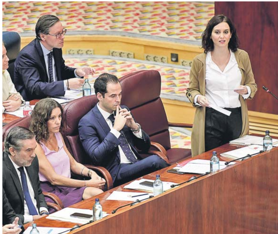
La presidenta Ayuso, durante una de sus intervenciones en el pleno de la Asamblea de ayer. PP

A pesar de lo limitado de la deducción —muy alejada del acuerdo de «bajar la tarifa autonómica del IRPF para beneficiar a todos los contribuyentes madrileños» recogido en el pacto de gobierno firmado por PP y Cs en verano—, Ayuso continuó defendiendo que su Gobierno implementará «la mayor bajada de impuestos de la historia».