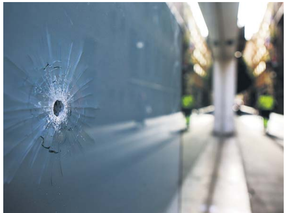
Lugar donde se produjo un disparo ayer de madrugada, cerca de la Rambla del Raval.

La Fiscalía pide que Gallego cumpla efectivamente 25 años de cárcel, sin beneficios penitenciarios, y que durante diez más no pueda estar en la Comunidad de Madrid, donde viven las víctimas. Las letradas de las afectadas se adhirieron a esta petición, como también lo hizo la defensa, que reiteró la necesidad de ayudas para su representado. ●