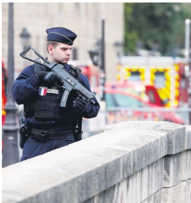
Un agente vigila la comisaría donde tuvo lugar el ataque.

En un primer momento, eso sí, se apuntó que las motivaciones tenían que ver con un asunto interno que afectaba al atacante. El propio fiscal anunció que se ha abierto una investigación por «homicidio voluntario sobre persona depositaria de autoridad pública» y por «tentativa de homicidio sobre persona depositaria de la autoridad pública», aunque el contacto con la unidad antiterrorista es permanente.