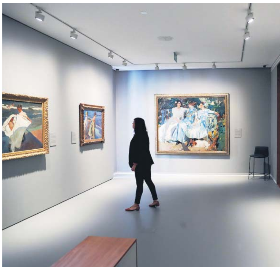
Obras de Joaquín Sorolla en la Fundación María Cristina Masaveu Peterson.

El conocido como Paseo del Arte de Madrid amplía desde hoy su recorrido porque, con la inauguración de la Fundación María Cristina Masaveu Peterson, ubicada cerca de la plaza de Colón, los amantes del arte encontrarán una propuesta donde contemplar obras de artistas como Anglada Camarasa o Zurbarán nunca antes vistas. El espacio propone un recorrido por 117 de las más de 300 obras de la colección de Masaveu. El recorrido arranca con Goya y se extiende hasta el modernismo y posmodernismo catalán. Aunque uno de los núcleos principales es Sorolla, ya que la familia Masaveu cuenta con la tercera colección particular más importante del mundo, después de la del propio Museo Sorolla y la de la Spanish Society. ●