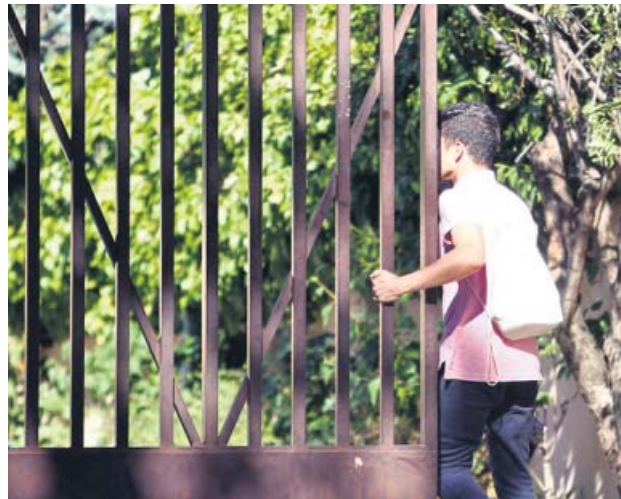
Un mena junto al centro de acogida de Hortaleza.

Porque, según los datos municipales, en 2018 llegaron a la Comunidad de Madrid 20.700 solicitantes de asilo y en lo que llevamos de 2019, ya son más de 35.000 los solicitantes que están llegando a la ciudad. La viceal-