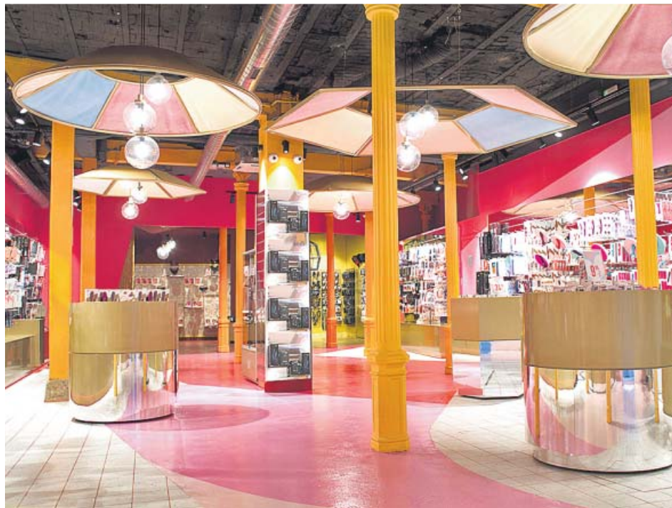
El nuevo aspecto de las tiendas eróticas es abierto y acogedor.