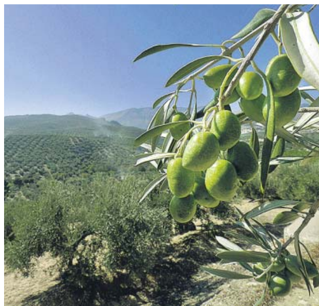
España exporta 120.000 toneladas de aceite a EE UU. 20M

SOLUCIÓN El Gobierno central ha contactado con Bruselas para que defienda los intereses de las empresas