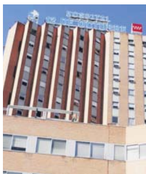
Hospital Universitario 12 de Octubre.

ción de espacios, informó el Gobierno regional. La remodelación, incluida en el Plan de Inversiones de Infraestructuras Sanitarias, durará 12 meses y contará con un presupuesto de 4,3 millones de euros. Este proyecto será llevado a cabo en fases sucesivas y afectará a más de 5.600 metros cuadrados. Las nuevas Urgencias conectarán en un futuro directamente con el nuevo edificio de hospitalización, proyecto actualmente en fase de redacción. ●