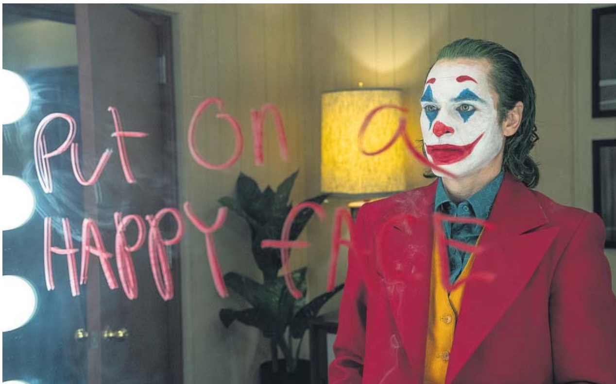
Arthur Fleck (Joaquin Phoenix), un hombre que siempre soñó con hacer reír a la gente.