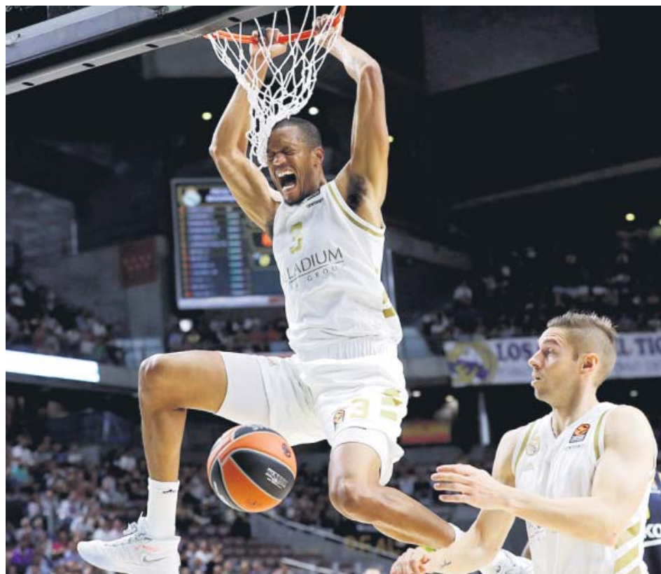
Mate de Anthony Randolph ante el Fenerbahce.

El campeón ha sufrido muchas bajas este verano. Entre ellas, la de Sergio Rodríguez, que ha cambiado Moscú por Milán. Pero también la de su gran estrella, Nando De Colo, que se ha ido al Fenerbahce. Para compensarlo han llegado Mike James y dos interiores, Johannes Voigtmann y el ex NBA Kostas Koufos.