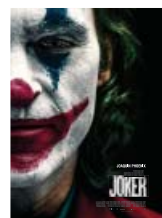
2019. Director Todd Phillips Reperto Joaquin Phoenix, Robert De Niro, Frances Conroy

celebridad; además, Arthur Fleck (Phoenix) encarna una forma extrema y patológica de incel [célibe involuntario]. A medida que avanza la película,