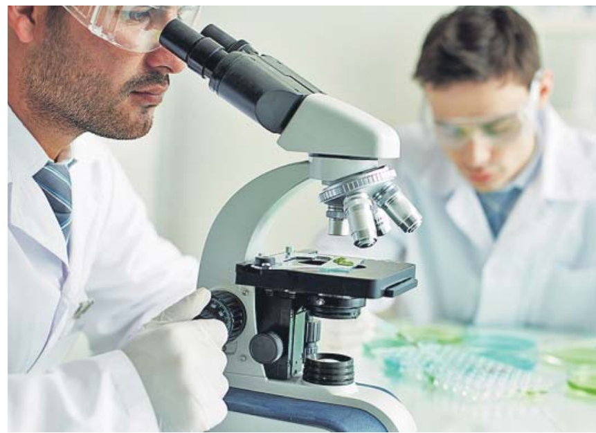
El conjunto completo de genes vendría a ser nuestro manual de instrucciones.

Aún se desconocen las circunstancias exactas en las que se produjo el intento de homicidio. Los investigadores no han aclarado por qué el menor estaba disgustado con la relación que mantenía su madre con el joven. Por tanto, se desconoce si los celos estarían detrás de este caso o si se trata de un ajuste de cuentas. De lo que sí están seguras las autoridades es de que este suceso nada tiene que ver con una reyerta entre bandas, sino de un caso más doméstico. ●