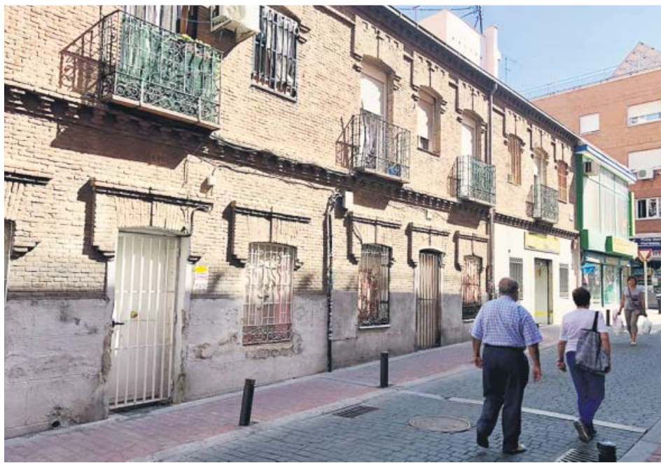
Viviendas tapiadas en Vallecas para evitar que sean okupadas. JORGE PARÍS

La Comunidad destina alrededor de cuatro millones de euros al año a mantenimiento y seguridad en su parque