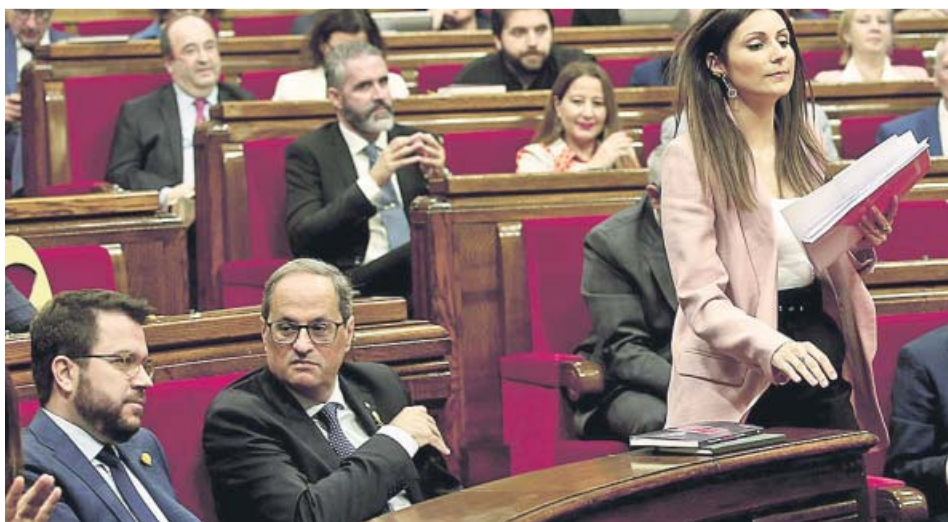
Lorena Roldán pasa de camino al estrado junto a Quim Torra, que mira para otro lado.

SIN APOYOS El PP fue el único que la apoyó. El PSC se abstuvo y los Comunes votaron en contra junto a los independentistas REPROCHES Roldán pidió apoyo a los socialistas «por imperativo moral», pero Iceta criticó la moción por ser «propagandística»