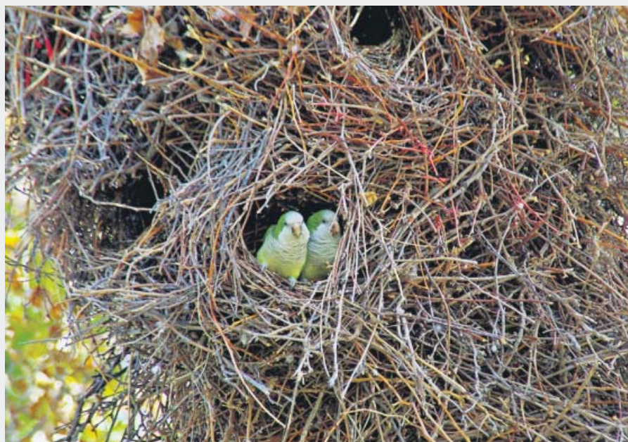
Una pareja de cotorras argentinas en uno de sus nidos, que destacan por su tamaño.

Son muchos los efectos negativos que producen estas aves sudamericanas. Tal y como enumeró Soria Carreras, el primero es el de seguridad, ya