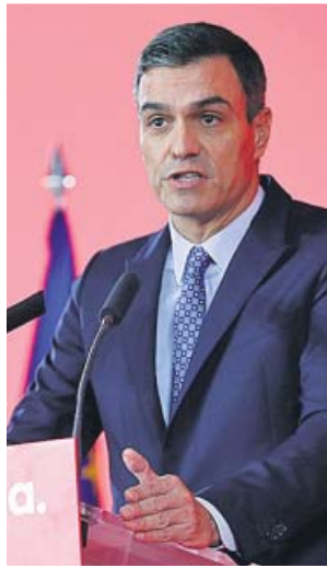
Sánchez, en la presentación de su programa electoral.

Respecto a las exigencias de Pablo Iglesias para formar un Gobierno de coalición, afirmó que tras las elecciones de abril le ofreció «una coalición y tres ministerios», pero «escuchando a Iglesias las últimas semanas, como ellos conciben la coalición es inviable». «Nosotros siempre hemos estado dispuestos a llegar a acuerdos; pido una dosis de responsabilidad a los partidos para que permitan la gobernabilidad», contestó Sánchez a la pregunta sobre si lo que quiere es que, si gana de nuevo, le voten «gratuitamente».