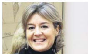
Isabel García Tejerina

Actual diputada, la hermana de Miguel Ángel Blanco liderará la lista por Álava.