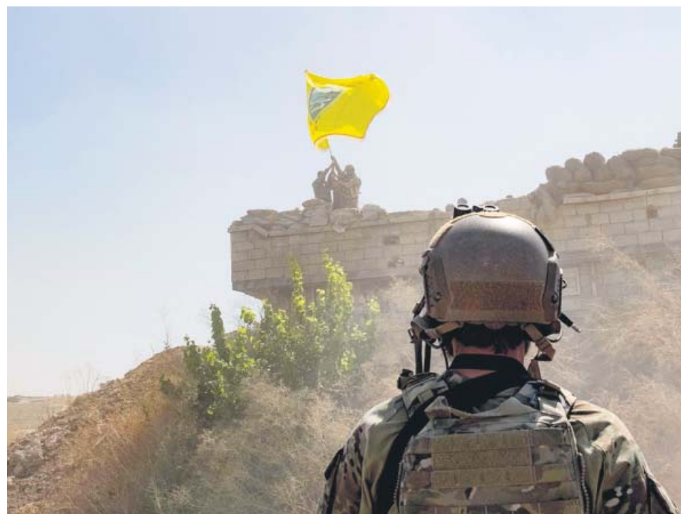
Un soldado estadounidense observa a miembros de las fuerzas sirias.

Didier Queloz Nacido en 1966 en Ginebra (Suiza), imparte clases en el Departamento de Astronomía de la Universidad de esa ciudad, trabajo que compagina con el de profesor en Cambridge.