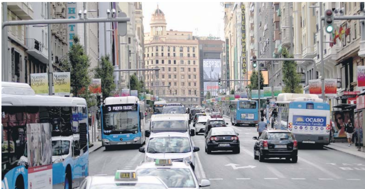
Una imagen del tráfico en la Gran Vía, con taxis, vehículos privados y autobuses circulando en ambos sentidos. JORGE PARIS