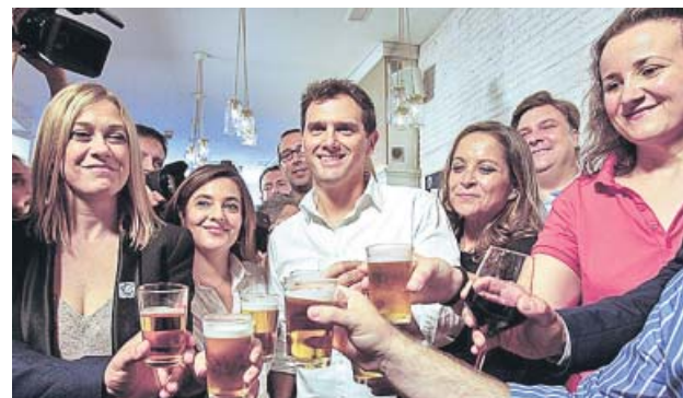
Albert Rivera, en Guadalajara.