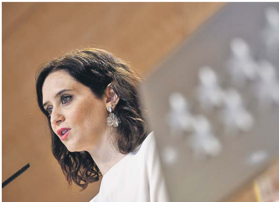
La presidenta Ayuso, durante la rueda de prensa posterior al Consejo de Gobierno de ayer.

«A estas deducciones seguirán otras muchas, a lo largo de toda la legislatura el Gobierno de la Comunidad va a bajar los impuestos», declaró Ayuso, que compareció junto al vicepresidente, Ignacio Aguado. Desde la oposición, el anuncio se ha recibido con escepticismo y fuentes del PSOE consideran que «ser-