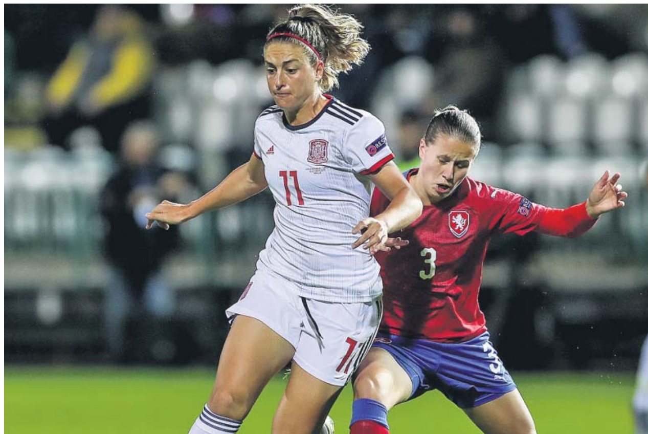
Alexia Putellas en el partido entre España y la República Checa.

España era un vendaval y su dominio no cesó ni con los dos