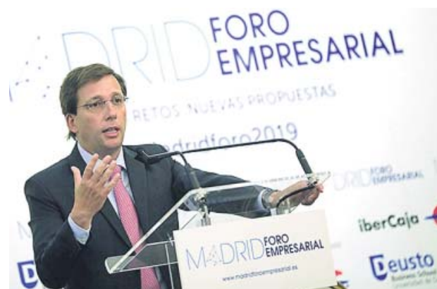
El alcalde participó en el V aniversario del foro.

que les transfieran a ellos mismos el dinero: «Si nos ponen los 40 millones para la promoción de Madrid nos olvidamos de la tasa turística», añadió. Pero el alcalde mantuvo su pulso y, pese a «comprender» la postura de Alfaro, insistió en que «al margen de establecer la financiación, lo primero que hay que hacer es un modelo único de turismo donde se utilice cada euro para la financiación del turismo». La tasa turística fue la única petición que el regidor rechazó de las muchas que lan-