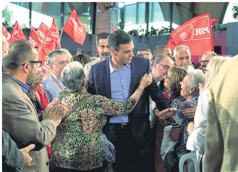
Pedro Sánchez, ayer en un mitin de precampaña en Teruel.

A pesar de la buena marcha de la economía, su enfriamiento es junto al brexit y Cataluña una de las tres «amenazas» que afronta el país, del que acusó directamente al presidente de Estados