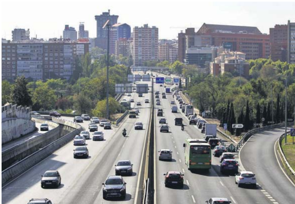
Miles de vehículos circulan a diario en ambas direcciones de la A-2.

INVERSIÓN La obra tendrá un presupuesto de 13 millones que pagarán las cuatro Administraciones