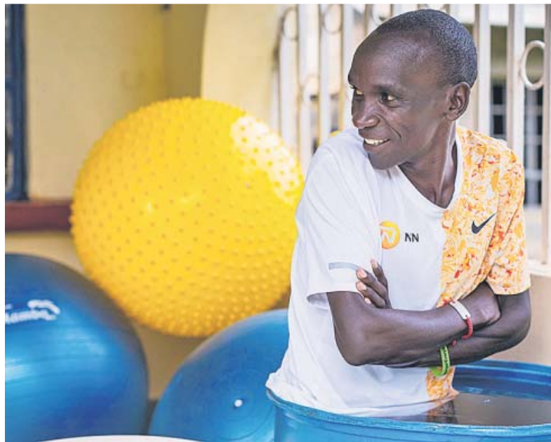
Kipchoge, en dos fases de su entrenamiento: una salida matutina y relajación en un bidón con hielo. INEOS