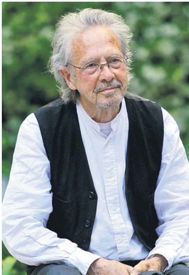
Los escritores Olga Tokarczuk y Peter Handke, premiados con los Nobel de Literatura 2018 y 19.