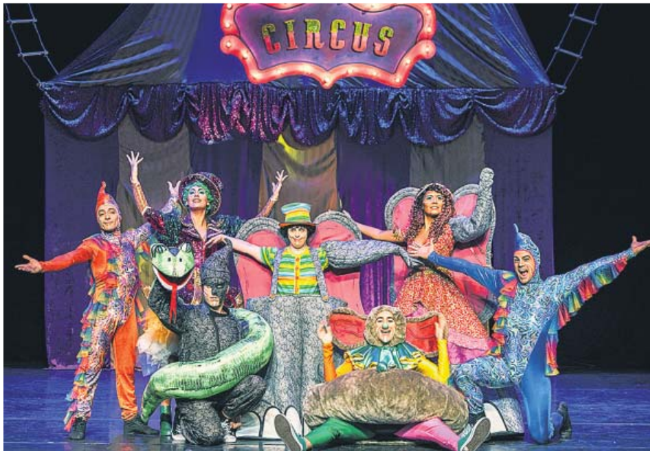
El elenco de Dumbo . El musical, sobre el escenario. JESÚS RODRÍGUEZ MARTÍNEZ