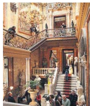
Entrar al Museo Cerralbo será gratis mañana. MINISTERIO DE CULTURA

Además, la Biblioteca Nacional de España abrirá sus puertas de forma gratuita de 10.00 a 14.00 h, enseñando al público el Salón General de Lectura, al que solo tienen acceso los investigadores. La entrada libre coincide con la inauguración en la institución de una nueva e interesante exposición: los visitantes podrán contemplar el Libro de horas