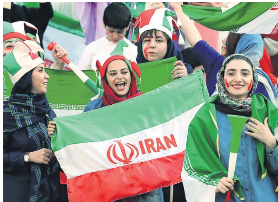
En el Azadi se vendieron 3.500 entradas solo para las mujeres, que animaron a su país.

Las mujeres iraníes rompieron ayer un tabú con su entrada por primera vez en la historia al estadio Azadi de Teherán, donde fueron las protagonistas indiscutibles del partido clasificatorio del Mundial entre las selecciones de fútbol de Irán y Camboya. Armadas con banderas, gorros y trompetas, comenzaron a animar en un ambiente ensordecedor más de dos horas antes de que arrancara el duelo, que terminó con la victoria aplastante de Irán (14-0). ●