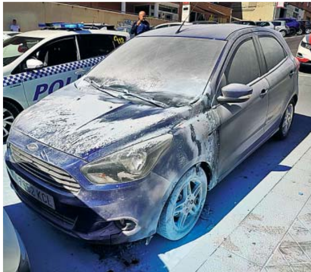
Coche quemado ayer en San Blas.

El caprichoso destino quiso que unos minutos después,