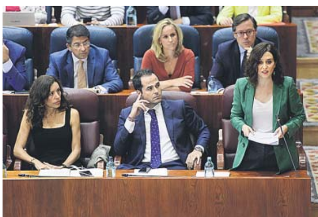
Ayuso interviene durante el pleno de ayer.

La Comunidad seguirá sin elaborar presupuestos debido a que «la incertidumbre sigue siendo la misma»