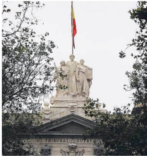
El Supremo dio luz verde definitiva a la exhumación.

El Gobierno trabaja con la hipótesis de que la sentencia sobre el juicio a los presuntos responsables políticos del proceso independentista se dará a conocer este lunes, 14 de octubre. Será el inicio de una semana en la que se esperan reacciones políticas y en la calle al fallo del Supremo y que terminará el sábado con la confluencia en Barcelona de las llamadas «Marchas por la libertad» que han convocado las entidades soberanistas en las cuatro provincias. Solo hasta que no pase, el Gobierno no cuenta con proceder a la exhumación. Los nietos del dictador