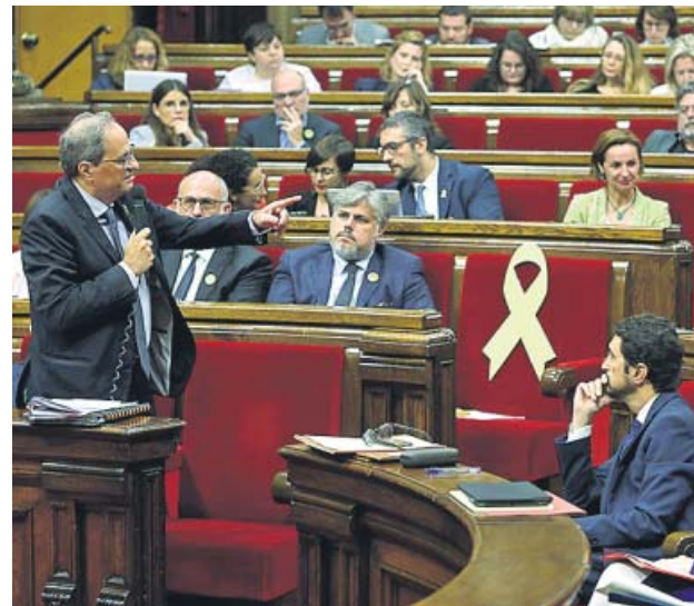
Quim Torra interviene en el Parlament.