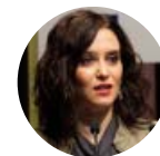
ISABEL DÍAZ AYUSO Presidenta de la Comunidad de Madrid

«Unidas Podemos pisotea la libertad y el derecho a la propiedad como si España fuese un régimen bolivariano»