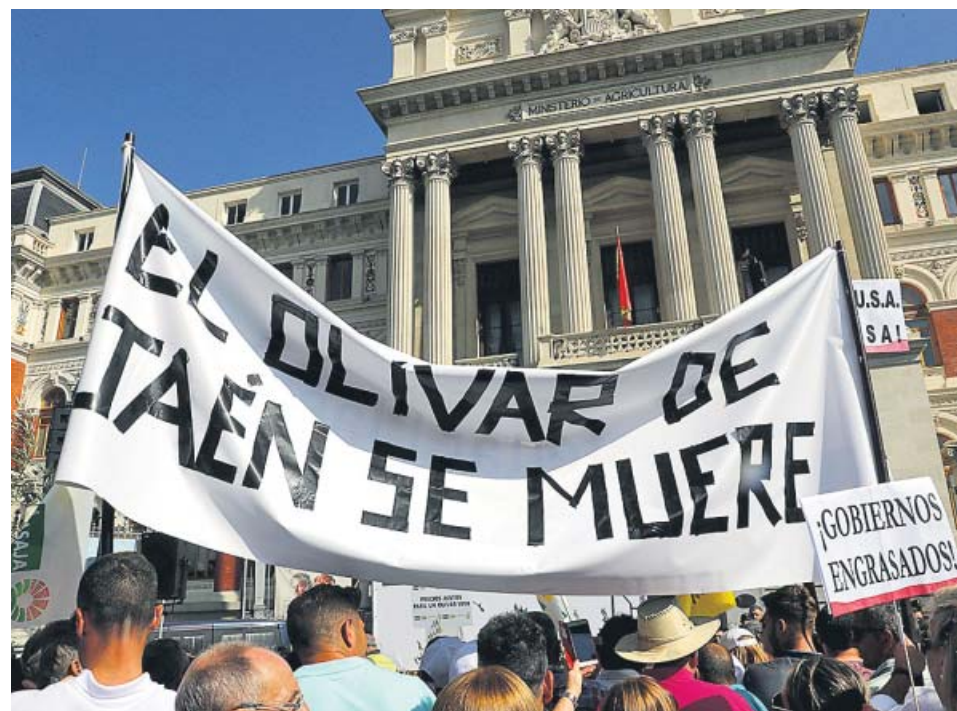
Miles de oliveros manifestándose frente al Ministerio de Agricultura.

Ayuso defendió sus planes basados en la construcción de 25.000 viviendas públicas, el fomento de los grandes desarrollos urbanísticos estancados en los últimos años y en las deducciones fiscales para los arrendadores. «Los jóvenes de la Comunidad de Madrid encuentran las mayores oportunidades gracias a las políticas liberales que hemos aplicado en esta Comunidad», declaró la presidenta, después de que la portavoz de Unidas Podemos, Isa Serra, le acusara de «haber entendido siempre la vivienda como un bien con el que especular». ●