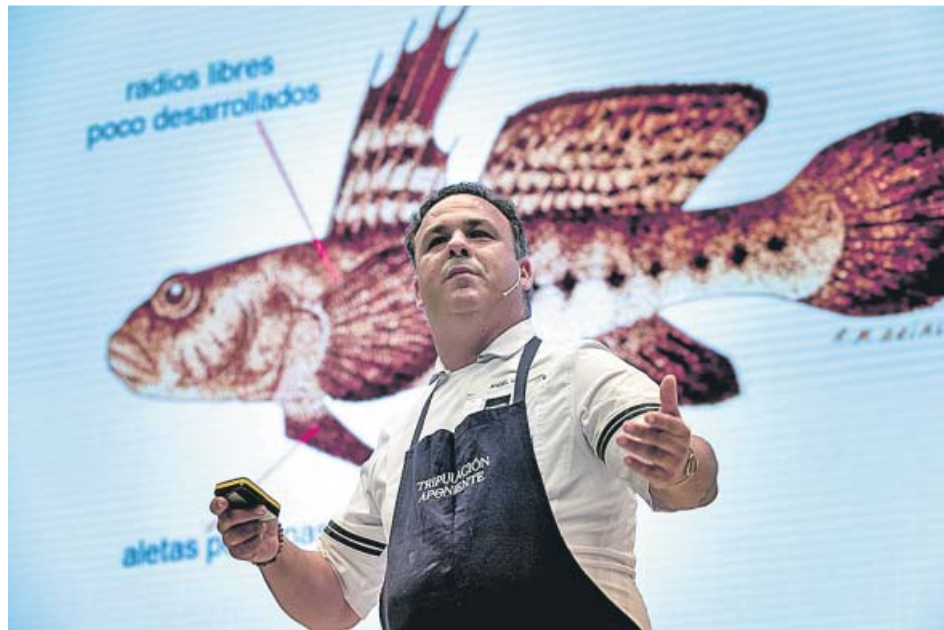
El chef Ángel León habla sobre cocina y sostenibilidad.

Como es ya habitual, León es de los pocos que llegan a los congresos con novedades y un discurso que realmente aporta algo. Sus últimas aportaciones a partir de esa despensa marina son de lo más interesantes. Sin duda, mucho más que