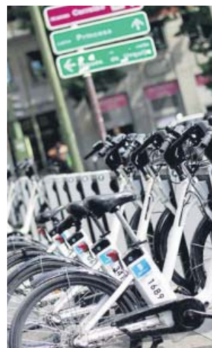
Una estación de BiciMad en el centro de Madrid. JORGE PARÍS

En esta línea, Almeida remarcó que son «contrarios» a esas municipalizaciones, y entienden que esos procesos «no han beneficiado la gestión de esas empresas». «Conviene estudiar la situación, y si hay soluciones mejores y menos gravosas tomaremos la decisión de su momento», sostuvo el alcalde de la capital.