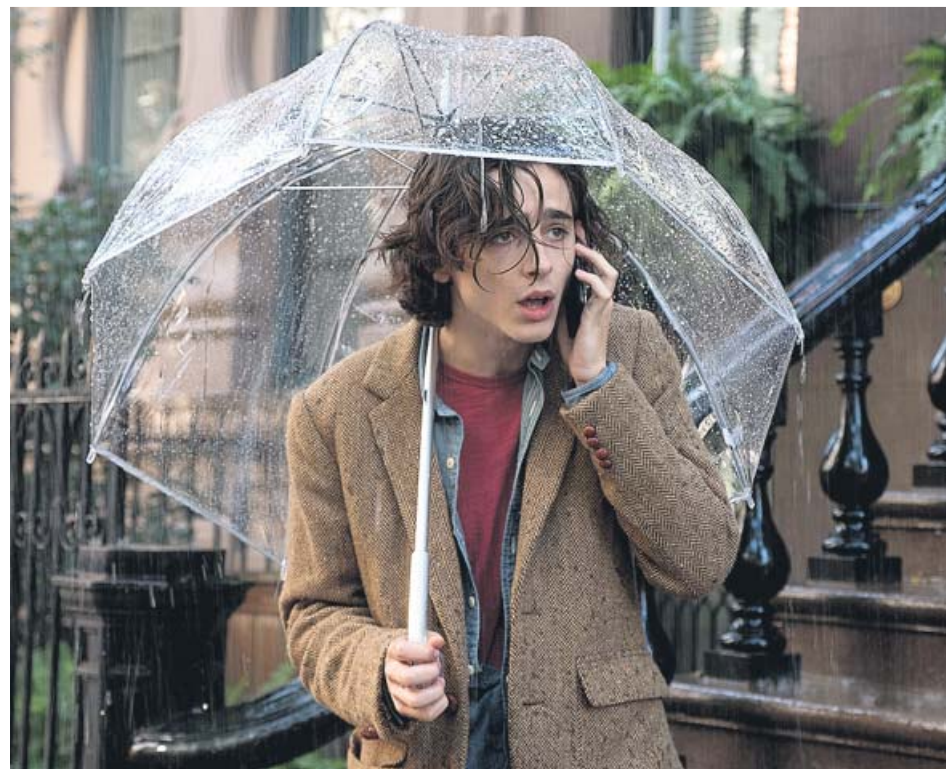
Timothée Chalamet, fenómeno 'alter ego' del cineasta en el filme.

Sin embargo, y por mucho que le pese a cierta corriente neopuritana que se ha instalado en los medios de comunicación, nada de esto hará que Woody Allen abandone esa lista, junto a Groucho Marx, Willie Mays o el segundo movimiento de la sinfonía Júpiter , de cosas por las que merece la pena vivir. ●