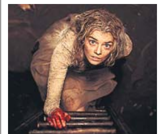
Magnífica Samara Weaving, novia en apuros.

Hay una escena en el filme que engloba las virtudes de la que es ya la comedia de terror de 2019. Grace, que en su noche de bodas tiene que jugar al escondite más sanguinario, trata de meter una bala en un ri-