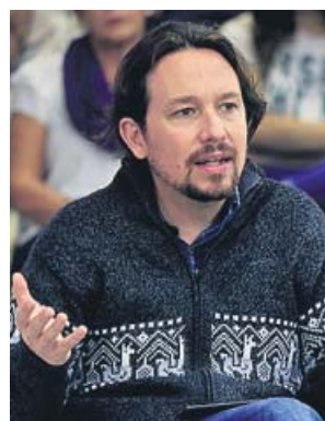
Pablo Iglesias, en el acto sobre ecologismo de ayer.

Unidas Podemos, por su parte, apuesta por un plan más agresivo que adelante este último objetivo al año 2040. Y, dentro de un paquete de medidas que —asegura— creará 600.000 empleos, la formación incluye dos de sus propuestas más señeras: la creación de una empresa pública