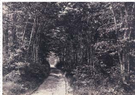
➔ El paisaje, protagonista El bosque de Marly (1871) de Camille Pissarro, y Sendero en el bosque, (1850-1860) de Eugène Cuvelier.