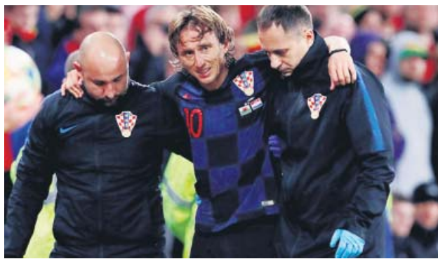
Gareth Bale atendido por el médico galés y Luka Modric retirándose con ayuda del partido en Cardiff.

el Barça, que será el sábado a las 13 horas.