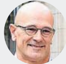
Raül Romeva 12 años de prisión