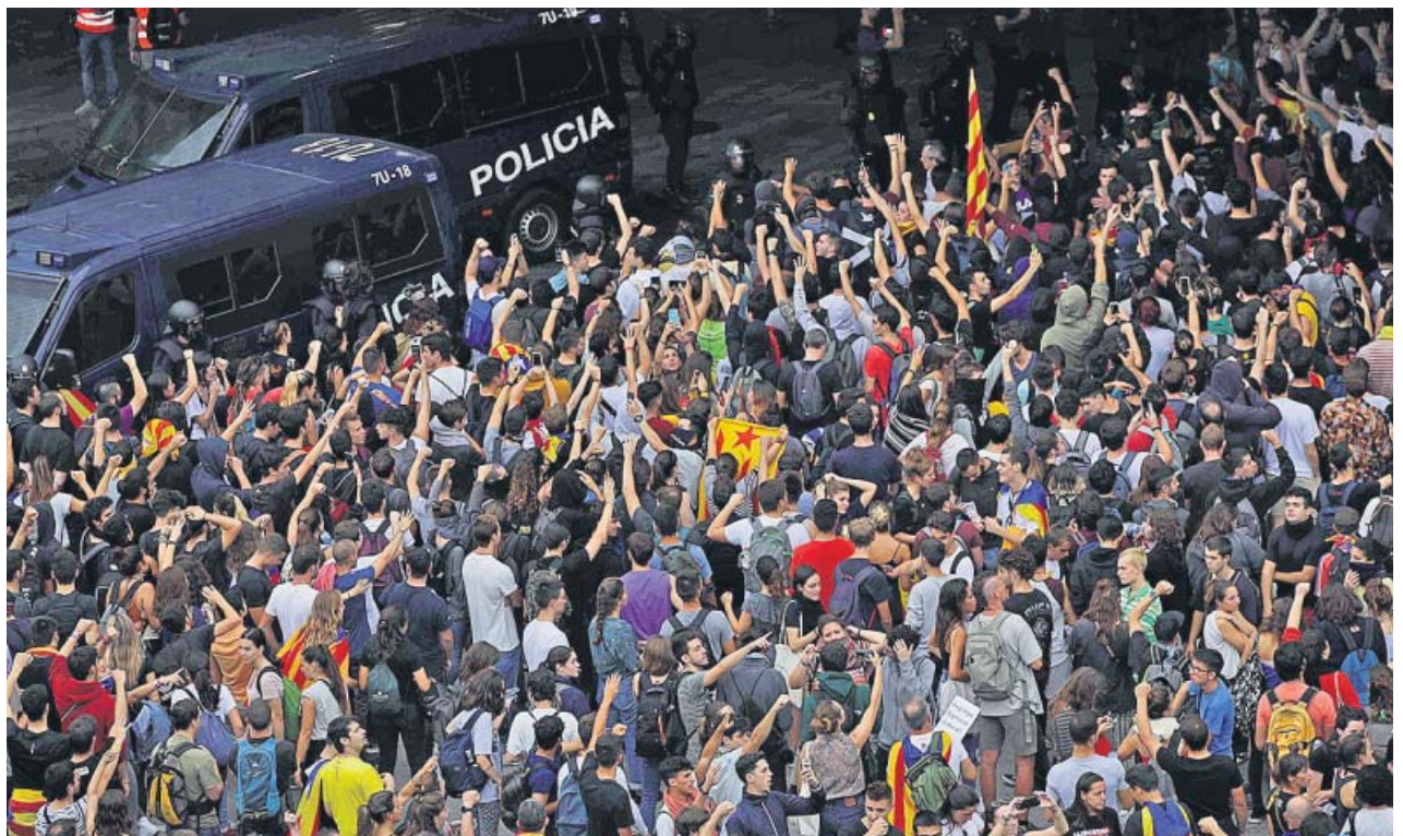
Vista del aeropuerto de El Prat, que ayer concentró la mayor protesta independentista por la sentencia del procés .

La intervención, sin turno de preguntas, de Sánchez se produjo pocos minutos después de que concluyera la que, en los mismos términos, hizo el presidente catalán, Quim Torra, desde el Palau de la Generalitat. Olvidó advertencias previas de que respondería al fallo con el «derecho de autodeterminación» y aunque, como todo el independentismo, lo calificó de «venganza», «un insulto a la democracia y un menosprecio a la sociedad catalana», midió sus palabras para no cometer una ilegalidad. Pidió comparecer en el Parlament y anunció que enviará sendas cartas: una al presidente en funciones y otra al