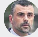
Santi Vila 1 año y 8 meses de inhabilitación