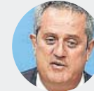
Joaquim Forn 10 años y 6 meses de prisión