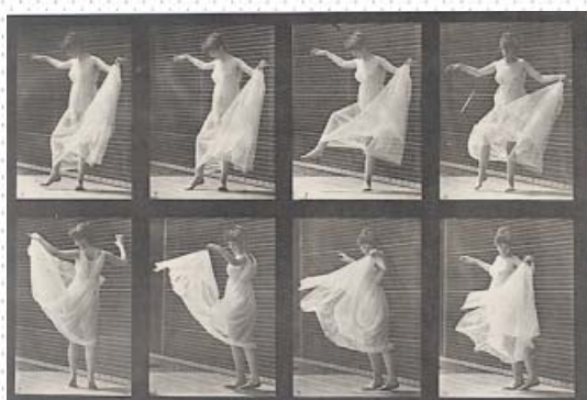
← El movimiento La danza se convirtió en la mejor manera de estudiar los cuerpos en movimiento. Bailarina basculando - Bailarina verde (1877-1879), de Edgar Degas, y Mujer bailando, de la serie Locomoción animal (lámina 189, 1887) de Eadweard Muybridge.