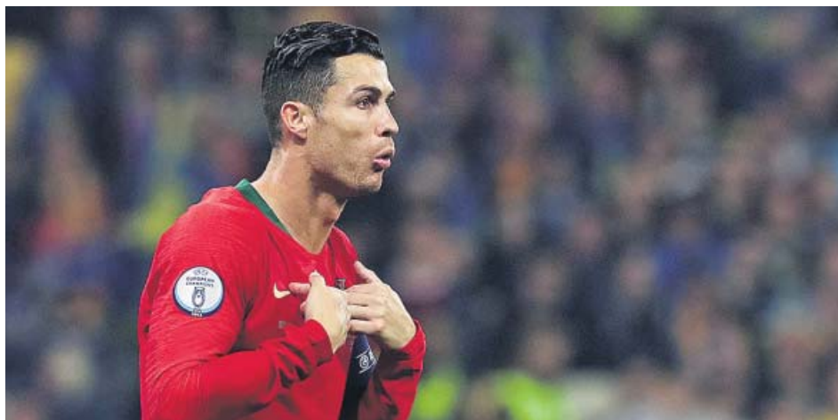
Cristiano protesta una acción durante el partido de ayer.

Sin Sergio Ramos, sancionado, el centro de la defensa estará formado casi con total seguridad por Raúl Albiol e Íñigo Martínez.