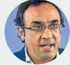
Josep Rull 10 años y 6 meses de prisión