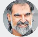
Jordi Cuixart 9 años de prisión