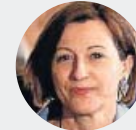
Carme Forcadell 11 años y 6 meses de prisión