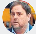
Oriol Junqueras 13 años de prisión