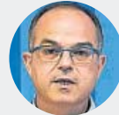
Jordi Turull 12 años de prisión