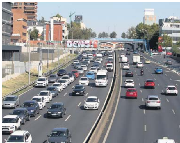
El bus-VAO aliviará el tráfico en la A-2 en unos meses.

El bus-VAO se habilitará en los carriles izquierdos de ambos sentidos de circulación. De acuerdo con los cálculos del Ejecutivo regional, será utilizado cada año por unos 11,2 millones de personas, sobre todo residentes en localidades del corredor del Henares, y hará que sus trayectos por la