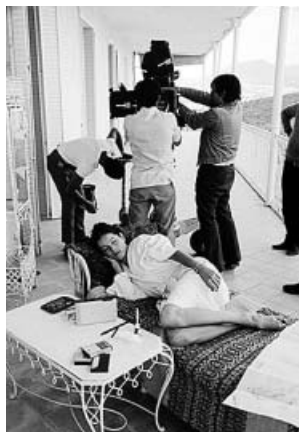
Autorretrato múltiple, Berlín, 1994 (arriba); Sonsoles y unas amigas, Suances, 1954 (izda.) y Descanso en el rodaje Ana y los Lobos, Madrid, 1972. CARLOS SAURA