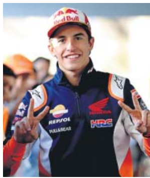
Marc Márquez, haciendo el gesto de la victoria.

tulos». «El de constructores y el de equipos todavía están en juego para Honda», afirmó Márquez. Sobre Márquez habló en la Gazzetta dello Sport uno de sus grandes rivales, Andrea Dovizioso, que no dudó en mojarse a la hora de comparar al piloto español con Valentino Rossi: «En mi opinión, Vale tiene más talento. Analiza y trabaja mucho, pero lo que hace y ha hecho, todo lo que ha ganado, se basa más en el talento y el instinto. Más que Marc». ●