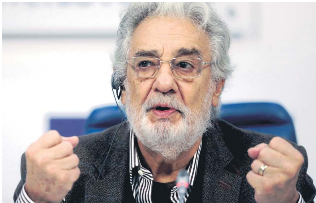
El tenor español Plácido Domingo, durante la rueda de prensa que ofreció ayer en Moscú (Rusia).

N.: Sí, sí. (Toni: «Y a mí»). Es una obra maestra. Hay gente que la critica, dicen que es neoliberal, pero a mí me parece una historia de amor preciosa. ●