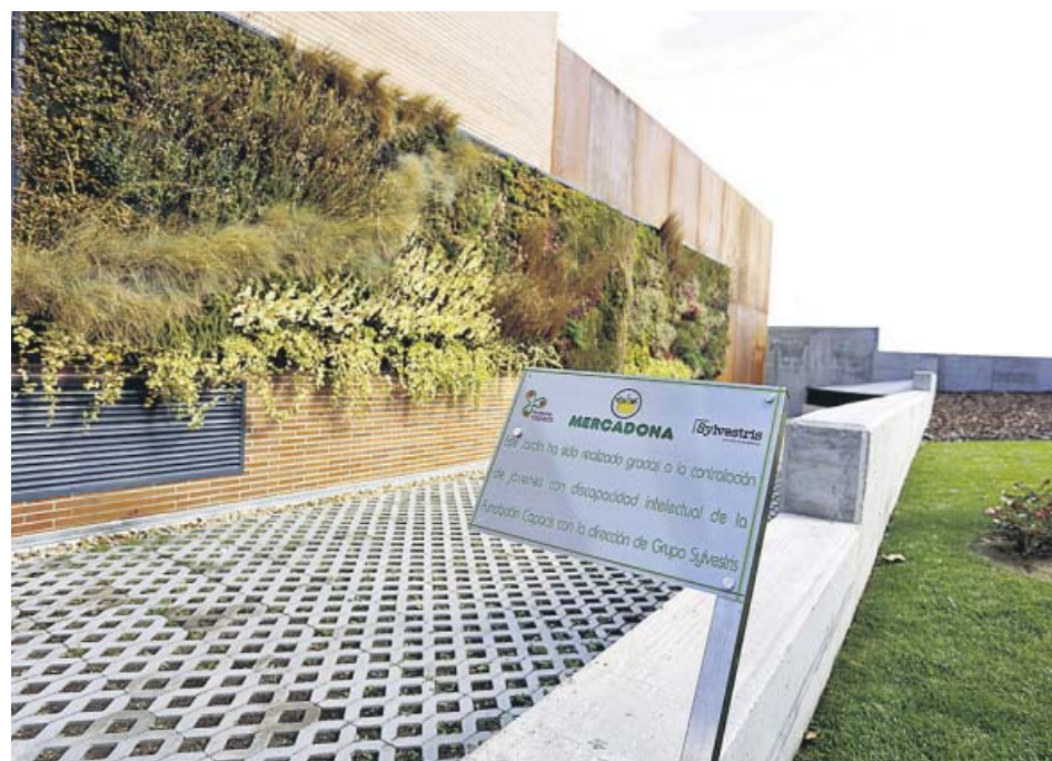
Jardín vertical en el supermercado de Mercadona situado en la calle Estocolmo de Madrid. MERCADONA

La Policía Nacional detuvo al grafitero que el pasado 3 de septiembre agredió con una navaja a un vigilante de Metro cuando trataba de retenerle tras haber realizado pintadas en los trenes de Cuatro Vientos.