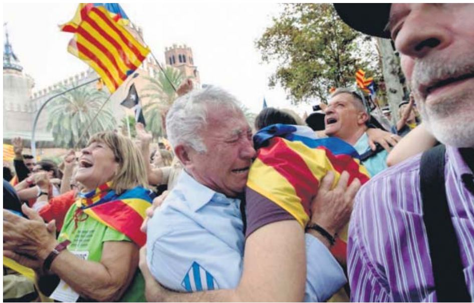
Concentración durante el pleno que en 2017 declaró fugazmente la independencia.

La sentencia cita varios textos de la ONU donde el derecho de autodeterminación está siempre vinculado a «la preexistencia de una situación colonial». Incide en que tanto la ONU como la UE excluyen de manera expresa el ejercicio de este derecho cuando «autoriza o fomenta acción alguna encaminada a quebrantar o menoscabar la integridad territorial o la unidad política de Estados soberanos». También desmonta un caso alegado por