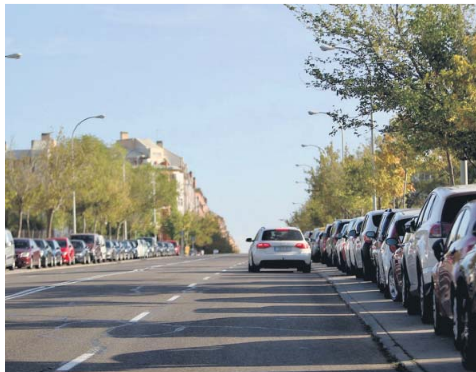
Un coche circula por la calle Sofía, ubicado en el barrio de Las Rosas. JORGE PARÍS

«El proyecto va a mejorar la entrada a la calle Estocolmo», reconoce este vecino. Sin embargo para él es insuficiente: «Estas medidas no vienen a resolver los grandes problemas que tenemos en el barrio», que son principalmente atascos y falta de espacio para aparcar por la llegada de los aficionados. «Deberían hacer salidas a la M-40 para evitar los atascos y habilitar una peatonal para pasar directamente al campo», propone. Las obras «son parches que no resuelven nada, pero nadie quiere afrontar los costes necesarios».