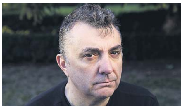
Arriba: Javier Cercas, ganador del Planeta 2019 por Terra Alta . Abajo: Manuel Vila, finalista y autor de Alegria .

En esta 68.ª edición de los Premios Planeta se premió además la obra Alegria de Manuel Vila, quien quiso ocultar también su nombre bajo el de Viveca Lindfords y el de su obra con el de Tal como éramos . Este escritor nacido en Barbastro (Huesca) se alzó como finalista —un reconocimiento dotado con 150.250 euros— gracias a una obra reflexiva protagonizada por un hombre de mediana edad, atormentado por sus propios demonios, como la depresión, el paso de los años y la muerte de sus seres queridos.