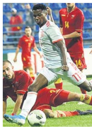
Ansu Fati, a punto de marcar ante Montenegro.

●●● La selección española no se pierde un gran torneo desde que se quedara fuera de la Eurocopa de 1992. Desde entonces son 14 participaciones consecutivas, siete en el torneo continental y siete en Mundiales. En la Euro de 2020 la Roja buscará su cuarto título europeo, algo que hasta ahora nadie ha conseguido. España y Francia son, con tres títulos, los que más veces han ganado el torneo continental. Ya están clasificados también Bélgica, Italia, Inglaterra, Polonia, Rusia y Ucrania.