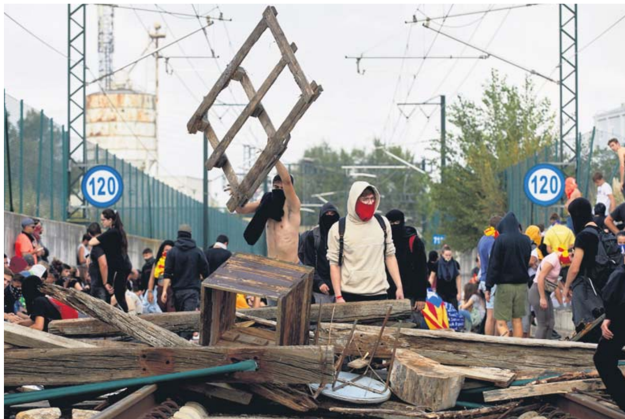
Manifestantes de Tsunami Democràtic cortan las vías del AVE a su paso por Girona como parte de sus protestas.

FERNANDO GRANDE-MARLASKA Ministro del Interior en funciones