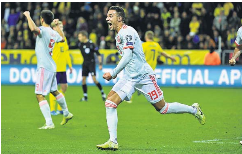
Rodrigo Moreno celebra eufórico su gol ante Suecia.

UN GOL DE RODRIGO en el descuento evitó la derrota y le dio a la selección la clasificación para la Eurocopa de 2020 OTRO MAL PARTIDO de los de Robert Moreno, que se salvaron de milagro