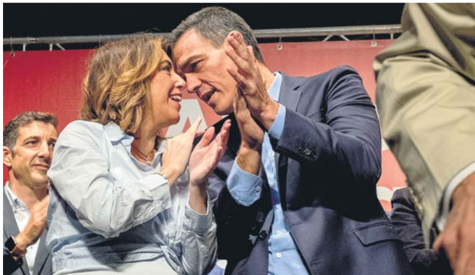
«No demos por hecho que vamos a ganar las elecciones». Sánchez llamó ayer a la movilización y alertó de la posibilidad de perder el 10-N en un acto de precampaña en Huelva.

Como el resto de países, España envió un plan presupuestario con el que la Comisión intenta evitar desviaciones en los ob-