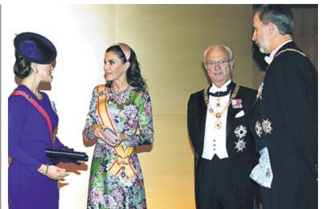
Los reyes asisten a la entronización de Naruhito

La Policía noruega detuvo ayer en Oslo a un hombre de 32 años que robó una ambulancia con una pistola y atropelló a varias personas. Entre los afectados no hay ningún herido grave, aunque una mujer y sus dos bebés de siete meses fueron ingresados en un hospital. La Policía encontró armas de fuego y cantidades «importantes» de droga en la ambulancia.