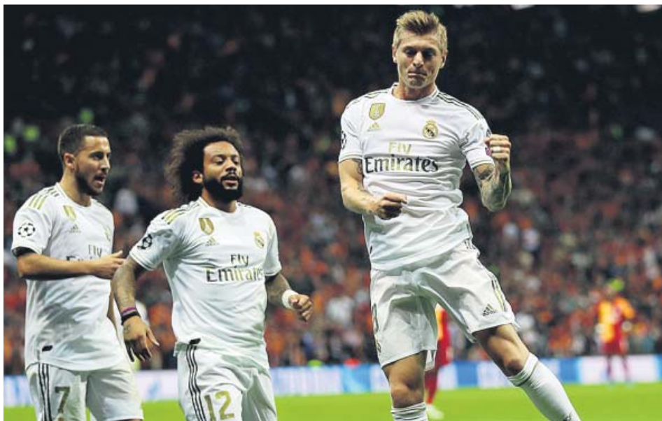
Toni Kroos celebra su gol ante el Galatasaray junto a Marcelo y Hazard.

EL REAL MADRID sumó su primer triunfo en la Champions tras ganar en Turquía ZIDANE LLEGÓ discutido y se fue reforzado tras un muy buen partido de los blancos