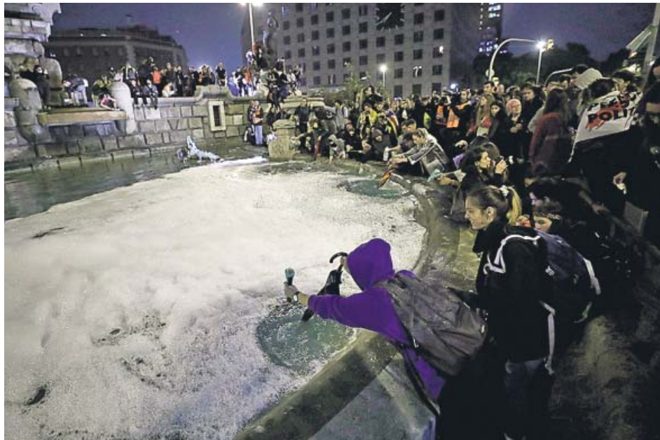
La fuente de la plaza de España de Barcelona, llena de espuma.

Tras Torra fue el presidente del Parlament, Roger Torrent,