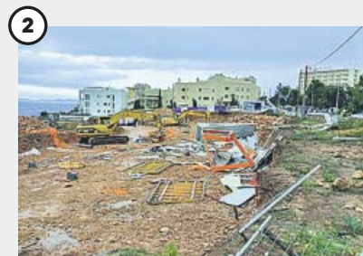
Un tornado en Sant Antoni

El litoral de la provincia de Castellón amaneció ayer en alerta por temporal de viento y lluvia. En la imagen, varias personas en una parada de transporte público en la capital de la provincia. No obstante, hoy la Comunidad Valenciana amanece sin ningún tipo de alerta por fenómenos meteorológicos adversos, que se desplazan hacia otras comunidades, según informó la Agencia de Meteorología.