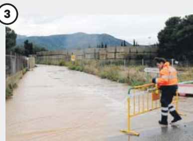
La DANA obligó a cerrar carreteras...

Tres personas resultaron heridas cuando un tornado en el municipio ibicenco de Sant Antoni (foto) levantó del suelo una caseta de obra con ellas dentro. Trabajaban en la obra de un hotel de Cala Gració.