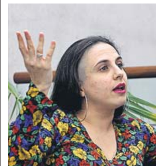
La escritora Cristina Morales.

Licenciada en Derecho y Ciencias Políticas, Morales es también autora, entre otros volúmenes, de Malas palabras (2015) y de Terroristas modernos (2017). El premio está dotado con 20.000 euros. ● R.C.