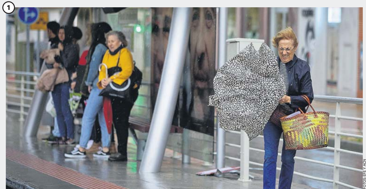
Castellón mantuvo la alerta hasta la noche, pero hoy la Comunidad Valenciana no registra avisos

El litoral de la provincia de Castellón amaneció ayer en alerta por temporal de viento y lluvia. En la imagen, varias personas en una parada de transporte público en la capital de la provincia. No obstante, hoy la Comunidad Valenciana amanece sin ningún tipo de alerta por fenómenos meteorológicos adversos, que se desplazan hacia otras comunidades, según informó la Agencia de Meteorología.