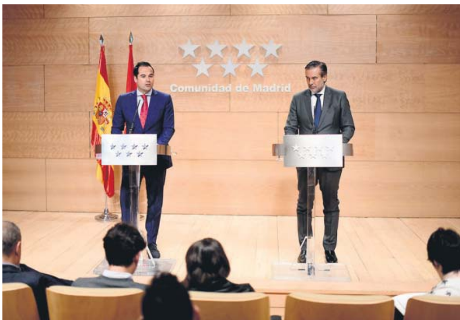
Ignacio Aguado y Enrique López, ayer, detallando los acuerdos del Consejo de Gobierno.

EL GOBIERNO PP-Cs ya trabaja en la redacción de la Ley de Defensor de los Denunciantes de Corrupción Política