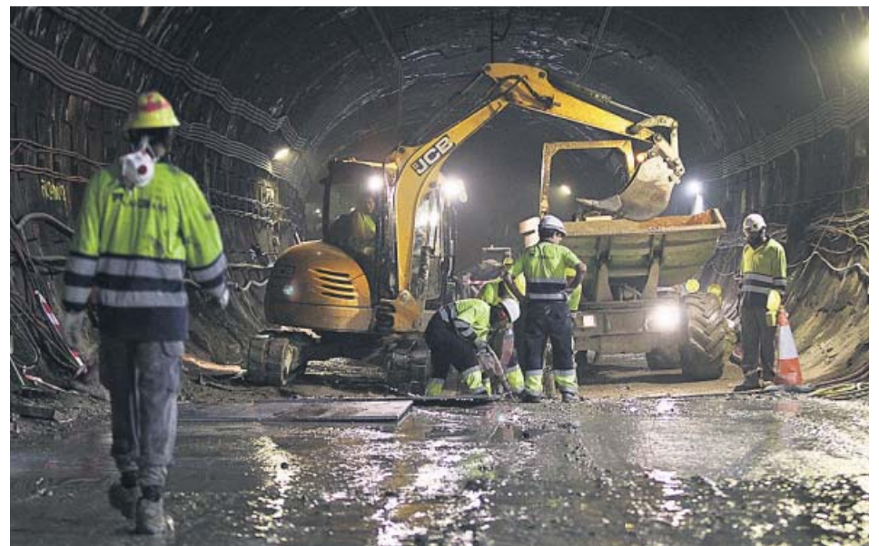
Operarios trabajando en las obras del túnel de Recoletos.