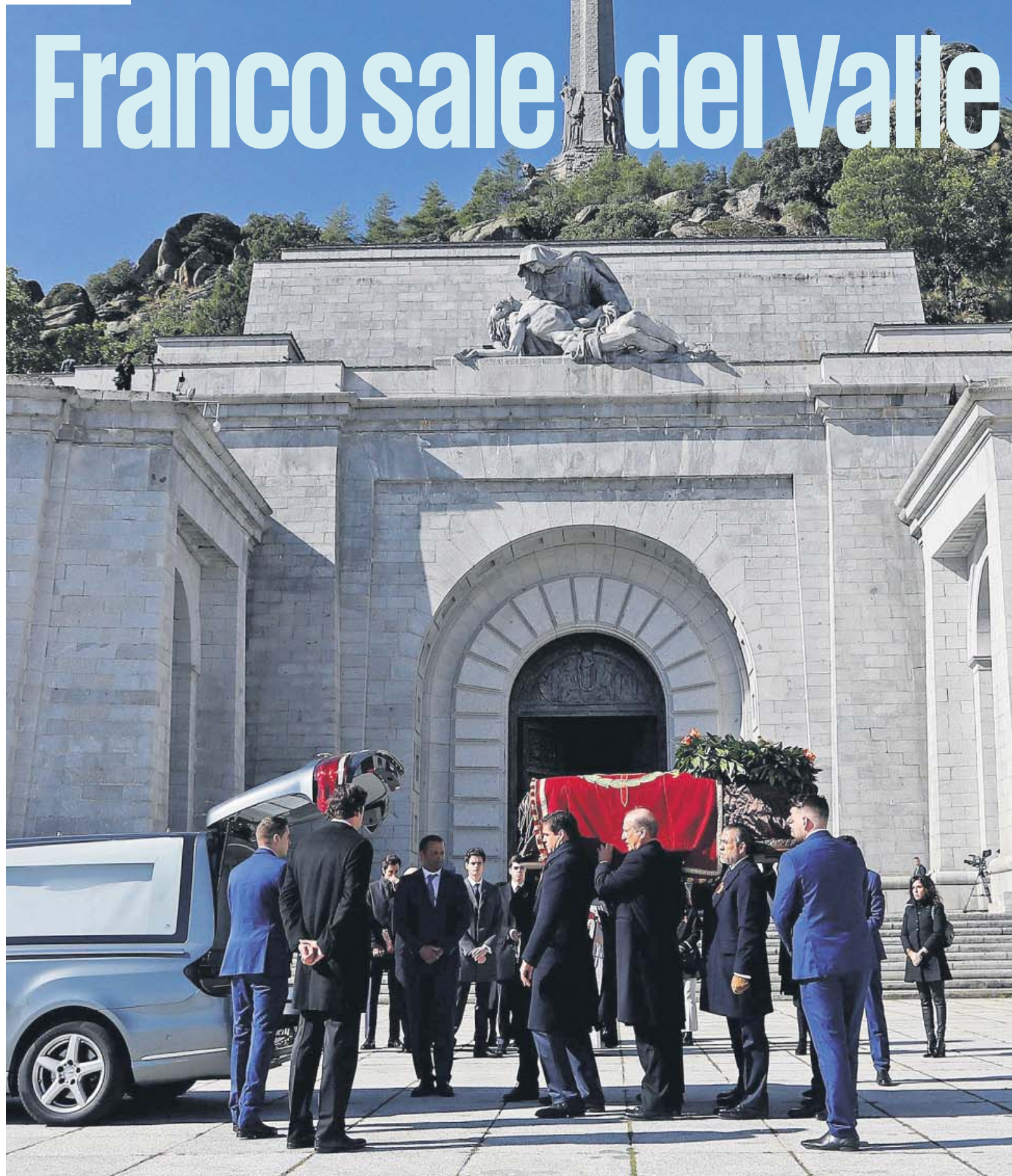
Los familiares del dictador sacan a hombros el féretro con sus restos de la Basilica de los Caídos.