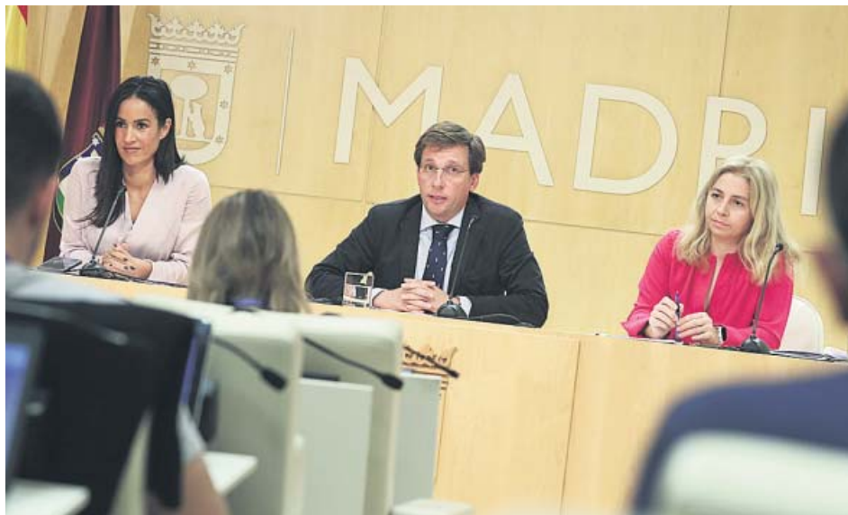
Martínez-Almeida (c), ayer junto a Begoña Villacís (i) y la portavoz, Inmaculada Sanz. MADRIDES

En concreto, el Gobierno municipal del PP y Cs aprobó rebajar el tipo del impuesto del 0,510% actual al 0,483%, lo que