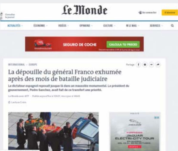
Vista de la versión digital del diario francés Le Monde .

«EXHUMACIÓN CONTROVERTIDA». En Estados Unidos, la CNN habla de «controversia» por la exhumación de los restos de Francisco Franco, mencionando que ha sido un asunto de gran división en España du-