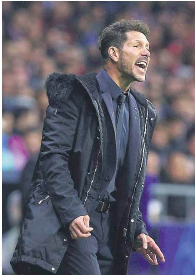
Zidane pasó varios días de rumores sobre su posible destitución si perdía. De Simeone se cuestiona su estilo de juego.