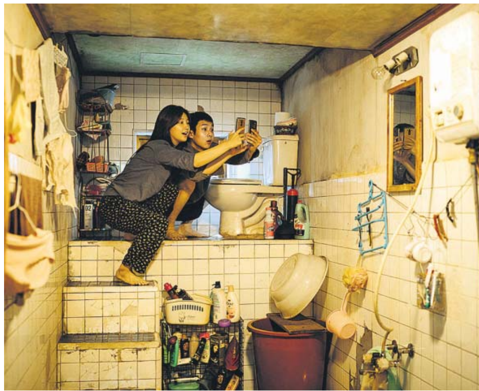
Park So-dam y Choi Woo-shik robando wifi desde su casa. LA AVENTURA AUDIOVISUAL

Es el patriarca de una familia pobre de Seúl, acostumbrada a malvivir en un piso bajo a base de microtrabajos temporales y precarios. Su suerte cambia cuando el hijo sustituye a un amigo como profesor