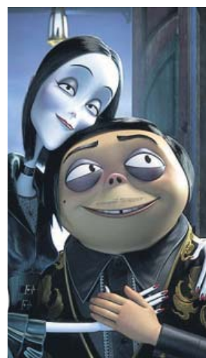
Los nuevos Morticia y Gómez.

Evocaciones aparte, la nueva versión de La familia Addams trata de acercar al clan y a su particular mundo al revés desde una perspectiva que recuerda al Tim Burton de Eduardo Manostijeras , gracias a esa urbanización retratada como un averno en tonos pastel. Y, aunque esa premisa tiene gracia, los directores Greg Tiernan y Conrad Vernon (que vuelven a territorios aptos para menores tras su excursión gamberra en La fiesta de las salchichas ) no parecen tener muy claro a qué territorios quieren conducir a Gómez, Morticia y su prole. Porque, si bien es cierto que su