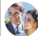
RAFA NADAL Sobre su boda el pasado sábado

«Disfrutamos mucho de ese día. Nos divertimos un montón con las personas que queríamos»