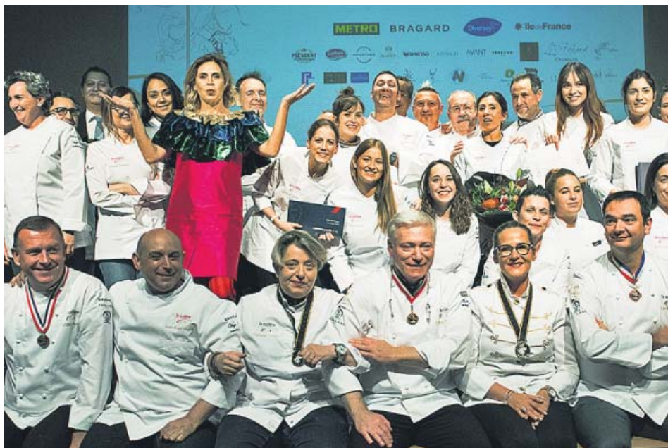
Foto de familia final tras la entrega de premios de La Cuillère d'Or en Madrid.

2010 impulsado por Marie Sauce Burreau, una francesa enamorada de la gastronomía, con el fin de proporcionar a las mujeres un escenario que les permitiera exponer su talento al mundo desde sus inicios.