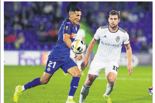
Un lance del encuentro de ayer en Getafe.