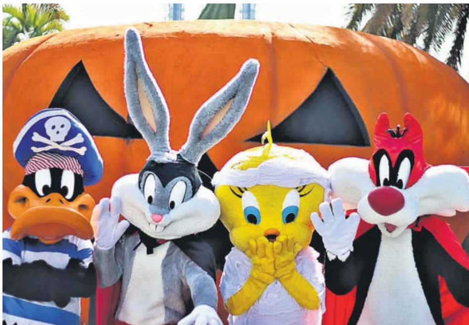
Los Looney Tunes también se disfrazan para celebrar Halloween. PARQUE WARNER