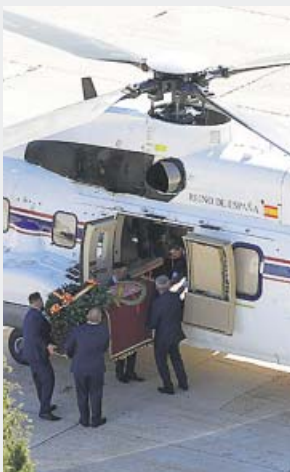
En la imagen, el helicóptero en el que se hizo el traslado.

El traslado del féretro con los restos tuvo momentos de tensión: se tambaleó mientras los