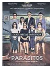
2019. Director Bong Joon-ho Reparto Song Kang-ho, Lee Seon-gyun, Jang Hye-jin

Ese primer acto, donde El sirviente (1963) de Losey y Teo-