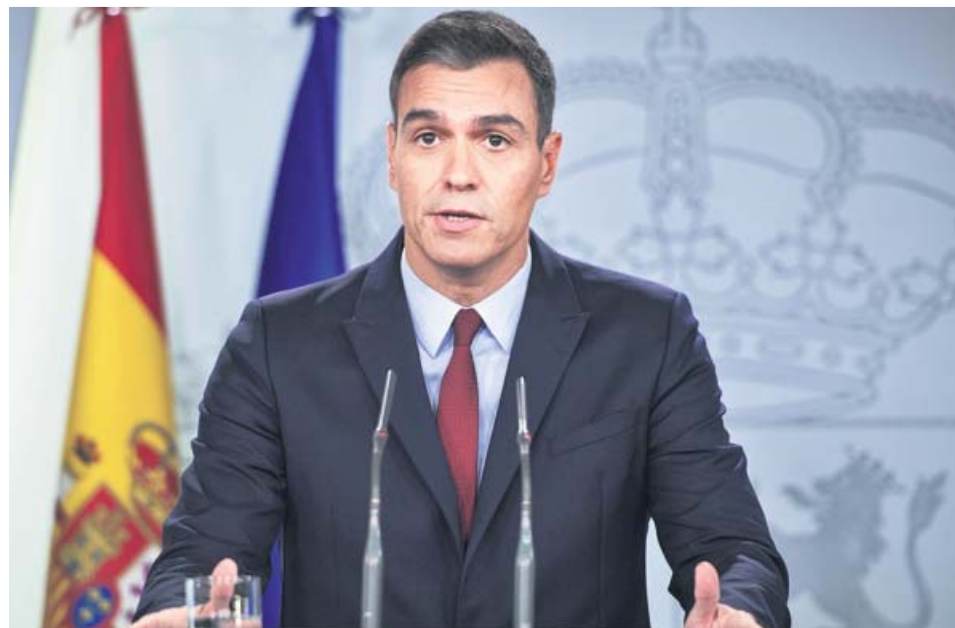
El presidente del Gobierno, Pedro Sánchez, durante la declaración institucional.

«Recuerdo esta frase de Juliá porque mi compromiso es «defender los intereses de su futuro, y comprometerme con la transición y con la concor-