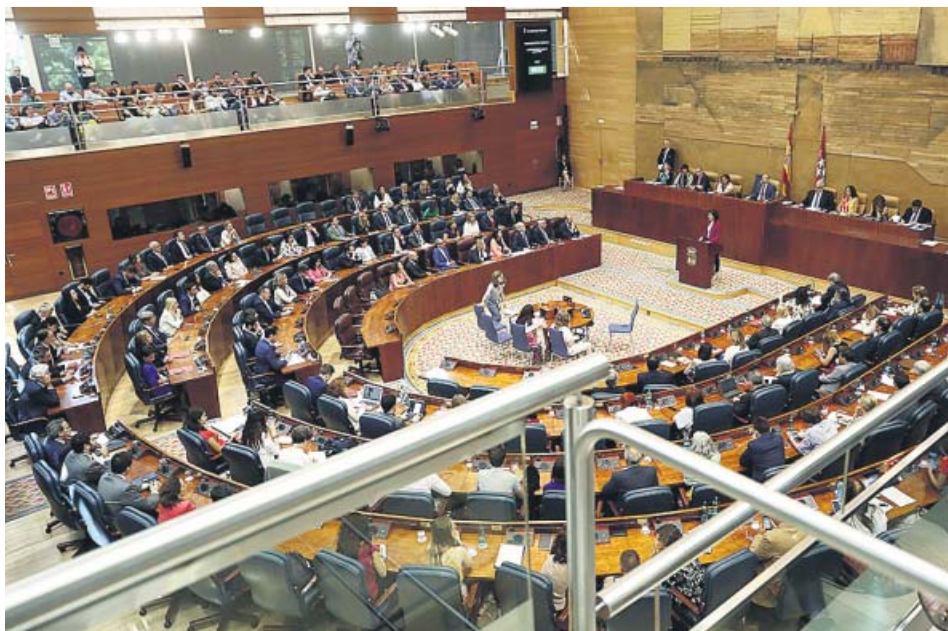
Hemiciclo de la Asamblea de Madrid durante un pleno.