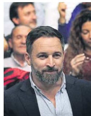
Santiago Abascal, ayer, en el acto de campaña de Vox.

«Ahora están todos contra Vox», recalcó Abascal en el acto de ayer ante unas siete mil personas en Valencia. Allí mostró su solidaridad con los valencianos que padecen, según dijo, «la quinta columna del separatismo catalán».