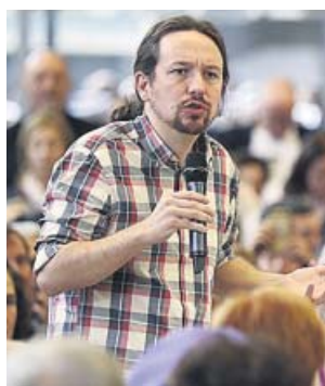
Pablo Iglesias, ayer, en su acto electoral en Bilbao.

En los últimos días, Iglesias ha redoblado sus ataques contra el PSOE y ha realizado actos en Valencia y Barcelona apelando a «muchas gente que votó socialista, que no va a aceptar que le cambien lo de 'con Rivera no' por 'con Casado sí'». Ayer fue el turno de