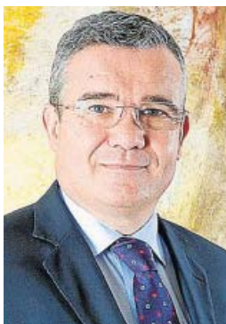
El alcalde de Arganda del Rey

Desde 2015 ostenta la Alcaldía por el grupo socialista. Ese mismo año fue elegido presidente de la Federación de Municipios Madrileños (FMM). Como alcalde de Arganda es responsable de la vicepresidencia de la Mancomunidad del Este.