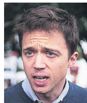
Íñigo Errejón, ayer, en el mitin que dio en Cádiz.

Además, Errejón cargó contra la indefinición de Sánchez a la hora de aclarar cuáles son sus planes para poder pactar tras las elecciones. «El PSOE tiene que dejar de hacer titu-