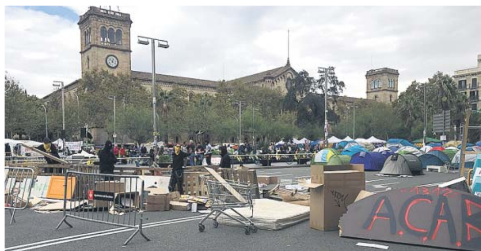
Los jóvenes acampados en la plaza Universitat de Barcelona reforzaron ayer las barricadas.