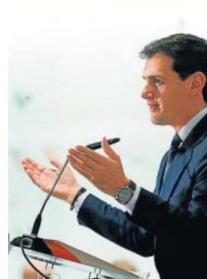
Rivera, ayer, en un acto de campaña de Ciudadanos.

Cs Albert Rivera quiere trasladar el mensaje de que, sean cuantos sean, los escaños de Ciudadanos serán decisivos tras las elecciones del domingo. El presidente naranja explicó ayer que lo importante es «para qué sirven» los diputados que se tengan. Se comprometió, en este sentido, a que el 11-N se «arremangará» para formar Gobierno, en este caso con el PP, o para «desbloquear España». Rivera hizo hincapié en un desayuno informativo en que lo que más le importa