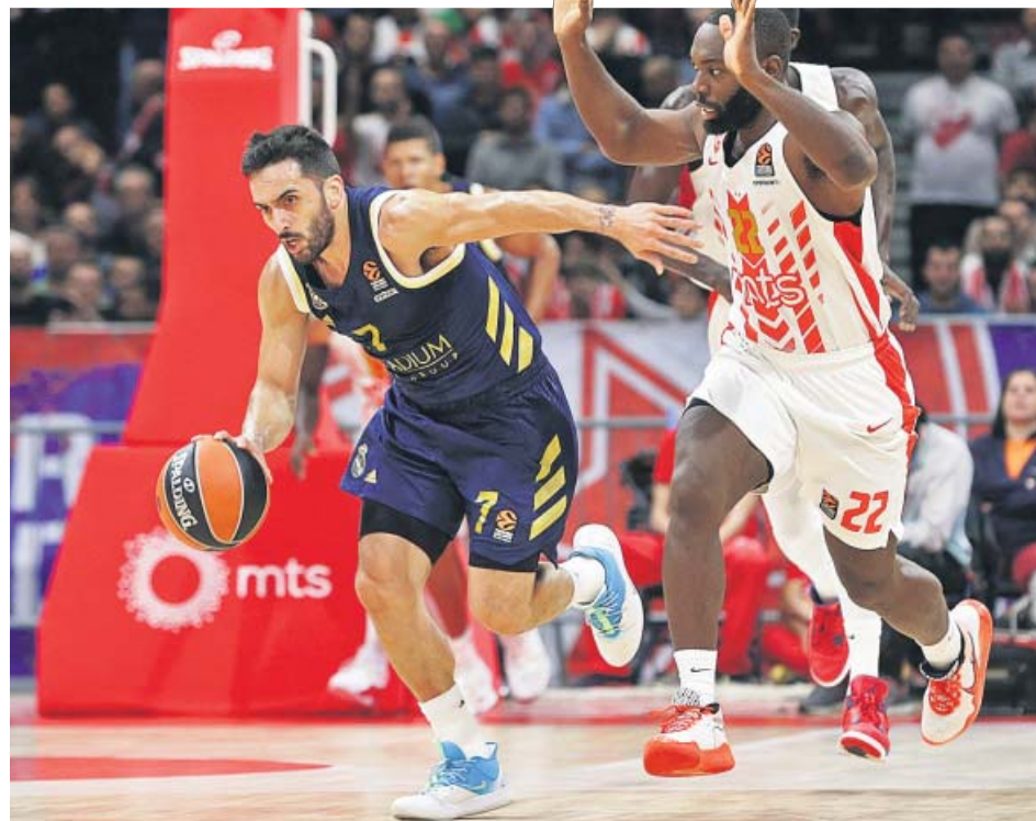
Facundo Campazzo perseguido por Charles Jenkins en Belgrado.

España, Reino Unido, Italia y Chile son los países que más entradas han comprado, hasta el momento, para las Finales de la Copa Davis que se disputarán en la Caja Mágica de Madrid, del 18 al 24 de noviembre, un evento que se podrá seguir en directo en algo más de 171 países.