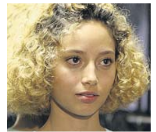
La actriz Ailín Salas, protagonista de 'Mariposa'.

En total, y hasta el 17 de noviembre, se habrán visto un total de 125 películas de 34 países, que se proyectarán en 28 pantallas repartidas en 23 sedes como Cineteca de Mata-