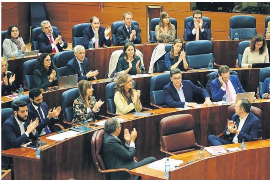
La bancada de Ciudadanos, durante un pleno de la Asamblea de Madrid.

LA REFORMA legal prohibirá el nombramiento a dedo de familiares de altos cargos como personal eventual IGNACIO AGUADO tacha de «obscena» la actuación de la alcaldesa de Móstoles