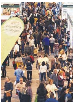
La pasada edición de la feria Biocultura en Ifema. ASOC. VIDA SANA

Aunar lo lúdico con la toma de conciencia y el espíritu informativo es el objetivo de sus actividades, entre las que destacan: showcooking