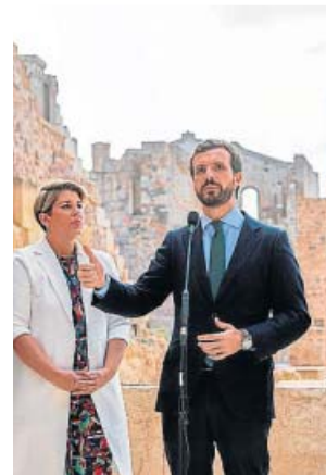
Pablo Casado, ayer, en su acto de campaña electoral en Cartagena (Murcia).

PP Pablo Casado afronta el final de la campaña centrándose en hablar de economía. Ayer, en Cartagena (Murcia), lo hizo elevando el tono contra Pedro Sánchez y acusándolo de negar la crisis para intentar «ganar dopado» el domingo, 10 de noviembre, y «adulterar las elecciones». Y subrayó con vehemencia: «La crisis está aquí. Hay una crisis como la copa de un pino». El candidato del PP lleva varios días poniendo el foco en la posible recesión económica que puede vivir España y ve a los socialistas sin reacción ante esta coyuntura.