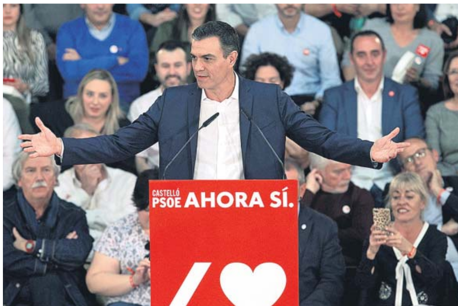
Pedro Sánchez ayer, en un mitin en Castellón.

Horas después, intentó explicarse con un tuit en el que cargó contra Puigdemont, en el que se centró el origen del embrollo porque lo que trataba de explicar Sánchez era cómo pensaba cumplir su promesa de traerlo de vuelta a España. Lo llamó «prófugo» y, con la vista más puesta en la posibilidad de que sus palabras entorpecieran su entrega a España, Sánchez deseó que sea juzgado «con todas sus garantías» e «imparcialidad». La Fiscalía, dijo, «cuenta con el respaldo del Gobierno en la defensa de la ley».