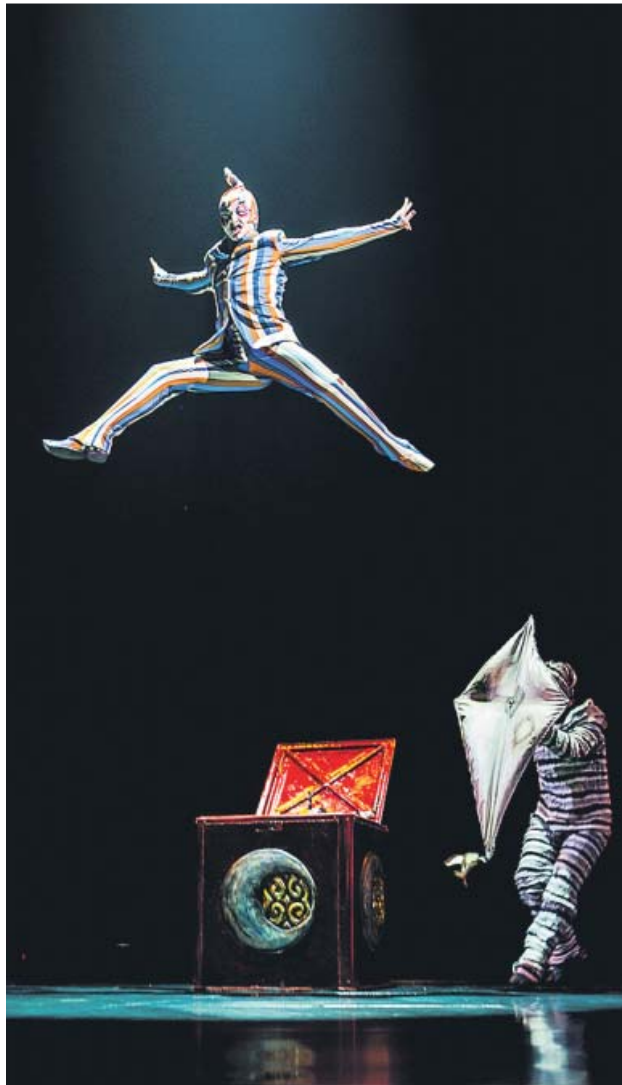
Uno de los momentos iniciales de 'Kooza'.

El nombre de Kooza se inspira en la palabra del sánscrito 'koza' que significa «caja», «cofre» o «tesoro», y se escogió por-