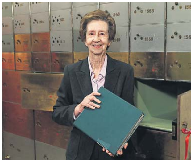
Margarita Salas, en una fotografía de archivo.

Licenciada en Ciencias Químicas y doctora en Bioquímica por la Universidad Complutense de Madrid, amplió sus estu-