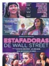
2019. Director Lorene Scafaria Reperto Jennifer Lopez, Constance Wu, Lili Reinhart

Jennifer Lopez, quien no echaba tantas chispas en una