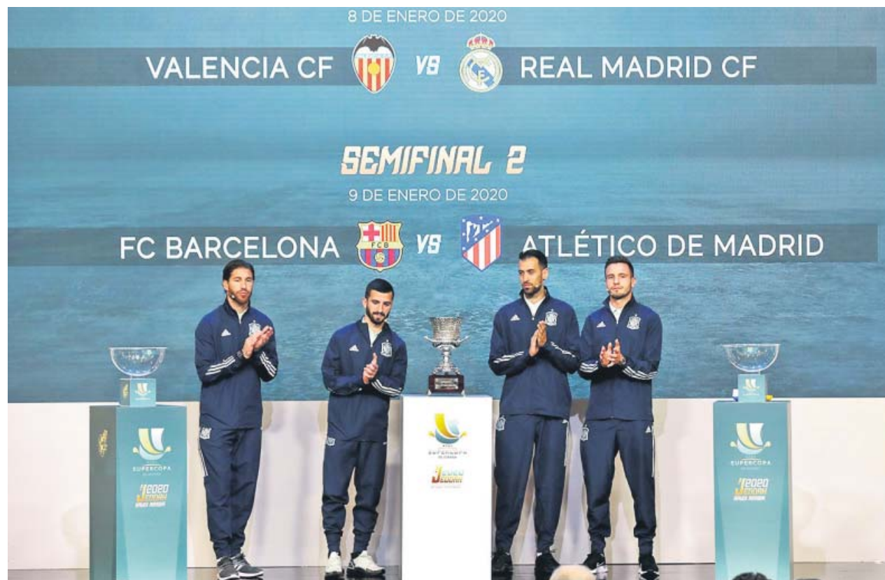
De izquierda a derecha: Sergio Ramos, José Luis Gayá, Sergio Busquets y Saúl Ñíguez tras el sorteo de la Supercopa de España de ayer en la Ciudad del Fútbol de Las Rozas.

«Hoy puedo asegurar que mujeres y hombres acudirán en igualdad. Casi todo el interés a nivel económico ha si-