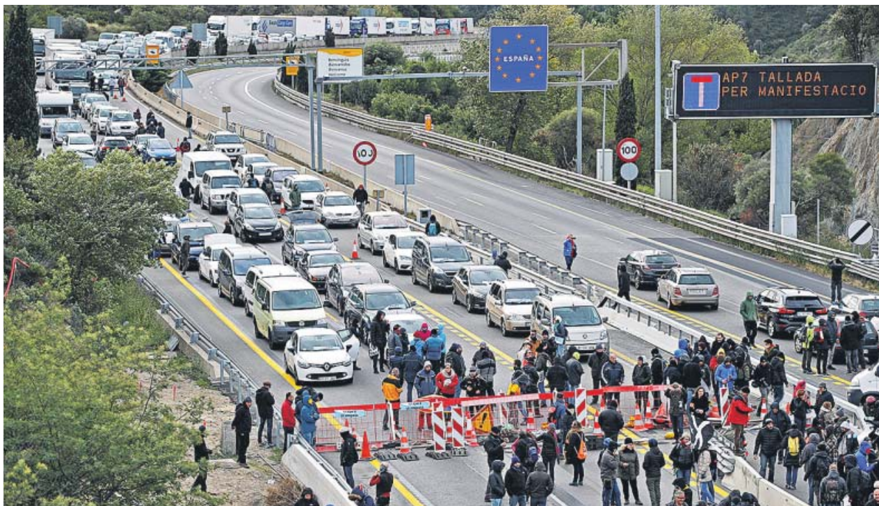
La autopista AP-7, cortada ayer en ambos sentidos, en la frontera de La Jonquera.

JACOBO ALCUTÉN jalcuten@20minutos.es / @jalcuten