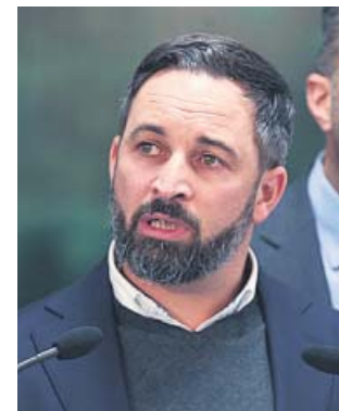
Santiago Abascal, ayer, en la rueda de prensa.

VOX El presidente de Vox, Santiago Abascal, advirtió ayer de que la gobernabilidad no es responsabilidad de su partido porque los españoles les han votado para que hagan oposición. «Votaremos en contra de cualquier Gobierno liderado o integrado por el PSOE. La responsabilidad de formar Gobierno es de los que han ganado y de aquellos que durante la campaña electoral dijeron que estaban dispuestos a desbloquear la situación», recalzó ante los medios autorizados a entrar en su sede.