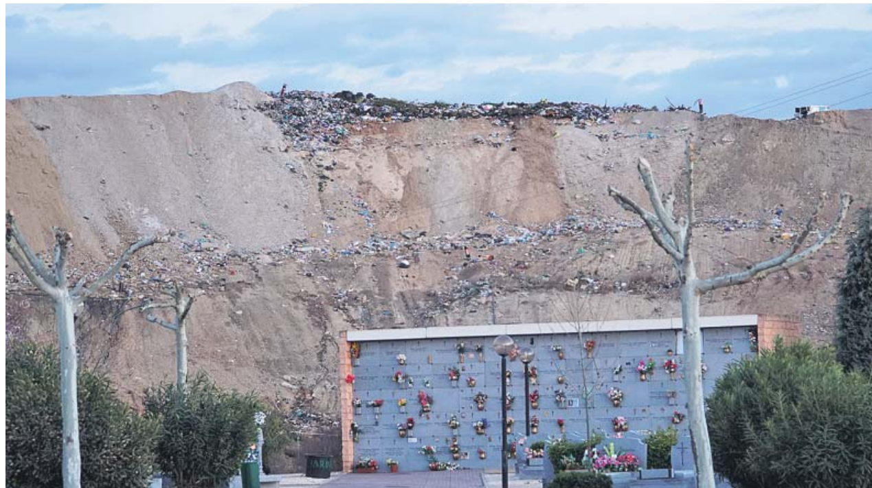
Vertedero de Alcalá visto desde el Cementerio Jardín. JULIO MUÑOZ.

Siete años más tarde, en 2013, se comenzó a verter en el quinto vaso del basurero, «por lo que sabían con antelación una estimación aproximada de cuándo iba a terminar la vida útil del vertedero. Es decir, debían haber empezado a planificar hace 6 años», añaden desde el área regional.