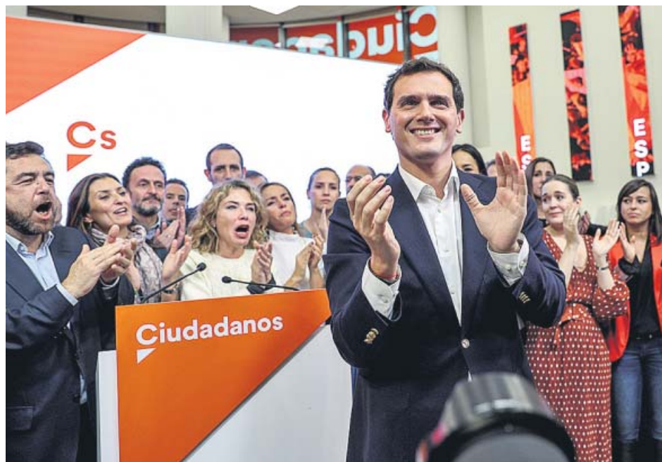
Rivera, ovacionado por miembros de Ciudadanos tras anunciar su dimisión ayer.

Inés Arrimadas, la que fue sucesora de Rivera al frente de Cs en Cataluña cuando este dio el salto a Madrid, encabeza todas las apuestas para tomar ahora el relevo al frente de la presidencia nacional, aunque otros candidatos podrían tratar de disputarle el puesto. Entre las posibles alternativas a Arrimadas desta-