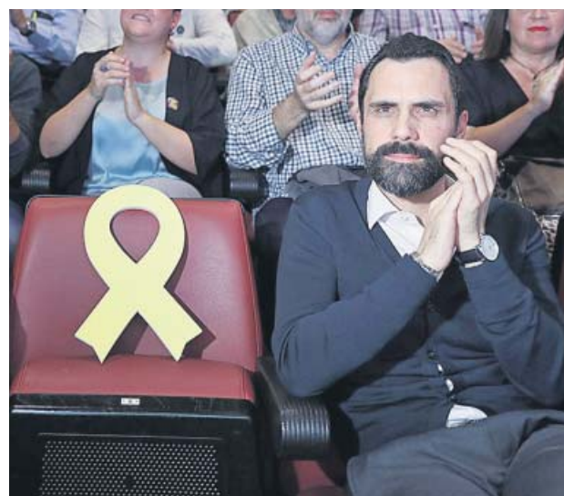
Roger Torrent, en un mitin de ERC el pasado jueves.

Según la agenda del pleno, con esta modificación, la votación de la polémica moción de la CUP tendrá lugar antes de la pausa del mediodía, momento en el que es poco pro-