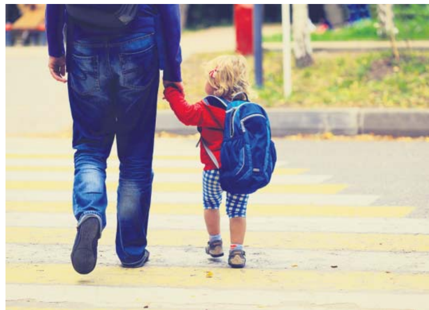
El conflicto entre trabajo y familia que sienten los padres es mayor que el de las madres.

Además, el abogado solicitó al Tribunal Superior de Justicia de Andalucía (TSJA) la impugnación del recurso presentado por la defensa de Ana Julia Quezada, que pedía la nulidad y repetición del juicio sin jurado popular y a cargo de un tribunal profesional. ●