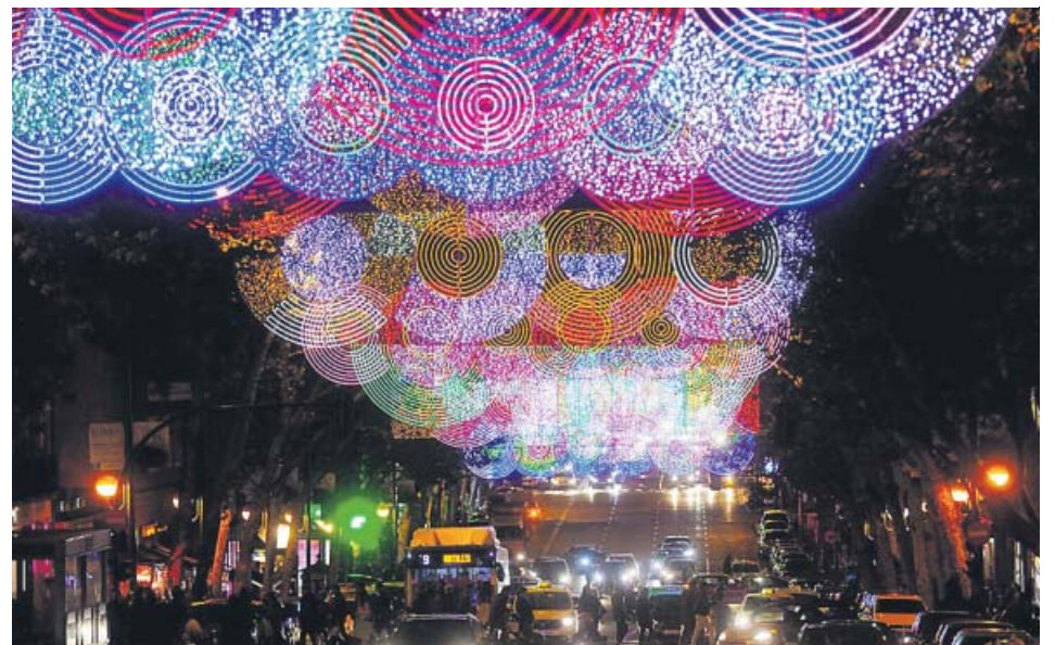
El alumbrado navideño llegará a más zonas de la capital este año.

mento del gasto de un 27,7% respecto al año anterior. «El proyecto responde a la demanda de los ciudadanos y contribuirá