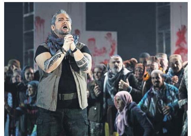
El tenor Gregory Kunde en el papel de Samson.

La joven artista Billie Eilish, fenómeno musical de este 2019, ha anunciado en sus redes sociales el lanzamiento global el 13 de noviembre (1 de la madrugada del 14 de noviembre en España) de un nuevo tema titulado Everything I Wanted .