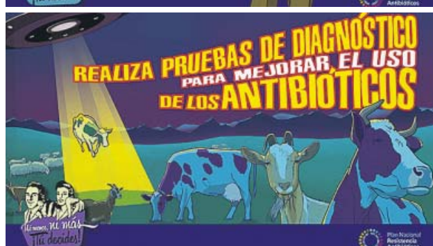
Imágenes de la campaña sobre el uso adecuado de los antibióticos dirigida a médicos y veterinarios. MINISTERIO DE SANIDAD