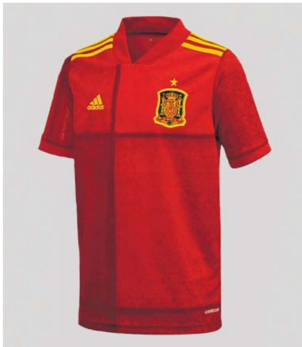
La nueva camiseta de la selección española.

El pasado 21 de mayo la RFEF anunció que iniciaba «un plazo de negociaciones para cerrar un nuevo proveedor técnico de ropa deportiva» al considerar que el contrato con Adidas era insuficiente. Finalmente ambas partes han llegado a un acuerdo y han ampliado el anterior contrato, que finalizaba en 2026, hasta 2030.