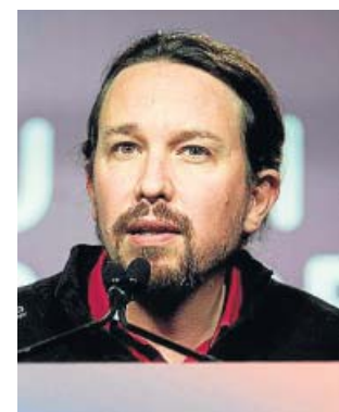
El líder de Unidas Podemos, Pablo Iglesias, el domingo.

El líder morado, Pablo Iglesias, reunió ayer a la ejecutiva de Podemos para analizar los resultados electorales. No obstante, ni Iglesias ni ningún otro dirigente morado ofreció declaraciones tras este encuentro: lo último que dijo el secretario general de Podemos, en la noche del domingo, es que una coalición es una «necesidad histórica» para frenar el auge de Vox. Fuentes del partido explican que Unidas Podemos se