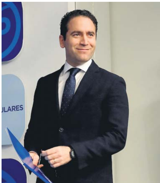
El secretario general del PP, Teodoro García Egea.

«Si el PSOE quiere la abstención del PP, no se lo he oído, pero no se la vamos a dar porque no nos fiáramos de él», aseguró García Egea en una entrevista en Onda Cero , en la que calificó el objetivo de evitar que gobierne Sánchez de «labor patriótica». «En este momento es