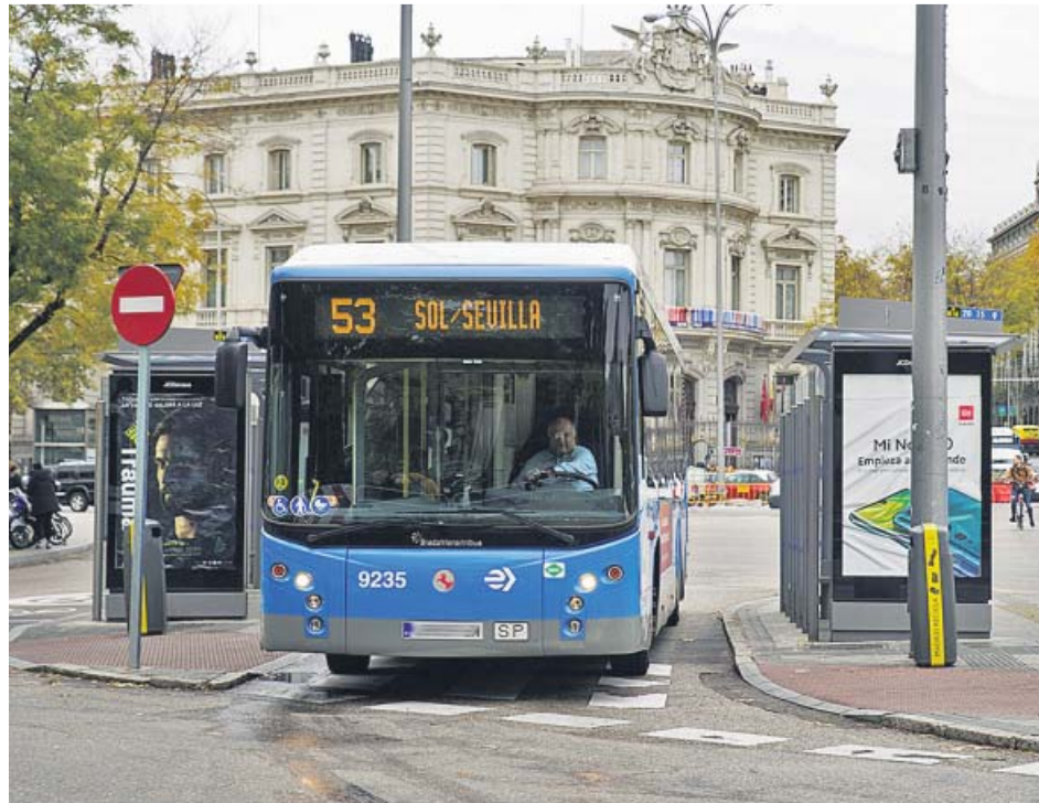
Un autobús de la EMT transita por la Plaza de Cibeles.

Después de los paros parciales de dos horas por turno pro-