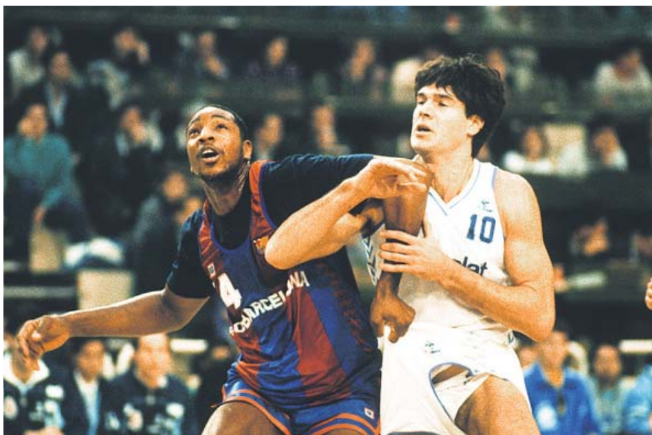
Fernando Martín y Audie Norris, un duelo de leyenda.