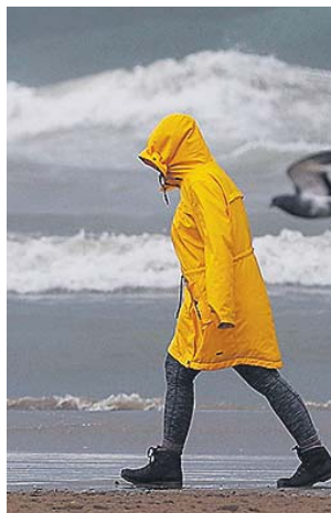
Una mujer en la playa de la Malvarrosa (Valencia), ayer.

Valencia, Alicante, Almería y Murcia serán las provincias más afectadas hoy por el temporal