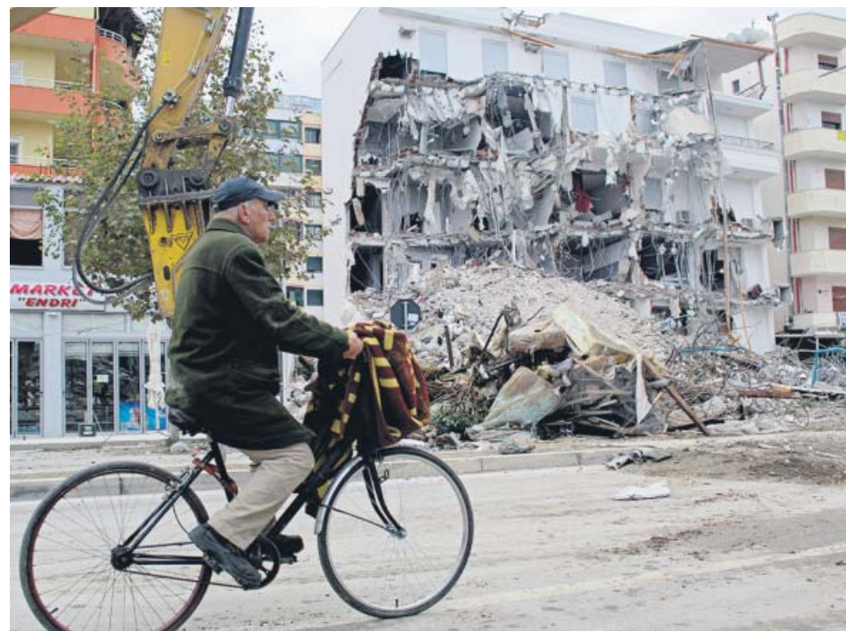
Un ciclista recorriendo una calle en Durres (Albania) donde permanecen los escombros.

Algunas familias celebraron funerales para seis o incluso ocho miembros de cada una y, en muchos casos, la población se negó a volver a sus casas por miedo a que se produzcan más réplicas. Los escombros todavía pueden observarse en las calles, como se muestra en la foto. ●