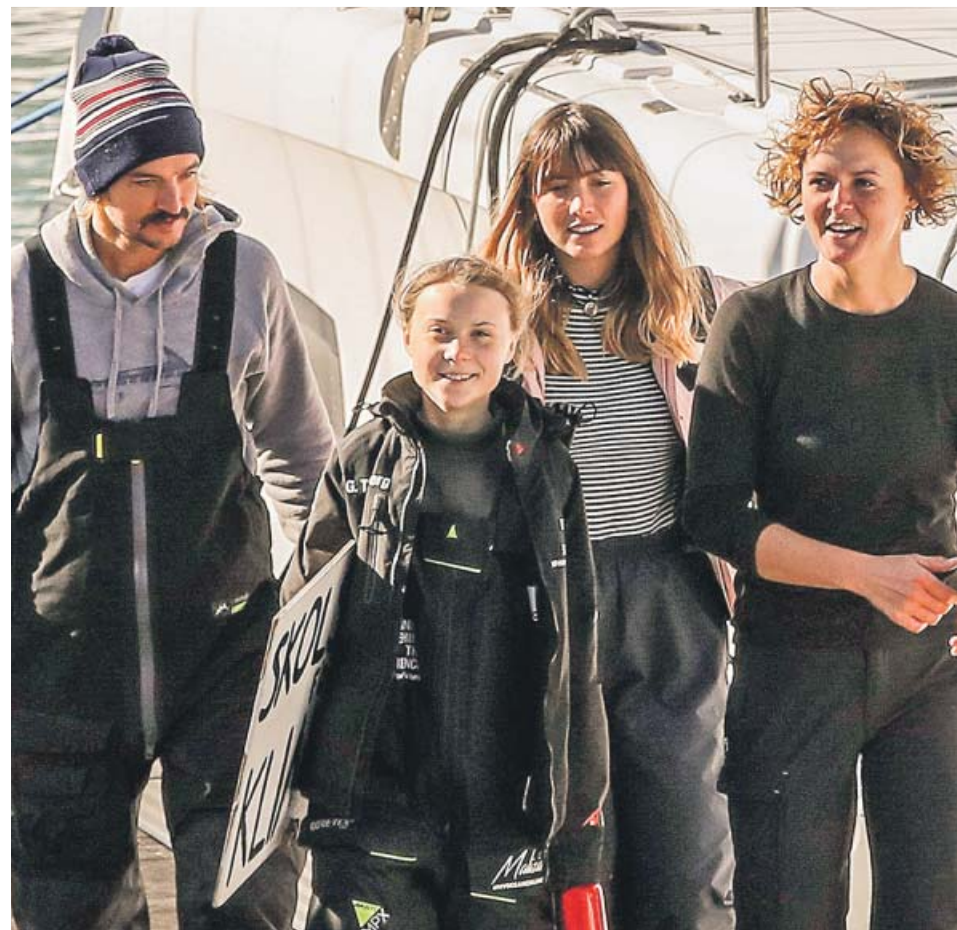
Greta Thunberg, a su llegada al puerto Santo Amaro de Lisboa.

Después de participar en la Cumbre del Clima de Madrid, la joven tiene pensado regresar a su Suecia natal para pasar la Navidad en casa con su familia. ●