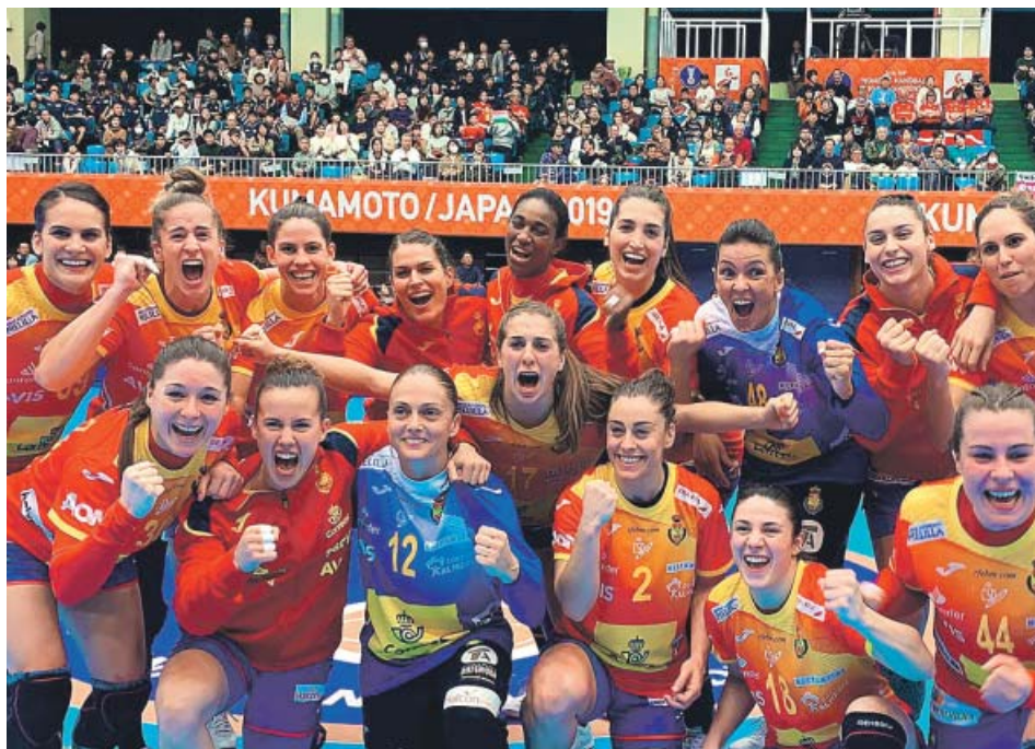
Las jugadoras españolas celebran su victoria.

La selección española femenina de balonmano prolongó su pleno de victorias en el Mundial de Japón, tras imponerse ayer por 29-20 a Senegal, en un encuentro en el que el equipo español sufrió más de lo previsto en la primera parte, como reflejó el ajustado 14-13 con el que se llegó al descanso. Tras él, el juego español y, especialmente, su defensa, mejoró y el marcador se abrió hasta el resultado final. ●