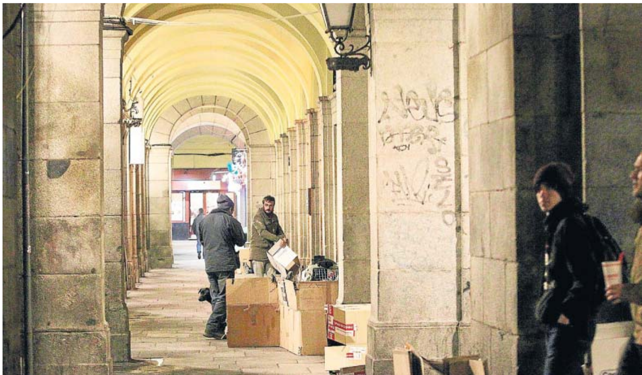
Varias personas sin hogar habitan en los soportales de la Plaza Mayor de Madrid. JORGE PARÍS

PRESUPUESTO Se destinarán más de 4 millones de euros en 2020, un 11,5% más que en 2019.