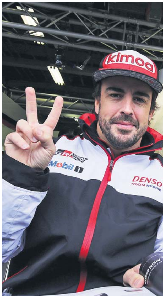
Alonso, durante una carrera con Toyota.

La magnitud del hito que ha logrado Alonso en el 2019 que firma sus últimas páginas no se podrá medir hasta que pasen los años y la historia asiente las arenas de los números. Ser un campeón del mundo de cualquier deporte es algo que sueña todo competidor; serlo de dos es algo que sólo está al alcance de unos pocos. Alonso