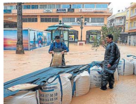
Las calles de Los Alcázares (Murcia) ayer, tras las precipitaciones que provocaron inundaciones, cortes en las carreteras y el cierre de escuelas y mercados.

nes del Mar Menor y del litoral de la Comunidad Valenciana, con precipitaciones que superaron los 100 litros por metro cuadrado.