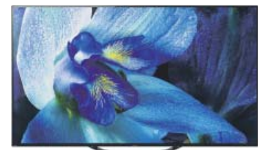
Imagen sin límites. Televisor OLED 55" Sony KD-55AG8 Ultra HD 4K con sistema operativo Android 8.0 Oreo y Acoustic Surface Audio

Elegancia y resolución. Smartphone Samsung Galaxy A70 con pantalla Full HD+ de 6,7", 6 GB de RAM y 128 GB de memoria interna