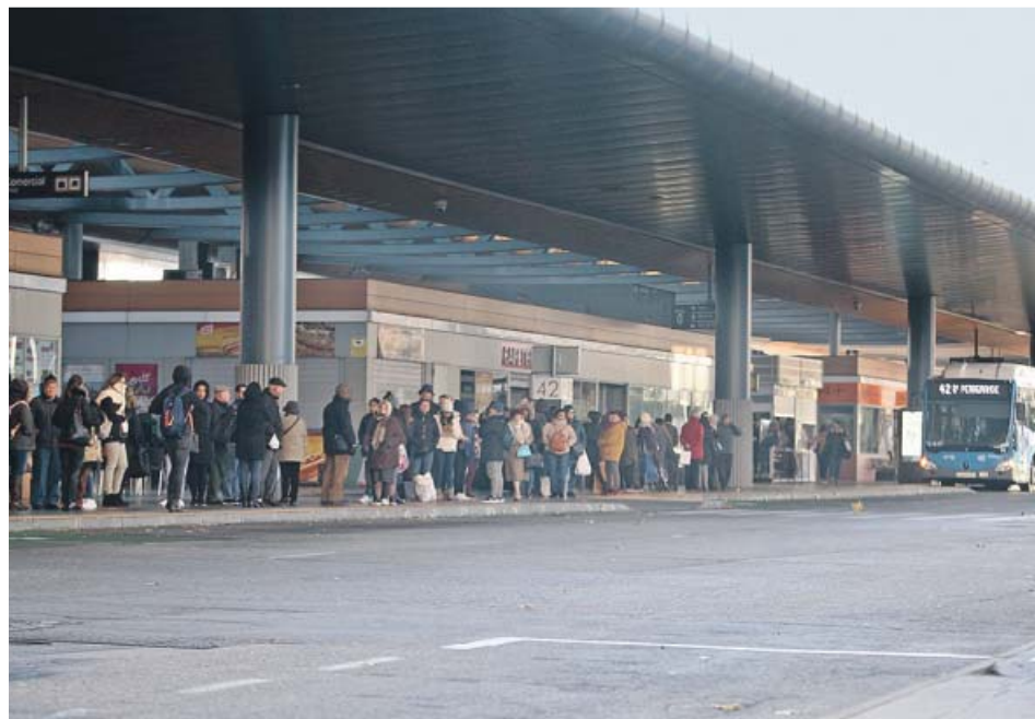
Una larga fila de viajeros esperando el autobús, ayer, en Plaza de Castilla. JORGE PARÍS

Multifacético. Portátil HP Pavilion 14-ce3003ns con diseño ultradelgado, pantalla de 14", 8 GB de RAM y 512 GB de memoria interna