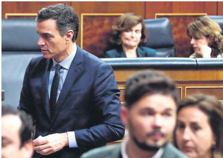
Pedro Sánchez y Gabriel Rufián, ayer en el hemiciclo del Congreso.