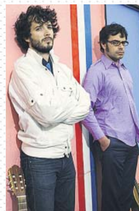
Los protagonistas de Los Conchords . HBO

Para un aficionado a la música pop, Los Conchords