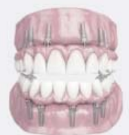
Implantes y dientes fijos en unas horas.