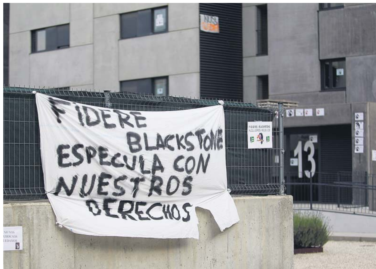
Pancarta contra los fondos buitres en una comunidad de vecinos de Madrid.

LOS PARTIDOS están divididos en torno a la regulación del mercado del alquiler para evitar subidas