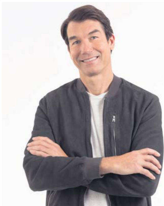
El actor Jerry O'Connell como Carter.