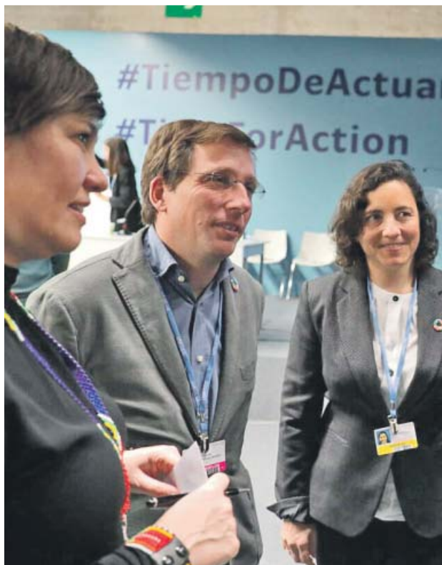
Martínez-Almeida, ayer, con alcaldes de la C-40.

Almeida aprovechó el encuentro para exponer ante sus homólogos su plan Madrid 360, con el que «tendremos una importante área de la ciudad libre de vehículos, mejorarán los espacios públicos como parques o calles, mejorará la red de transporte público y también las infraestructuras para el uso de la bicicleta», según apuntó el alcalde. Ade-