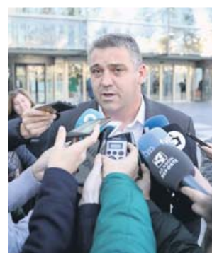
Ballesteros, ex del Levante, ayer en los juzgados.

El juez apunta que no puede darse por probado que el destino de ese dinero fueran los jugadores del Levante. De esta forma, los deportistas, entre los que se encuentran algu-