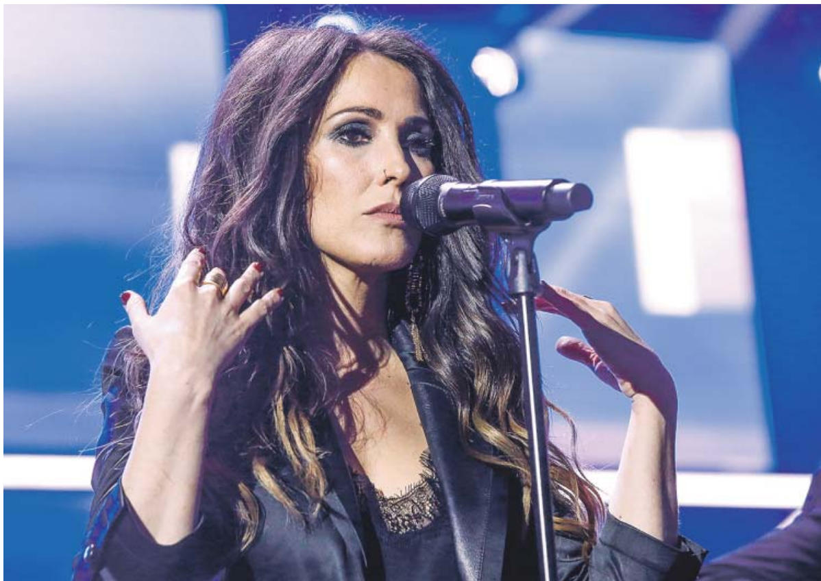
La cantante Malú, durante una actuación en Operación Triunfo 2018 en Barcelona.