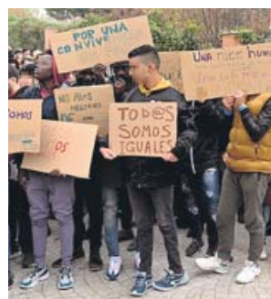
Concentración «a favor de la convivencia» en Hortaleza.

Tras el ataque con una granada al centro de primera acogida de menores de Hortaleza el jueves, cientos de vecinos se manifestaron el domingo a las puertas del mismo reclamando que haya «convivencia».