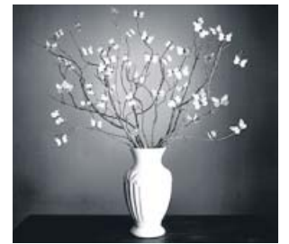
Una de las obras de la exposición. CHEMA MADDOZ / VEGAP

Además de las instantáneas, que no van tituladas, se podrán