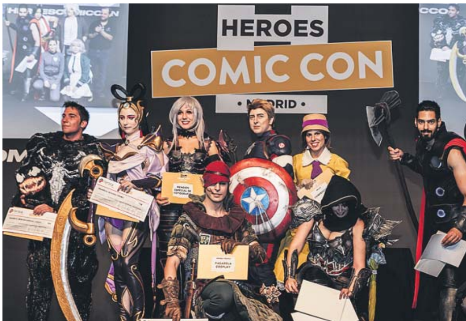
Cosplayers en la última edición de la Heroes Comic Con Madrid.