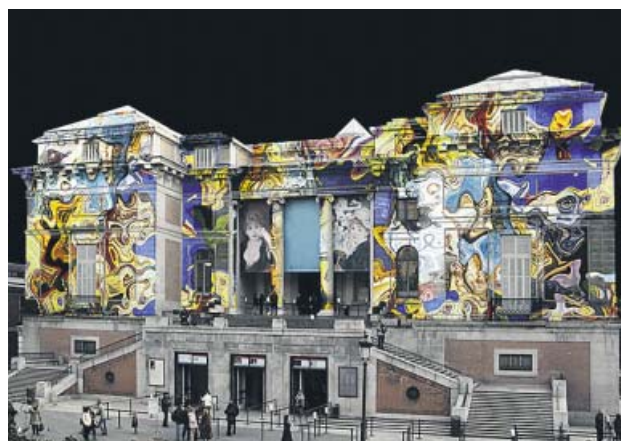
Espectáculo Amalgama El Prado . DANIEL CANOGAR / MUSEO DEL PRADO

Hasta el domingo 15. Museo del Prado. Ruiz de Alarcón 23. Puertas abiertas: entrada gratuita los días 13, 14 y 15. De L a S, de 10 h a 20 h; D y festivos, de 10 h a 19 h.