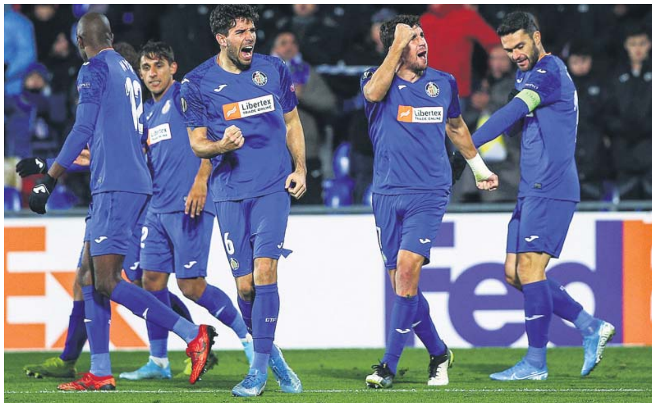
Los jugadores del Getafe celebran uno de los goles ayer ante el Krasnodar.

Pleno español también en la Europa League, como había sucedido el día anterior en la Champions. El Getafe, el equipo que faltaba por sellar su billete para los dieciseisavos, no falló y goleó al Krasnodar (3-0) en un partido más disputado de lo que indica el resultado y en el que los tres goles llegaron en la segunda parte: Cabrera en el minuto 76, Jorge Molina en el 78 y Kenedy en el 86. Sevilla y Espanyol ya estaban clasificados. Los hispalenses cosecharon su primera derrota ante el Apoel (1-0), mientras que el Espanyol cayó ante el CSKA (0-1). ● R. D.