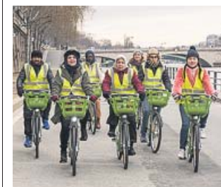
Los protagonistas de la película.

Isabelle supone la otra cara de la misma moneda del buenrollismo frente a la vida de Sally Hawkins en Happy, un cuento sobre la felicidad . Aquí Agnès Jaoui encuentra