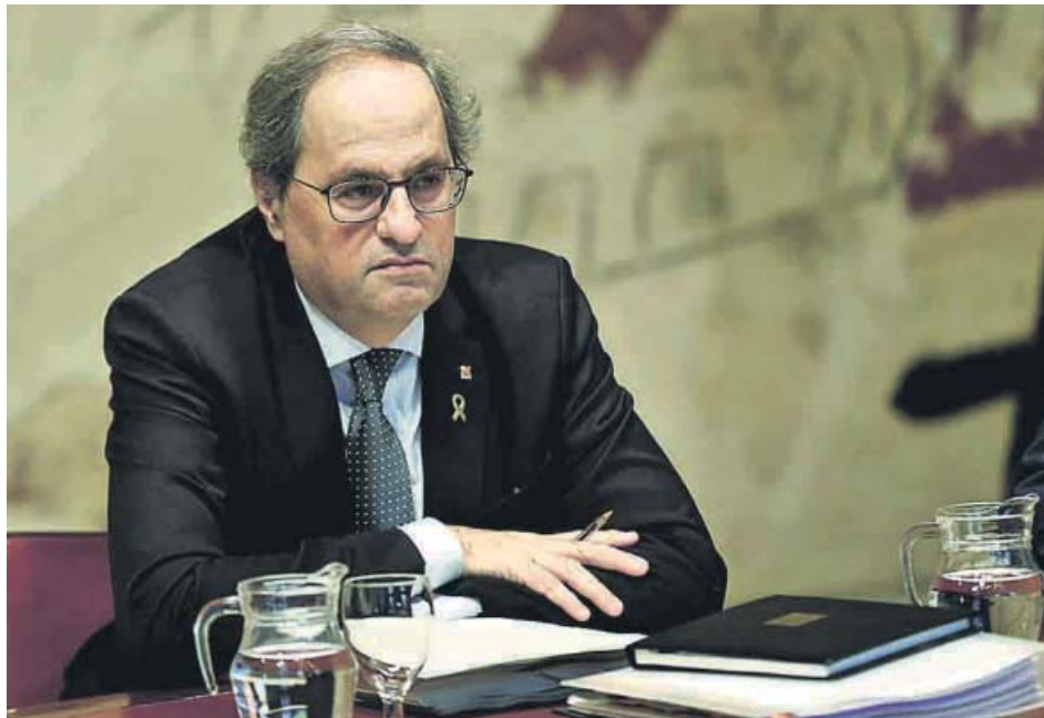
El president de la Generalitat, Quim Torra.

Al propio Torra tampoco le convence este movimiento, pese a que últimamente ha tratado de contactar en varias ocasiones con Sánchez sin éxito, tachó en octubre de «increíble» que Sánchez no quisiera cogerle el teléfono e incluso publicó un vídeo en el que reaccionaba con un airado «qué cojones» a una de las llamadas infructuosas. Fuentes de la Generalitat afirmaron ayer que incluir a Torra en una lista de llamadas a los presidentes autonómicos no es la vía para «encarar el conflicto» catalán «con valentía y cora-