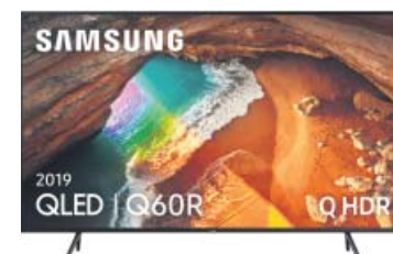
Imagen a todo color. Televisor QLED 55" Samsung 55Q60R, 4K UHD con tecnología Quantum dot para reproducir el 100% de volumen de color con independencia del brillo.

Versátil y funcional. Móvil Xiaomi Redmi Note 8T con pantalla de 6.3" y Full HD+, 4 GB RAM, 64 GB de memoria interna y 4000 mAh.