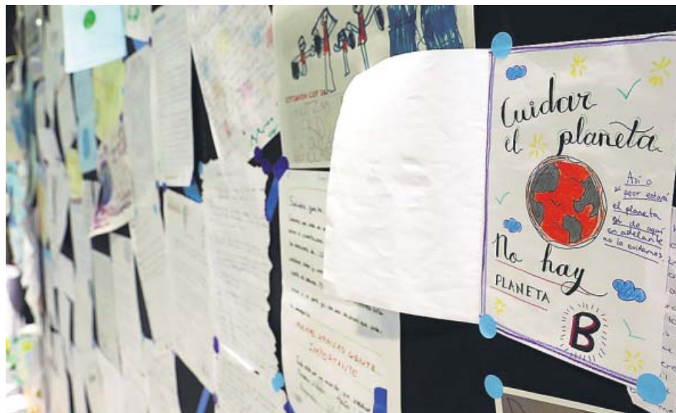
Cartas de niños dirigidas a los líderes de la COP25.

LOS ACTIVISTAS hablan de «fracaso» y de oportunidad perdida