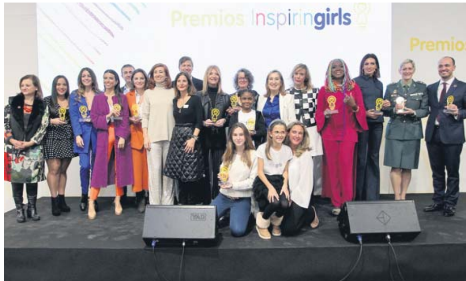
Foto de familia de los galardonados en los Premios Inspiring Girls 2019.