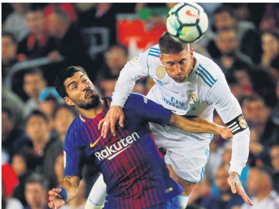
Pugna entre Luis Suárez y Sergio Ramos en el último Clásico en el Camp Nou.