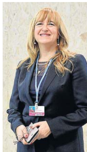
Economista experta en desarrollo del Banco Mundial, dirige el Centro para la Integración en el Mediterráneo.

¿Reducirá la pobreza? En el norte de África luchar contra el cambio climático significaría la creación de muchos puestos de trabajo. Habrá otros sectores donde se pierdan, por eso son esenciales medidas compensatorias. La UE ha desarrollado las suyas para sus países, igual tiene que ocurrir a en el sur. Los países más avanzados tienen que ayudar a los menos. No es caridad, sino transferencia tecnológica, apertura de mercados e intercambiar ideas para que organi-