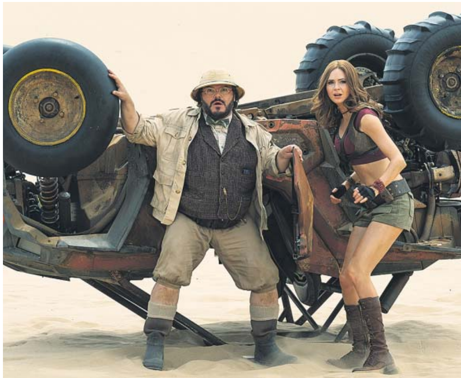
Jack Black y Karen Gillan vuelven al videojuego más salvaje del cine.

En este Siguiente nivel se repite la historia... lo que tal vez no ha sido la mejor de las decisiones. En vez de innovar, amplifica todo lo que funcionó en la anterior entrega. ¿Que congeniaba la 'cuchipandi' interracial? Pues añadimos un nuevo miembro oriental (Awkwafi-