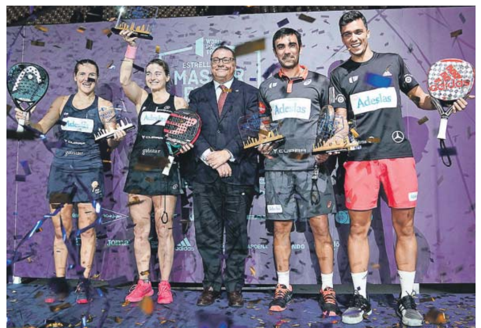
Ari Sánchez y Alejandra Salazar (izq.) y Pablo Lima y Alejandro Galán (dcha.).