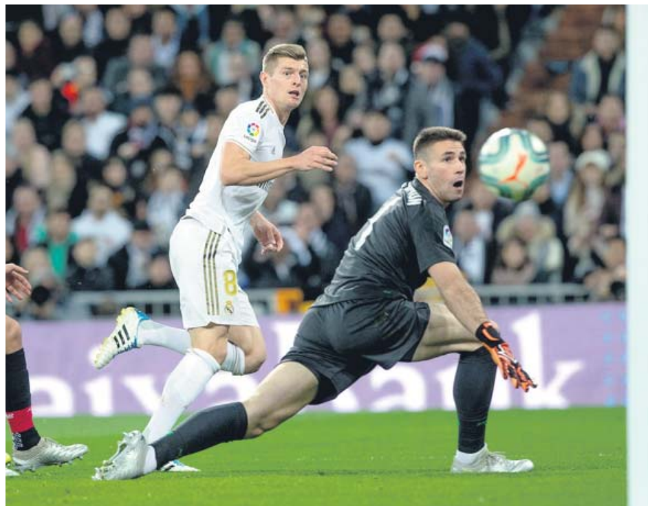
Toni Kroos dispara a portería ante el portero del Athletic Club de Bilbao, Unai Simón.

Apostó Zidane por sus dos jóvenes perlas brasileñas en las bandas, y ninguno de los dos brilló. Vinicius estuvo más incisivo pero de nuevo falló de cara al gol, mientras que Rodrygo estuvo más gris de lo habitual y acabó siendo sustituido. Garitano, por su parte, optó por salir con tres centra-