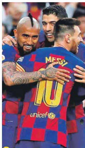
Vidal, Messi y Suárez, tras un gol ante el Alavés.

Así, el 2019 se suma a las seis veces en las que el Barcelona no concedió ningún triunfo del rival en el Camp Nou (1957-media temporada en el Camp Nou, pues fue inaugurado el 24 de septiembre, y media en Les Corts-, 1959, 1968, 1974, 1975 y 2011).