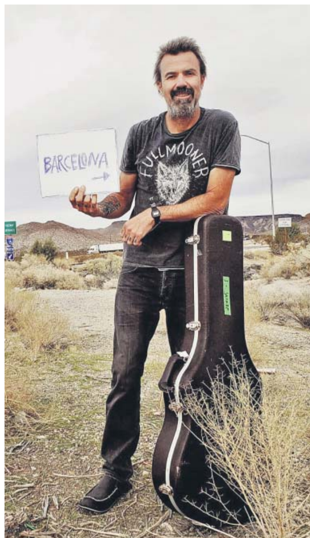
Pau Donés posa junto a su guitarra.

himnos como La Flaca , Depende , Grita o Bonito serán interpretados por los 19 miembros que han formado parte de Jarabe de Palo. La página web del grupo abre la posibilidad al regreso con el mensaje «Adiós... pero hasta luego». Tampoco desvela nada al respecto Donés, quien comenta que no sa-