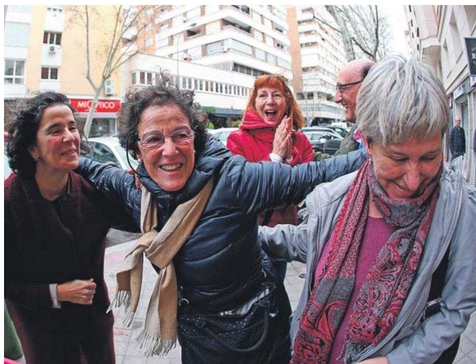
Arriba, dos agraciadas en San Lorenzo del Escorial. A la izquierda, la administración 31 de Madrid, en Félix Boix, también afortunada.