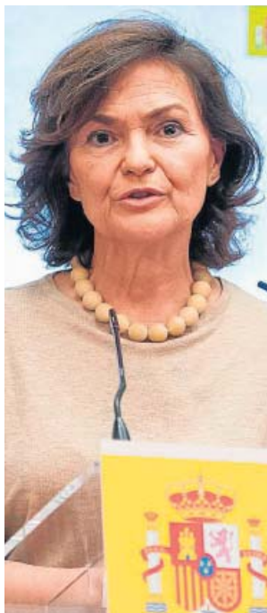
Carmen Calvo Vicepresidenta primera

Calvo se mantendrá como número 2 del Ejecutivo. Además, seguirá como ministra de Presidencia y asumirá las competencias de memoria histórica.