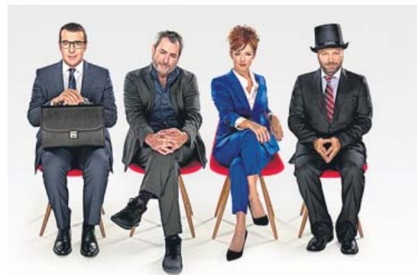
Los protagonistas de El método Grönholm . SMEDIA

Basada en un hecho real, la función cuenta en un único acto cómo cuatro aspirantes a un puesto ejecutivo en una compañía multinacional se enfrentan a la última fase del proceso de selección. Es una