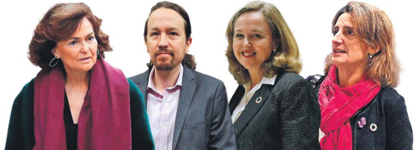
CARMEN CALVO Vicepresidenta primera, de Presidencia y Relaciones con las Cortes