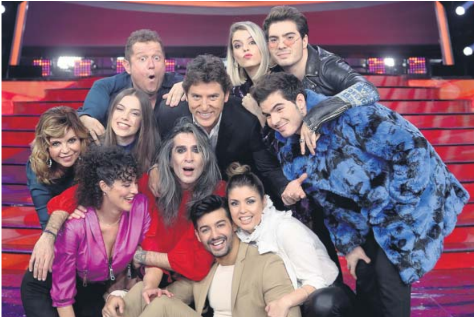
El elenco de concursantes de TCMS, junto al presentador, Manel Fuentes (arriba, centro). A3