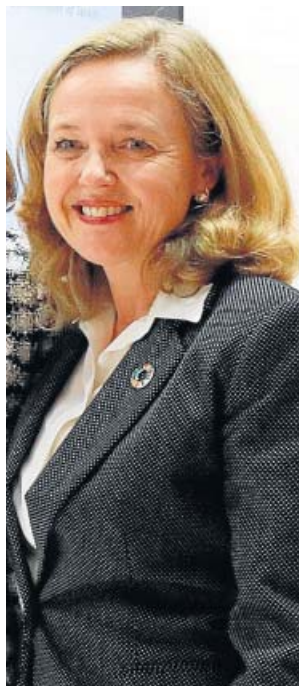
Nadia Calviño Vicepresidenta tercera

El líder de Podemos accede al Gobierno seis años después de fundar su partido. Será el encargado de las áreas de Derechos Sociales y Agenda 2030.