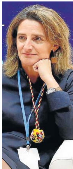
Teresa Ribera Vicepresidenta cuarta

Calviño mantendrá la cartera de Economía. Con una amplia carrera en Bruselas, ejercerá como la guardiana de la ortodoxia económica del nuevo Ejecutivo.