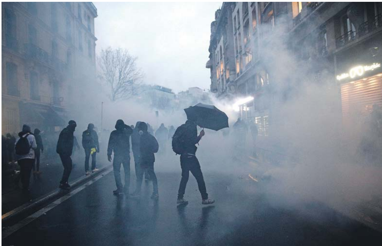
Un grupo de personas durante las protestas de ayer en París por la reforma de las pensiones que propone Emmanuel Macron.

●●● Navarro es el abogado de Jupol, creado en 2018 y que tan solo un año después se convirtió en el sindicato mayoritario del CNP. «Está promoviendo muchos cambios en la Policía, que tiene procedimientos y resoluciones muy arcaicos», apunta el letrado, y cita por ejemplo esa tendencia a conceder reducciones de jornada de solo el 50%. «Estos han sido los dos primeros casos, pero tenemos otro al caer. Para acudir al juzgado primero hay que hacer la solicitud a la Dirección General y que lo deniegue, y está a punto».