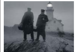
Robert Pattinson y Willem Dafoe, fareros.

Como un faro en el fin del mundo, alzado sobre una grieta entre las tinieblas, la segunda película de Robert Eggers te lanza a la cara la radiación de las interpretaciones al límite de Willem Dafoe y Robert Pattinson. De la oscuridad de la sala de cine brota llena de luz blanca una pantalla —en formato 1.19:1, con fotografía en blanco y negro expresionista de Jarin Blaschke— seguida por la quilla de un barco que avanza mientras el ruido de las olas se confunde con el re-