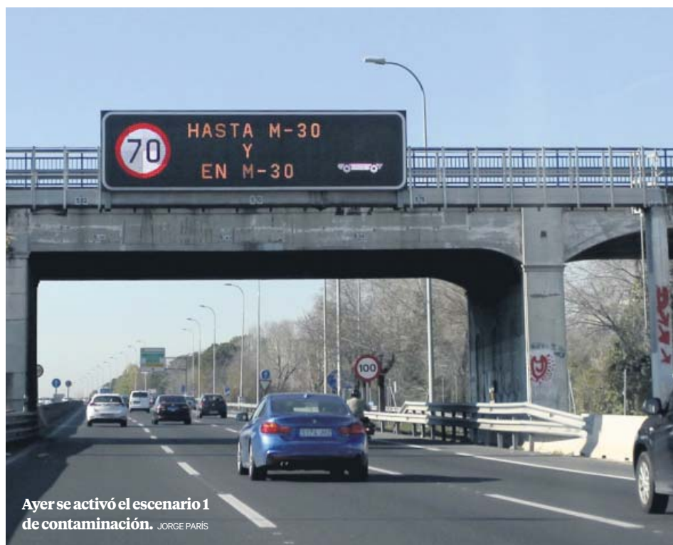
Ayer se activó el escenario 1 de contaminación.

RÉPLICA El equipo de Almeida: «Madrid volvió a incumplir la directiva europea con el plan de Carmena»