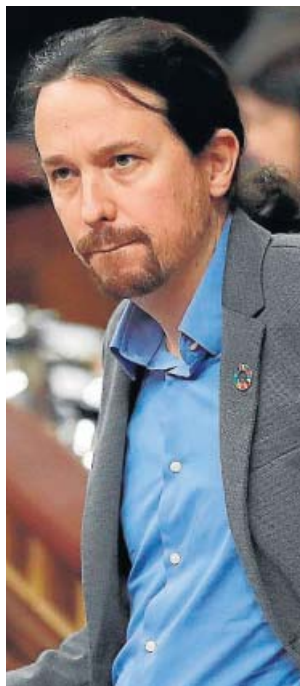
Pablo Iglesias Vicepresidente segundo

Calvo se mantendrá como número 2 del Ejecutivo. Además, seguirá como ministra de Presidencia y asumirá las competencias de memoria histórica.