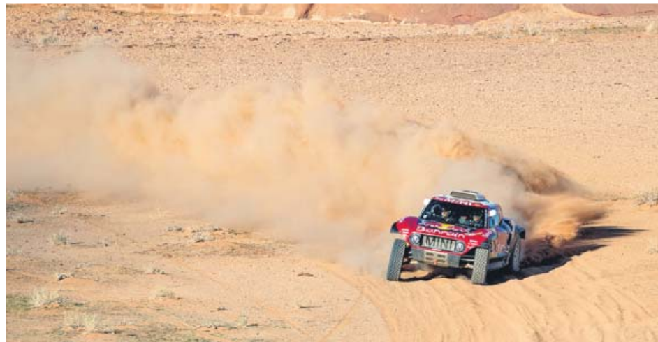
Carlos Sainz en la quinta etapa de ayer.

Tampoco fue un buen día para Fernando Alonso, que fue de más a menos hasta dejarse más de 12 minutos en meta. Tras arrancar el día con buenas sensaciones, al asturiano le fue costando cada vez más seguir el ritmo de los de arriba, aunque acabó con