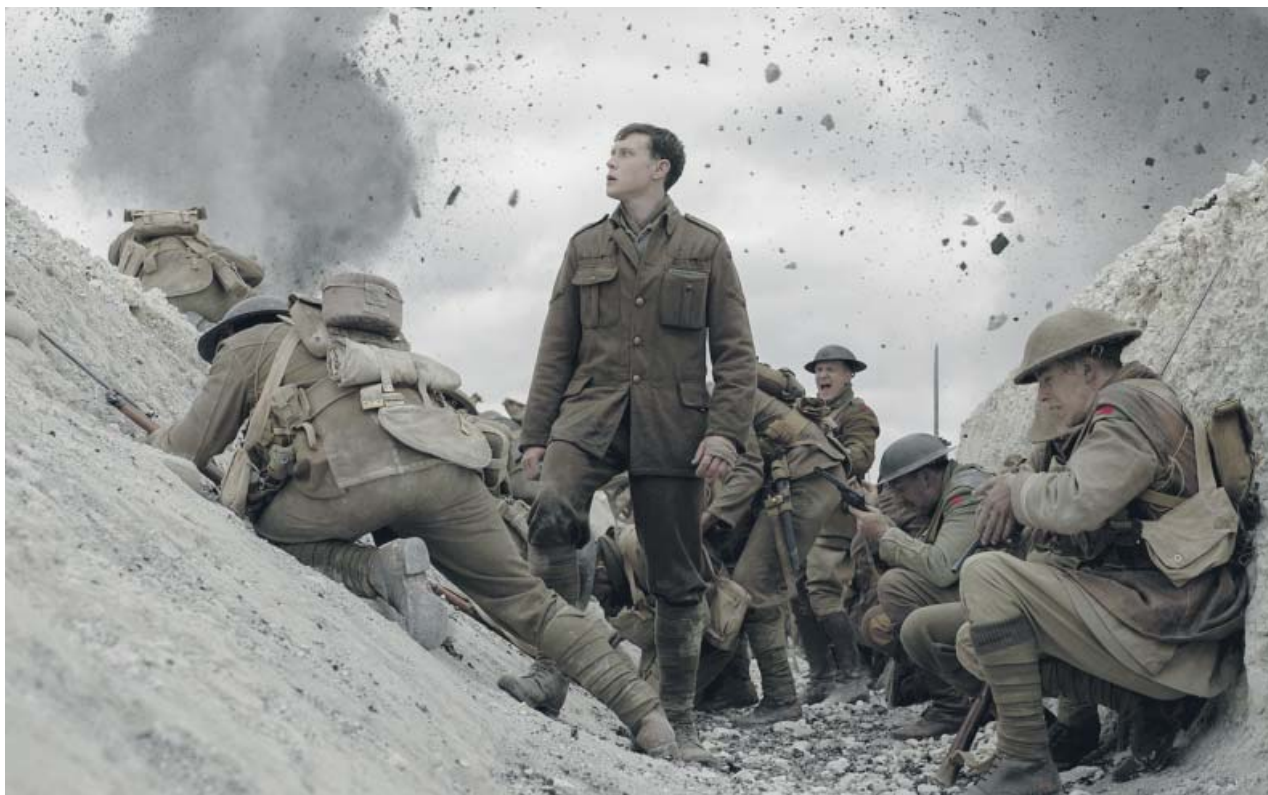
George MacKay, en las trincheras de Sam Mendes para este experimento lleno de adrenalina.