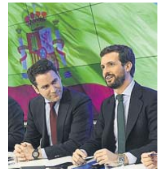
García Egea (i) y Casado, en la Junta Directiva Nacional.

Pablo Casado ya camina por la senda de la oposición y ayer lo hizo criticando duramente la propuesta de Dolores Delgado para la Fiscalía General del Estado. «Ya en campaña electoral oímos eso de que Sánchez mandaba sobre la Fiscalía», sostuvo el presidente del PP en su discurso ante la Junta Directiva Nacional, celebrada en Génova. Así, los populares recurrirán el nombramiento «cuando se produzca», y lo harán citando el artículo 59 del estatuto fiscal, que establece que no podrán ser miembros del Ministerio Fiscal quienes pertenezcan a partidos políticos o sindicatos.