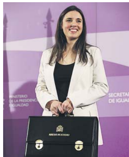
La ministra de Igualdad, Irene Montero, y el ministro de Consumo, Alberto Garzón.

siones, aunque no es seguro que se tome una decisión en la reunión de este martes. Podría posponerse hasta el primer Consejo de Ministros ordinario, que se celebrará este viernes, o más adelante. En los últimos días, fuentes del Gobierno apuntaban a que hay margen hasta final de mes, es decir, hasta la próxima nómina, para que los pensionistas cobren desde el principio la subida que prometió Sánchez para 2020.