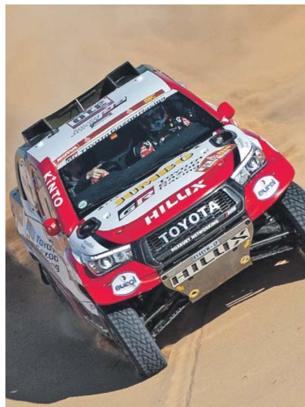
Fernando Alonso, durante el Dakar 2020.