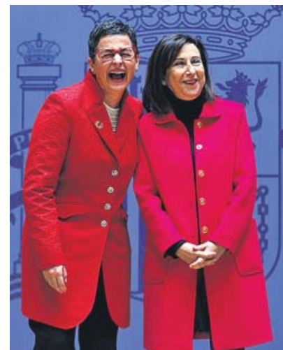
Las ministras de Exteriores y Defensa, Arancha González y Margarita Robles.