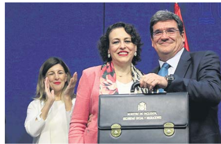
José Luis Escrivá recibe su cartera de ministro de Seguridad Social.