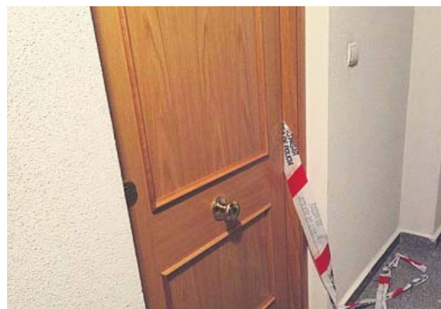
Domicilio en el que se hallaron los cadáveres.

dió esperar a lo que señalen los técnicos sobre las causas del hundimiento, aunque cree que en principio podría haberse debido al «peso» de la tierra, que se incrementó por el agua caída en los últimos meses. Además, reconoció que los vecinos habían denunciado a la empresa constructora de los pisos por filtraciones de agua en el aparcamiento, pero ha señalado que «en ningún peritaje» se apuntó que hubiera «riesgo estructural». ●