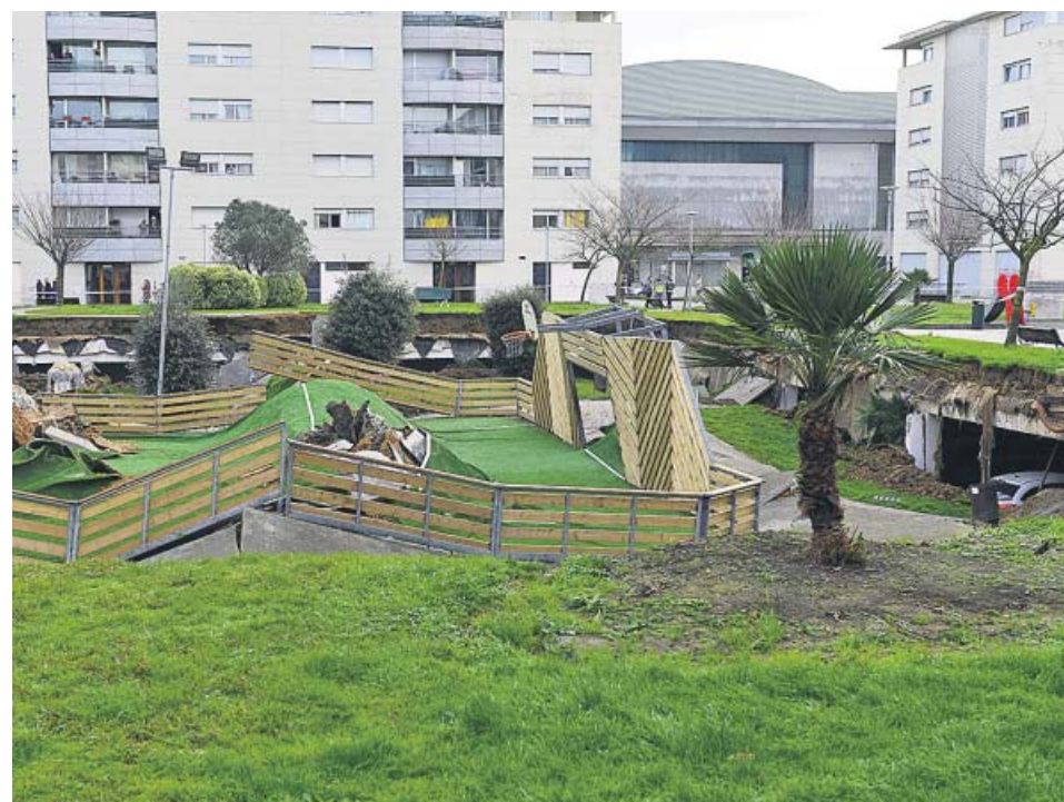
Imagen del parque derrumbado ayer sobre un aparcamiento en Santander.

Este crimen se conocía el día en el que los ministros del nuevo Gobierno de coalición de PSOE y Unidas Podemos tomaban posesión ante el rey Felipe VI, entre ellos Irene Montero, titular de Igualdad, cuyas primeras palabras en el cargo fueron para condenar de forma rotunda este último asesinato machista y para agradecer el trabajo de los policías que el domingo resultaron heridos al proteger a una mujer de la agresión de su pareja en Madrid. Montero aseveró que «acabar con todas las formas de violencias machistas es una tarea de todas y de todos» y a renglón seguido manifestó: «Nuestro compromiso será firme para hacer todo lo posible para que no haya ni una víctima más, para que no seamos ni una menos». ●