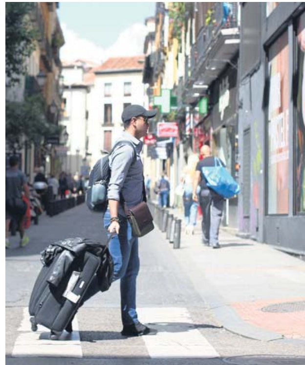
Un turista se dirige a su alojamiento en el centro de Madrid.

Según datos del Gobierno regional, ahora mismo en Madrid hay más de 11.000 viviendas turísticas –según los datos recopilados en la web insideairbnb , las ofertas en Airbnb en Madrid superan las 20.000–, lo que, en pa-