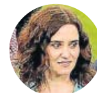
ISABEL DÍAZ AYUSO Presidenta de la Comunidad de Madrid

«Más que la igualdad entre hombres y mujeres, quiero reivindicar la libertad, que es lo más importante»