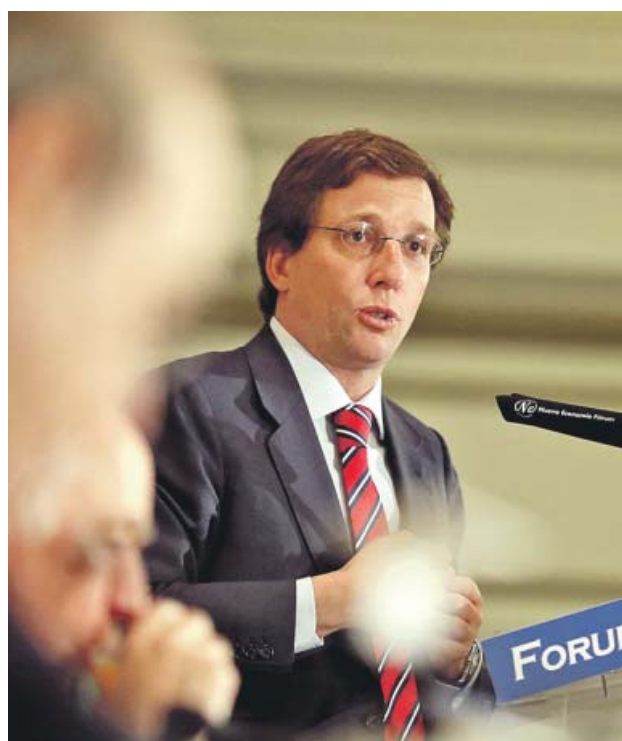
Martínez-Almeida en el desayuno.

rrano, donde el aparcamiento subterráneo eliminó la banda de aparcamientos de coches para ganar espacio público para el peatón. Los vecinos de la zona no tardaron en reaccionar ante esta noticia. «Una auténtica barbaridad de espaldas a los vecinos de Retiro. No hay ni 300 plazas azules y nos quieren meter 1.000 junto al parque del Retiro, el segundo sitio con mayores medidas de NOX (óxido de nitrógeno) de la