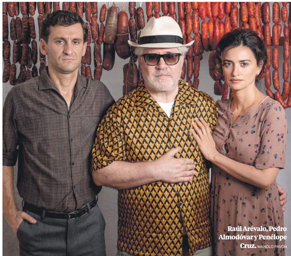
Raúl Arévalo, Pedro Almodóvar y Penélope Cruz.

Aunque Netflix se fue de los Globos de Oro con poca cosa entre las manos, ha conseguido ahora liderar las nominaciones (24) a los Óscar, que celebrará su 92 edición en Los Ángeles (EE UU) el 9 de febrero. ●