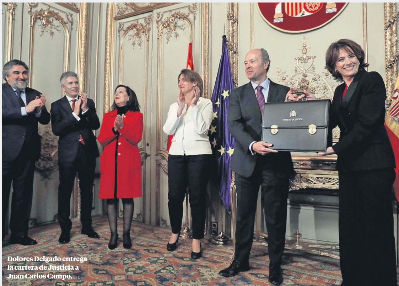
Dolores Delgado entrega la cartera de Justicia a Juan Carlos Campo.