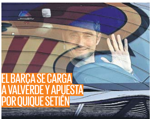
EL BARÇA SE CARGA A VALVERDE Y APUESTA POR QUIQUE SETIÉN

El alcalde de Madrid, José Luis Martínez-Almeida, anunció ayer una reforma integral de la calle Menéndez Pelayo que empezará en 2020 y que implicará la ampliación de sus aceras y la construcción de un aparcamiento subterráneo. La reforma sería similar a la que ejecutó el Ayuntamiento en la calle Serrano. La asociación de vecinos Retiro Norte rechazó ayer el plan municipal. PÁGINA 2