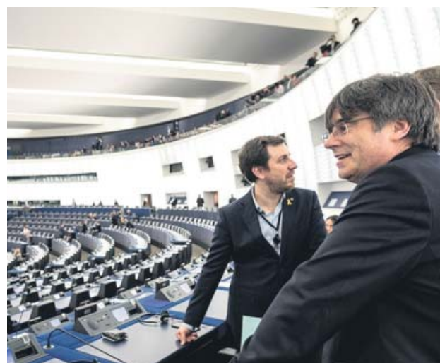
Puigdemont y Comín, ayer, en el Parlamento Europeo.

Puigdemont y Comín llegaron a Estrasburgo por la mañana,