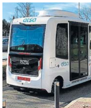
El bus autónomo, modelo Z10, ayer.

En este proyecto han colaborado la propia universidad, el Consorcio Regional de Transportes, la DGT y la compañía Alsa. El nuevo transporte es 100% eléctrico, tiene capacidad para 12 pasajeros (6 sentados y otros tantos de pie) y hará un recorrido de 3,8 km por el citado campus. ● M. T. F.