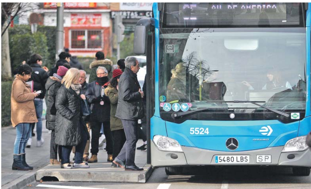
Personas esperando para utilizar el servicio especial de autobuses en Santa María, Hortaleza. JORGE PARÍS