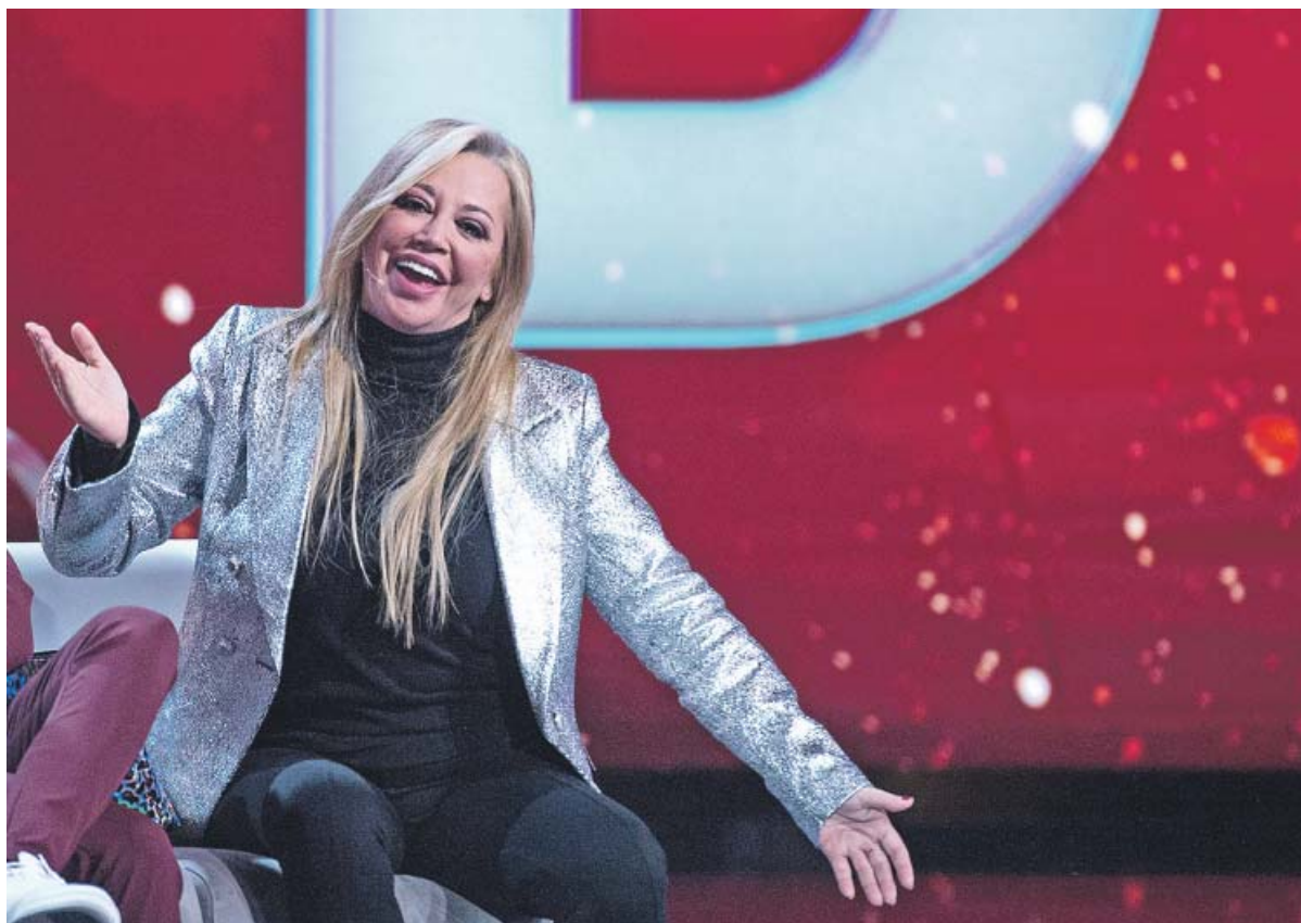
La colaboradora de televisión Belén Esteban, en una imagen reciente.