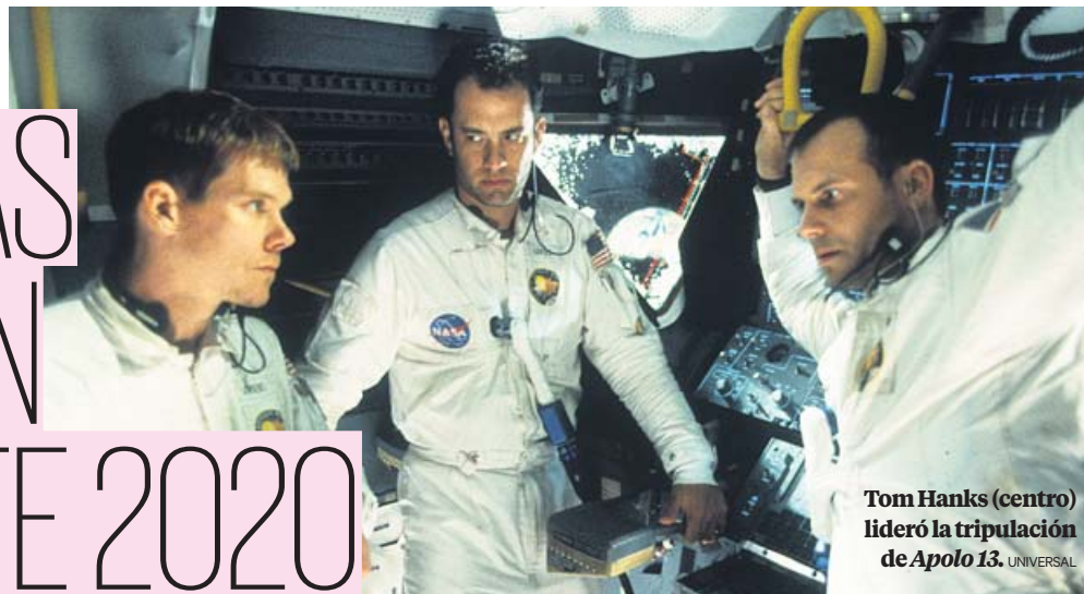
Tom Hanks (centro) lideró la tripulación de Apolo 13.

¿Cómo olvidar algunos diálogos de los mejores largometrajes de 1995? 25 años después, volvemos al cine de aquel año