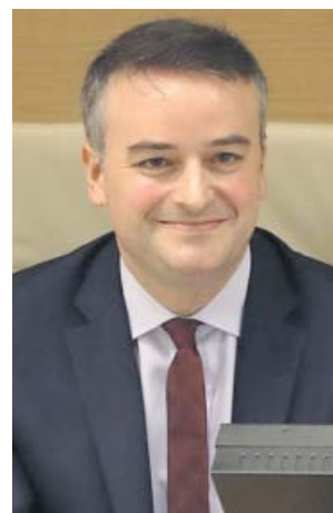
El jefe de gabinete de Pedro Sánchez, Iván Redondo.