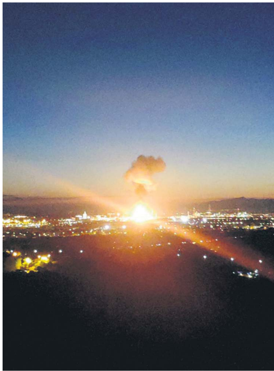
Explosión de la planta química, instantes después del accidente.

DOS CARRETERAS y dos líneas de Renfe permanecieron cortadas durante más de una hora