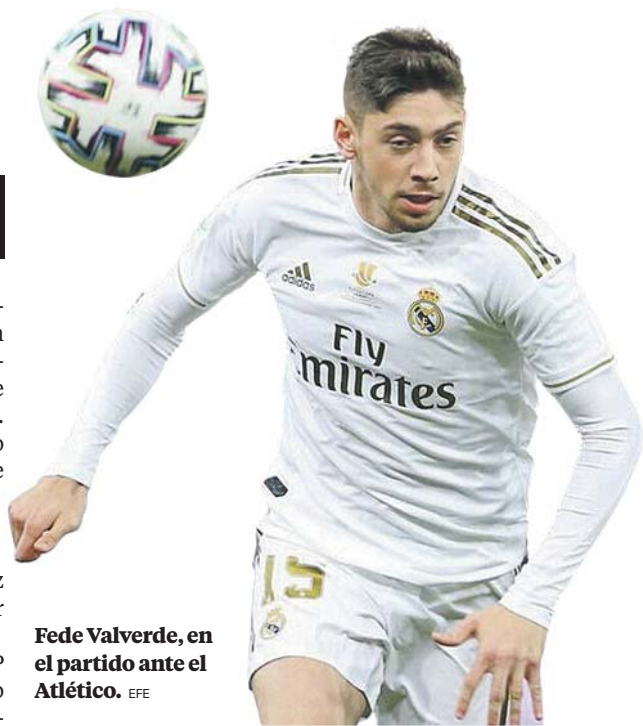
Fede Valverde, en el partido ante el Atlético.

SU GRAN TEMPORADA le ha convertido en indiscutible y en uno de los mejores medios del mundo