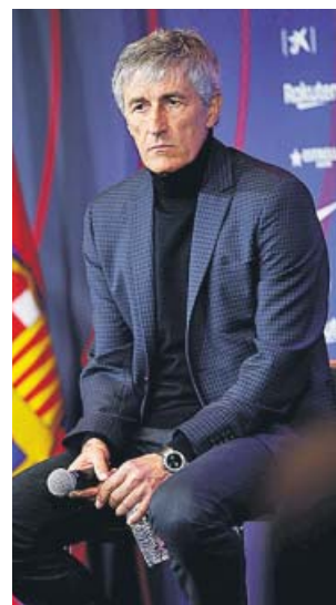
Setién, en su presentación como técnico del Barça.

«Ni en mis mejores sueños hubiera podido imaginar estar aquí», admitió un Setién visiblemente emocionado en su presentación. Después, sor-