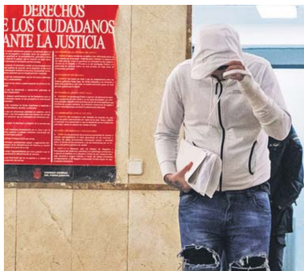
Uno de los jóvenes detenidos por la violación grupal.