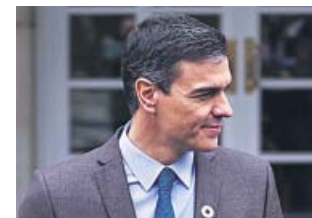
El presidente del Gobierno, Pedro Sánchez, en Moncloa.

Con Cataluña ya en precampaña electoral, Torra quiere solo una reunión con Sánchez, en un formato que excluiría a Aragonès, uno de los posibles can-