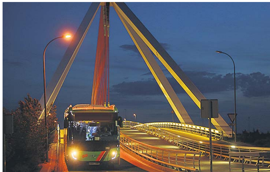
Un autobús interurbano circulando por la noche. AYUNTAMIENTO DE LAS ROZAS

El también diputado de Cs recordó que de momento se encuentran volcados en conformar un protocolo de actuación