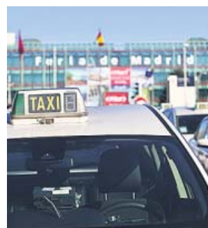
Imagen de archivo de un taxi en la Feria de Madrid.

«Han pasado ya cerca de dos meses y seguimos sin conocer las medidas», señaló Julio Sanz, presidente de la Federación Profesional del Taxi de Madrid. «No decimos que no estén trabajando en ello, pe-