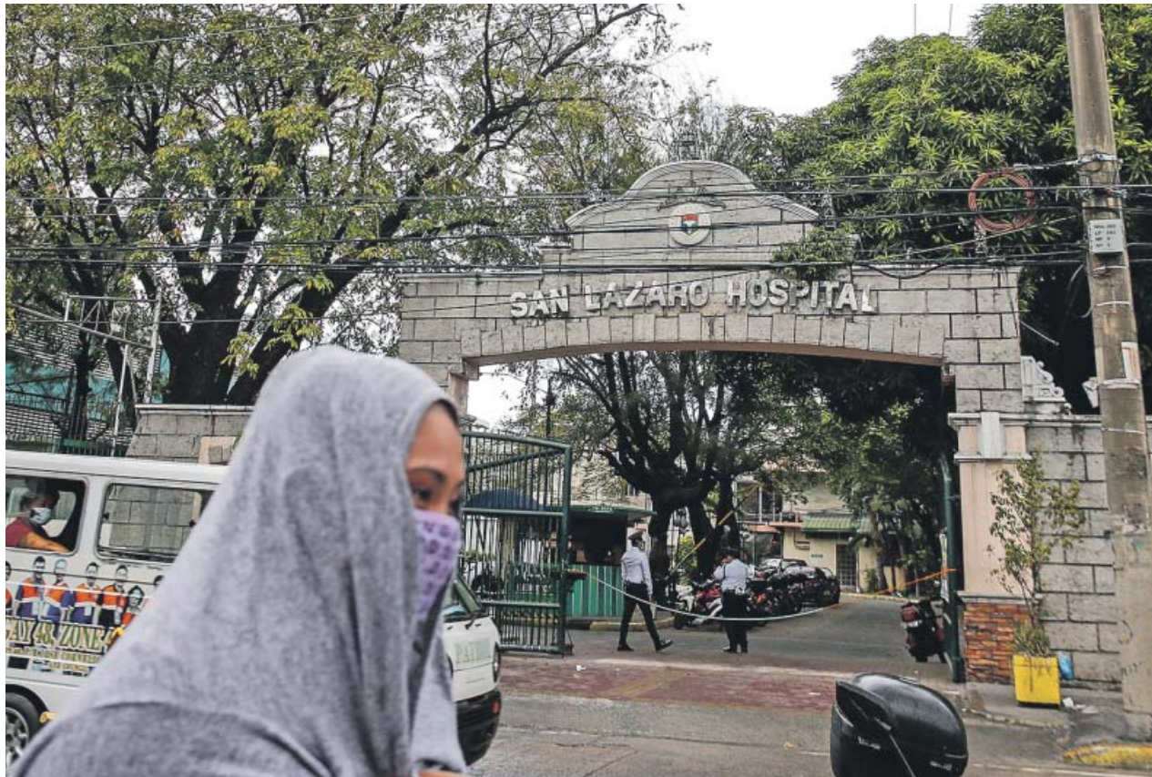
Una mujer pasa por delante del Hospital San Lázaro, en Filipinas, donde ha muerto una persona por el coronavirus.