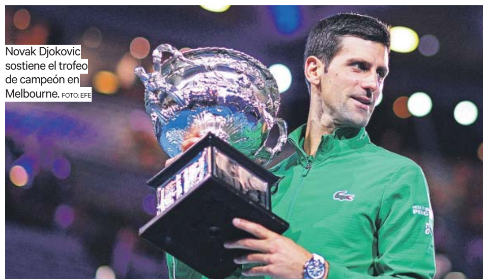
Novak Djokovic sostiene el trofeo de campeón en Melbourne.