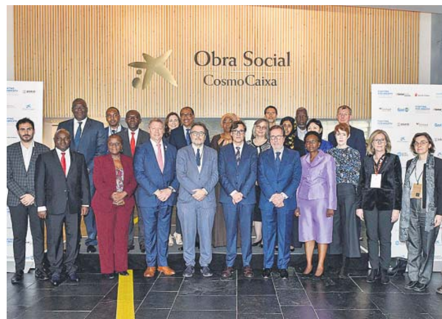
Expertos asistentes al foro mundial sobre la neumonía infantil en CosmoCaixa.

«Esta propuesta la hago ahora por sí se adelantan las elecciones en Cataluña», señaló Arrimadas, que subrayó la necesidad de tener soluciones y contemplar todos los escenarios. No obstante, algunos cargos del partido naranja reuelan de esta gran alianza constitucionalista. ●