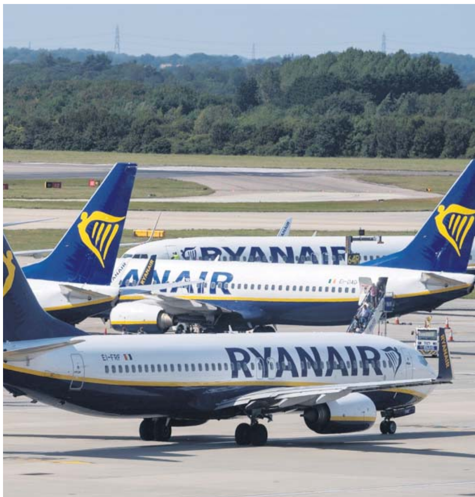
Varias aeronaves de la aerolínea irlandesa Ryanair, en una imagen de archivo.

Este ERE se produce a pesar de que los vuelos desde estos ae-