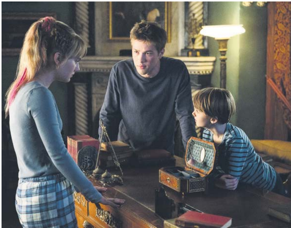
Los protagonistas de 'Locke & Key', tres hermanos en busca de llaves mágicas.