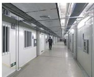
Interior del hospital Huoshenshan, en Wuhan.

Hoy ha comenzado a funcionar, con un personal de 1.400 trabajadores sanitarios militares, el nuevo hospital levantado de forma exprés en 10 días en la ciudad de Wuhan, epicentro del contagio del nuevo coronavirus, que se ha cobrado ya la vida de 305 personas. Las nuevas instalaciones tienen un total de 1.000 camas.