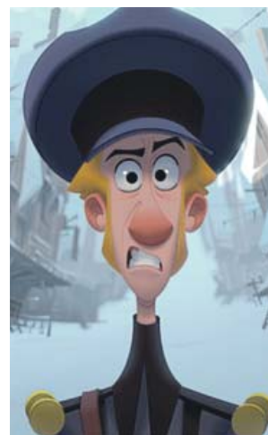
Jesper, el cartero que protagoniza Klaus . NETFLIX

La otra esperanza española estaba puesta anoche en Dolor y