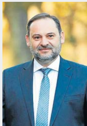
José Luis Ábalos Ministro de Transportes

Es uno de los pocos apoyos de Sánchez respecto a Venezuela. Ejerce de mediador internacional en el país entre el chavismo y la oposición. Su labor ha sido muy criticada. No reconoce a Guaidó.