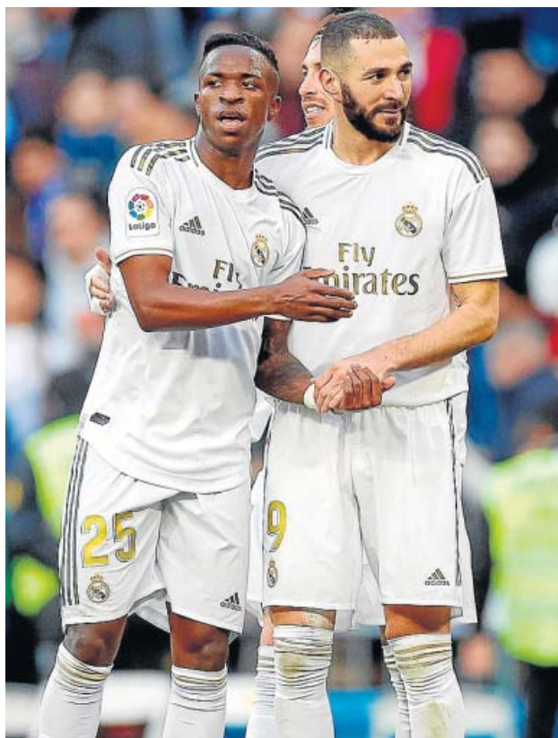
Vinicius y Benzema celebran el gol del gallo el sábado.

MENDY se está destapando como un lateral de grandísimo nivel. Y Vinicius da muestras de su talento