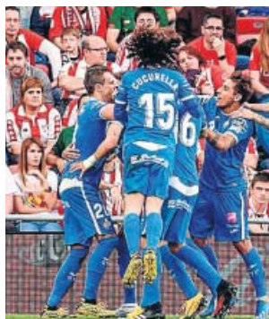
Los jugadores del Getafe celebran uno de los goles.

Una victoria inapelable de los azulones, que se auparon a la tercera plaza provisional de la tabla —empatados a 39 puntos con el Sevilla, cuarto— y abrie-