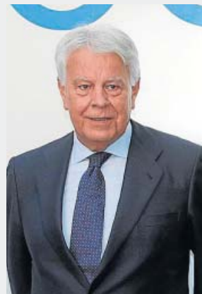
Felipe González Expresidente del Gobierno

Está en el centro de la polémica por su reunión con Delcy Rodríguez en Barajas. Ha dado varias versiones en los últimos días y a pesar de las críticas de la oposición, asegura que no va a dimitir.