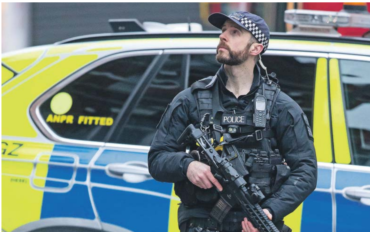
Un policía armado asegura el área donde se produjo el ataque, en una calle del barrio de Streatham, en Londres.

●●● El Consejo de Ministros aprobará mañana la subida del salario mínimo a 950 euros, que las empresas deberán aplicar desde el 1 de enero y también aumentar las bases de cotización. Pero no está previsto que suban para los autónomos como consecuencia de los 50 euros más de salario mínimo. La semana pasada, en la reunión preparatoria, este tema no se trató, por lo que lo previsto es que se mantengan congeladas como se acordó en 2018.