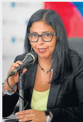
Delcy Rodríguez Número dos de Nicolás Maduro

Muy crítico con el cambio de rumbo de Sánchez. Para él, Guaidó es el «único representante legítimo» de Venezuela y asegura no entender la postura del Gobierno. Se opone radicalmente a Maduro.