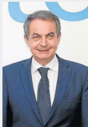
José Luis R. Zapatero Expresidente del Gobierno

Es uno de los pocos apoyos de Sánchez respecto a Venezuela. Ejerce de mediador internacional en el país entre el chavismo y la oposición. Su labor ha sido muy criticada. No reconoce a Guaidó.