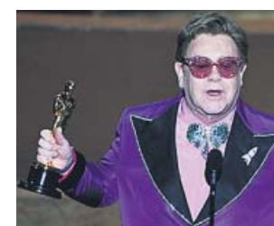
Música y glamur Las voces de Frozen 2 , incluida la de la española Gisela, Penélope Cruz a punto de entregar el Óscar a mejor película de habla no inglesa y Elton John tras obtener el de mejor canción por el tema de Rocketman .