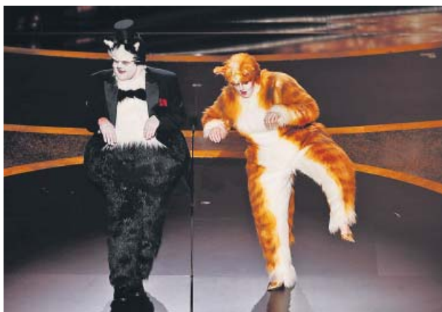
Un toque de humor James Corden y Rebel Wilson entregaron el Óscar a mejores efectos especiales disfrazados de gatos de la muy criticada Cats .