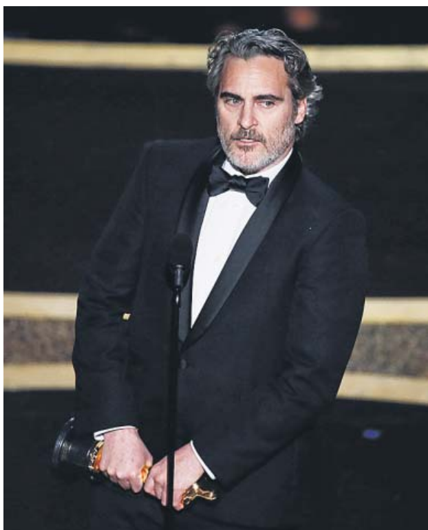
Óscar a mejor actor principal por 'Joker' Joaquin Phoenix, que no consume productos animales desde joven, aprovechó su discurso para promover el veganismo.