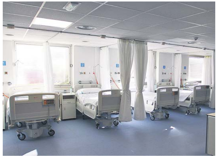
Son muy útiles para pacientes en planta pero con riesgo de deterioro clínico.

Finalmente, la pareja manifestó que el parto se remonataba al 28 de enero y que habían arrojado al bebé en el río Carrión, en un paraje cercano a Husillos, a 12 km de Palencia, donde los agentes encontraron el cadáver al fondo del río. ●