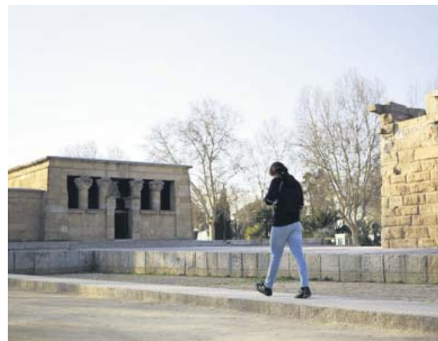
El templo de Debod, ayer por la tarde. JORGE PARÍS

El director general de Patrimonio del Ayuntamiento, Luis Lafuente, añadió que se intenta minimizar «los efectos