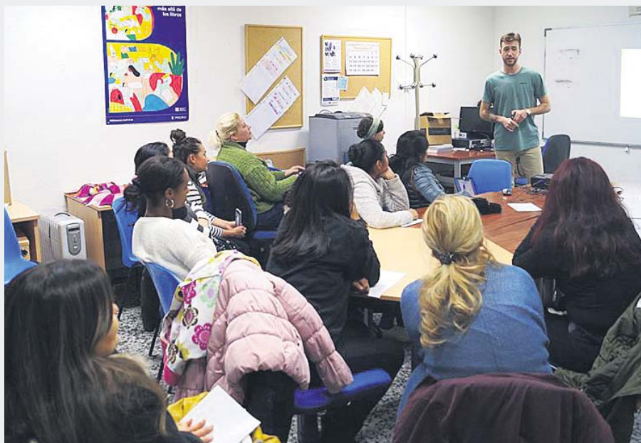
Una de las actividades del proyecto de apoyo educativo de Mujeres de Opañel.