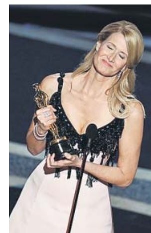
Mejor actor y actriz de reparto Tal y como se esperaba, Brad Pitt ( Érase una vez en... Hollywood) y Laura Dern ( Historia de un matrimonio) ganaron una estatuilla.