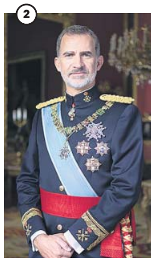
LA CASA REAL, EN IMÁGENES

1 Nueva foto familiar. Coincidiendo con el inicio de la nueva legislatura, la Casa Real ha renovado sus fotos familiares con un modernizado book. En la imagen, los reyes junto a sus hijas posando con un estilo renovado.