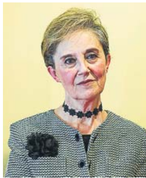
Paz Esteban durante su toma de posesión.

Esteban, que cuenta con 30 años de experiencia en servicios de espionaje, agradeció al Gobierno su confianza, que considera «una señal clara de respaldo a la institución», ya que ejerció como directora interina desde verano. Será la primera mujer que dirige el Centro y la encargada de revisar su estructura interna y completar el «proyecto de transformación digital», según explicó Esteban. ●