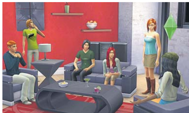
Imagen del videojuego Los Sims 4 . ELECTRONIC ARTS

Se han creado más de 1.600 millones de Sims, se han construido más de 575 millones de casas, ha habido 37 millones de bodas y se han tenido 173.000 hijos e hijas. Unas grandes cifras que irán aumentando pues, mientras los usuarios continúan jugando con sus vidas virtuales, Los Sims seguirán viviendo. ● J. PLAZA TORRES