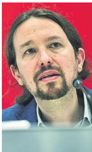
Pablo Iglesias, hace unos días.

Según dijo el vicepresidente, su presencia ha sido aprobada e incluso buscada por Sánchez, que le habría «pedido» que estuviera en el órgano, en el que también tendrán presencia otros ministros del Gobierno que Iglesias no detalló. «Me voy a esforzar mucho, voy a intentar ser útil a mi país, hace falta diálogo, diálogo y diálogo», sostuvo el dirigente, que aseguró que el proceso de negociación