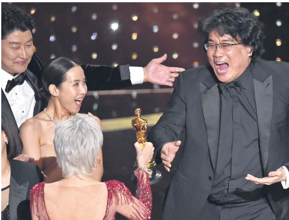
El director Bong Joon-ho celebra con entusiasmo el Óscar a mejor película para Parásitos (izquierda) y Renée Zellweger habla emocionada tras ganar el de mejor actriz principal por Judy.