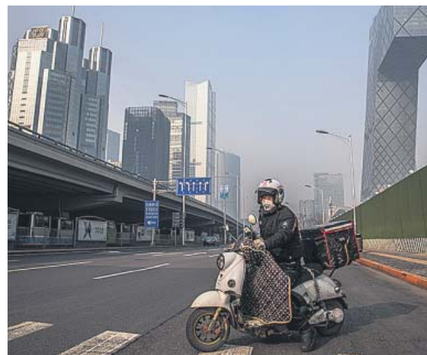
Avenida casi desierta, ayer, en Pekín.

El Ministerio de Salud de China, por su parte, confirmó ayer que ya se ha superado el millar de muertos por el brote, alcanzando la cifra de 1.016 fallecidos. Los contagiados en el país ascendían a 42.638 personas. Además, un informe médico chino indica que el período de in-