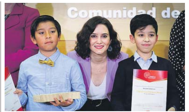
Odiaga y Elkinani, con Isabel Díaz Ayuso.

La línea 6 fue, un año más, la que mayor número de viajeros registró, al alcanzar los 111,7 millones. Por Sol, la estación más concurrida, pasaron 24,4 millones de viajeros. Muchos de ellos lo hicieron el pasado 29 de noviembre, que fue el día de mayor demanda en los cien años de historia de Metro con 2,7 millones de viajeros. ●