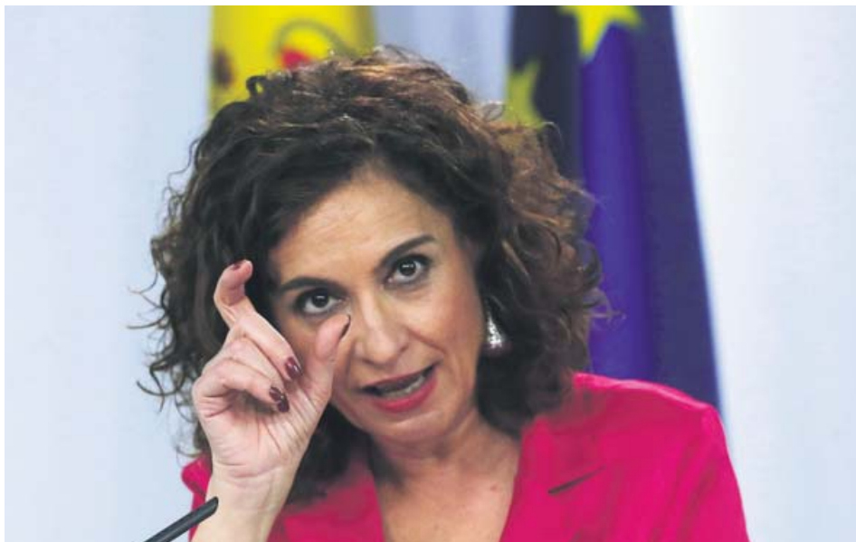
La ministra de Hacienda y portavoz del Gobierno, María Jesús Montero, ayer en Moncloa.

MONTERO no desvela cómo piensa cuadrar vía impuestos un mayor gasto y un menor crecimiento