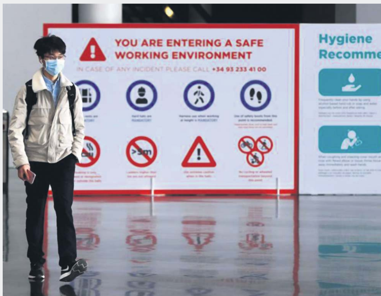
Un operario, protegido por la mascarilla, abandona las instalaciones del Mobile World Congress.

LOS NUEVOS LIBROS CON NOMBRE DE MUJER/PÁG. 13