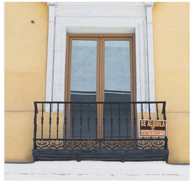
Una vivienda con el cartel de se alquila.

La alternativa que propone CAFMadrid a la regulación de los precios es la puesta en funcionamiento de un Registro de Morosos del Alquiler, contemplado en la reforma de la Ley de Arrendamientos Urbanos de 2013, pero que todavía no ha sido desarrollado. «Este registro permitiría acreditar al arrendador que su futuro inquilino no ha sido condenado por impago de rentas, aportaría una mayor seguridad jurídica y favorecería la salida de viviendas vacías al mercado de arrendamiento de larga duración. Como consecuencia, habría una mayor oferta que redundaría en un equilibrio de precios», considera Bajo.