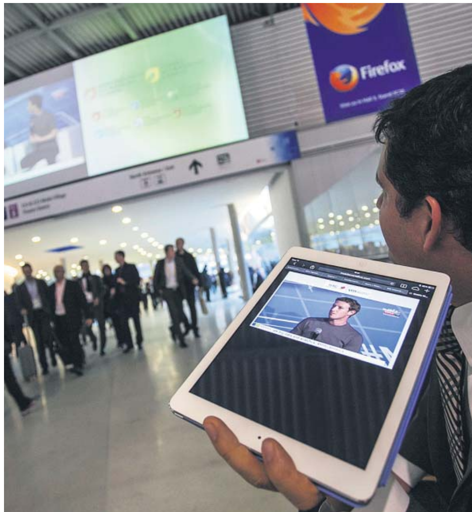
La red social Facebook no tomará parte en el próximo Mobile. HUGO FERNÁNDEZ

Llovía así sobre mojado en un acontecimiento que ya acumulaba 18 anulaciones de peso. A lo largo de la última semana, GSMA ha sostenido en todo momento que el salón no peligra pese a la intranquilidad mundial ante la propagación del coronavirus dentro y fuera de China, y a que la cifra de muertos iba en aumento en el país asiático. Anunció medidas sanitarias extraordinarias dentro del congreso y vetó el acceso a los congresistas de la provincia china de Hubei, el foco del brote, o que hayan estado en China en los 14 días previos al próximo 24 de febrero. Pero todos estos esfuerzos no han conseguido parar las desercio-