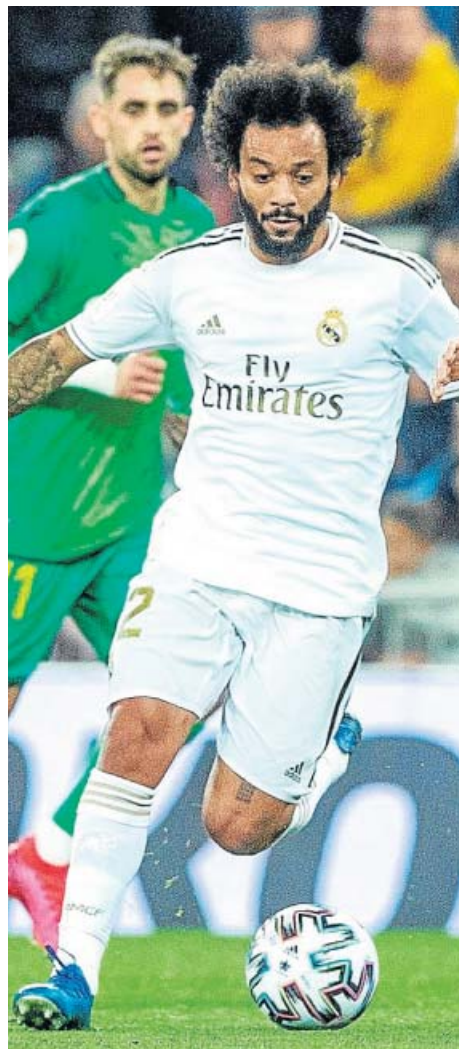
Marcelo Viera (izquierda) y Gareth Bale (derecha) esta temporada.

El reparto de minutos arriba es complicado, pero todos están teniendo su momento. Benzema es la estrella indiscutible, Rodrygo ha tenido apariciones asombrosas y a Vinicius se le ve cada vez mejor, cada vez más asentado para tratar de aprovechar su inmenso po-