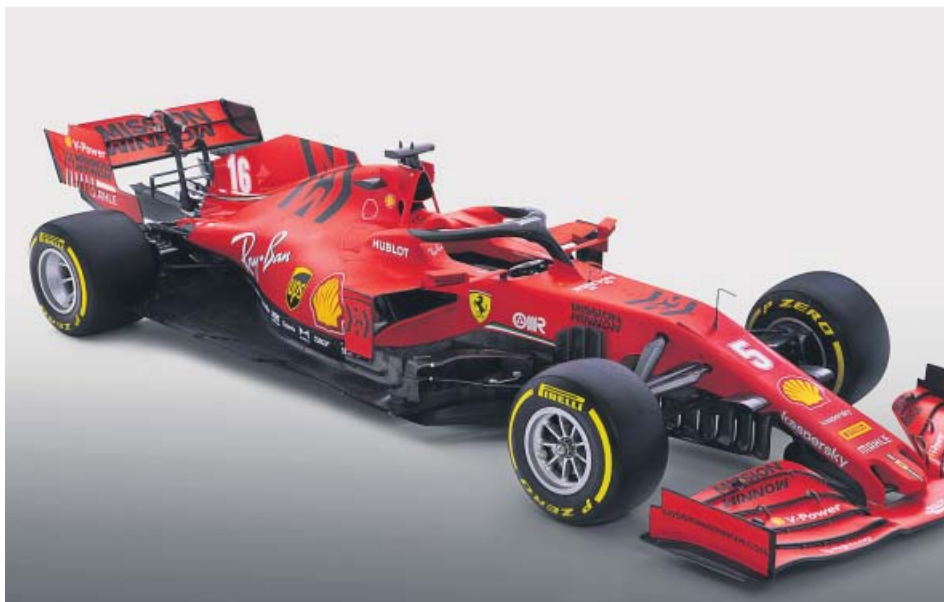
El nuevo monoplaza del fabricante de Maranello, el Ferrari SF1000.

La Scuderia presentó ayer el SF1000, un monoplaza con el que pretende acabar con la tiranía de Mercedes y con 13 años de sequía