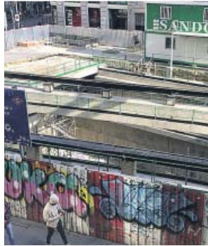
Las obras en la estación de Gran Vía, ayer. JORGE PARÍS

«Lo primero es salvar aquello que es de todos», indicó Garrido, que señaló que es «positivo» recuperar el patrimonio histórico. El consejero explicó que los trabajos de conservación quedarán completados a lo largo del primer trimestre de este año. Será entonces cuando comiencen los traba-