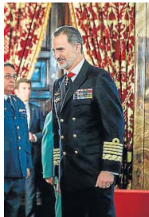
El rey, en una audiencia en el Palacio Real.

El rey se refirió recientemente, en su discurso del 5 de febrero durante la recepción al cuerpo diplomático acreditado en Madrid, a las relaciones con Estados Unidos para asegurar que para España es prioritario mantenerlas y ampliarlas.