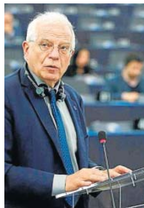
Josep Borrell, en el pleno del Parlamento Europeo.

terior, tras consultar con la UE donde corresponda, estaría directamente en contacto con los Estados miembros sobre supuestas violaciones para velar por que las sanciones se apliquen de manera homogénea», expresó. La cuestión hizo que el tono del debate se endureciera, entre acusaciones de diputados extranjeros de utilizar la Cáma-