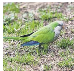
Una cotorra, ayer, en un parque de Madrid.

tres millones de euros en dicho proyecto.