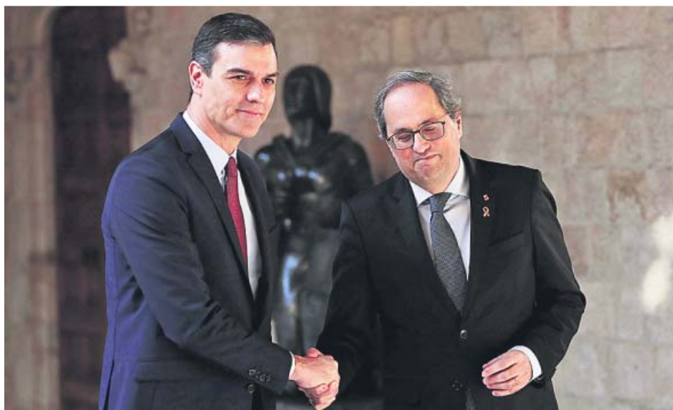
Pedro Sánchez y Quim Torra, el 6 de febrero durante su encuentro en el Palau de la Generalitat.

ERC celebra que empiece el diálogo y se mantiene alejado de la defensa del mediador que hace Torra