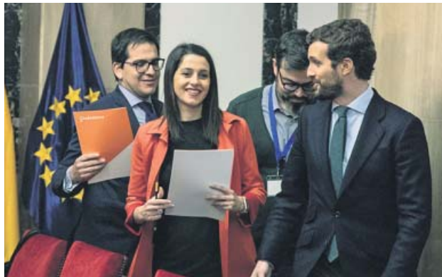
Inés Arrimadas y Pablo Casado se reunieron este martes.

Mañana se cierra el plazo para la presentación de las coaliciones —para el registro de listas tienen todavía días— y ya