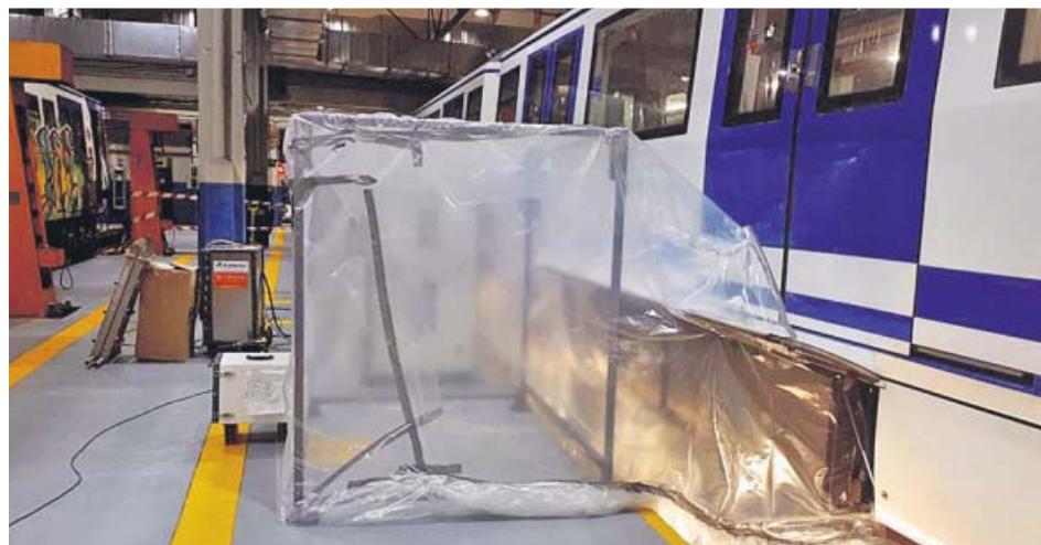
Labores de desamiantado en uno de los vagones del suburbano.