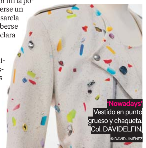
'Nowadays' Vestido en punto grueso y chaqueta. Col. DAVIDELFIN.