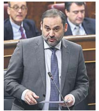
El ministro José Luis Ábalos, ayer, en el Congreso.

Las declaraciones de Ábalos se contraponen a las que realizó hace unas semanas la ministra de Economía, Nadia Calviño, que dejó caer que no hay «medidas milagro» para acabar con