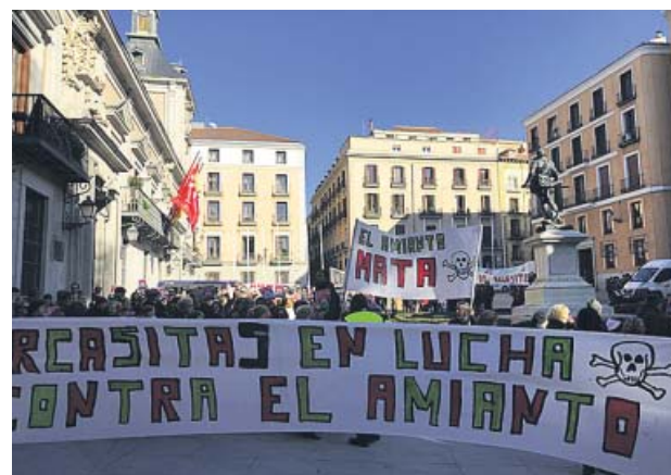
Los vecinos se concentraron ayer en plaza de la Villa.