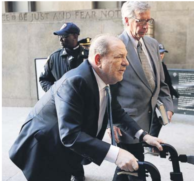
Weinstein, momentos antes de oír el veredicto.

Las siete mujeres y cinco hombres que han constituido el jurado acordaron condenar a Weinstein por un delito de violación en tercer grado a la exactriz Jessica Mann en 2013, y por un «acto sexual criminal» en primer grado cometido contra su exayudante de producción Mimi Haley en 2006. El gran 'depredador' se enfrenta a penas de 25 años de cárcel, pero salió absuelto de las tres acusaciones más graves —una violación en primer grado y dos agresiones sexuales agravadas— que podrían haberle llevado a prisión de por vida.