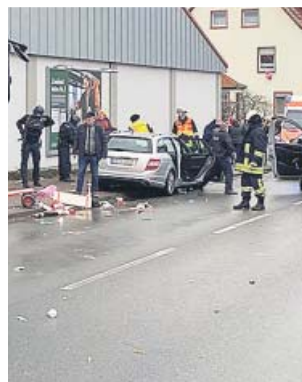
El coche del incidente tras el atropello masivo.

El hombre arremetió intencionadamente con su coche contra la multitud que celebraba el desfile —en una zona previamente cerrada al tráfico— y se adentró unos 30 metros entre el gentío, según los testimonios recogidos por los medios alemanes. «No partimos de la base de que se trate de un atentado», afirmó la dirección de