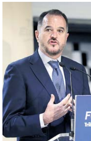
El candidato de PP+Cs al País Vasco, Carlos Iturgaiz.

Carlos Iturgaiz, por su parte, ya va marcando su propio camino, y en una entrevista en Telexinco aseguró que quiere «unir el voto» bajo su candidatura y