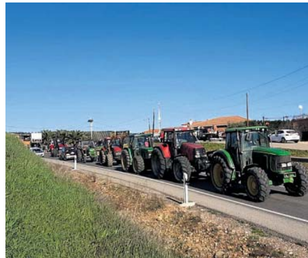
Los agricultores cortaron ayer la N-430 en Ciudad Real.

Una vez aprobado el decreto ley, el ministro reunirá por la tarde la mesa de diálogo con las tres principales organizaciones agrarias –Asaja, UPA y COAG–, un sector don-