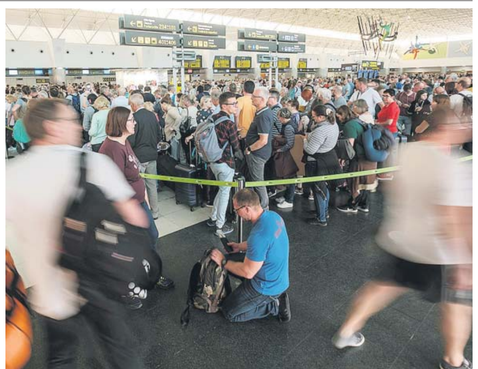
Los pasajeros abarrotan las terminales del aeropuerto de Gran Canaria tras el cese de la calma.

En esta legislatura, acabar con el veto del Senado no es fundamental para el Gobierno, que puede alcanzar la mayoría allí con las formaciones nacionalistas e independentistas. Pero el PSOE quiere curarse en salud de cara al futuro para no repetir la experiencia de 2018, cuando la mayoría absoluta con la que contaba el PP en la Cámara Alta tumbó su techo de gasto y obligó al Gobierno a diseñar unos Presupuestos para 2019 con las líneas maestras de gastos e ingresos del PP. ● DANIEL RÍOS