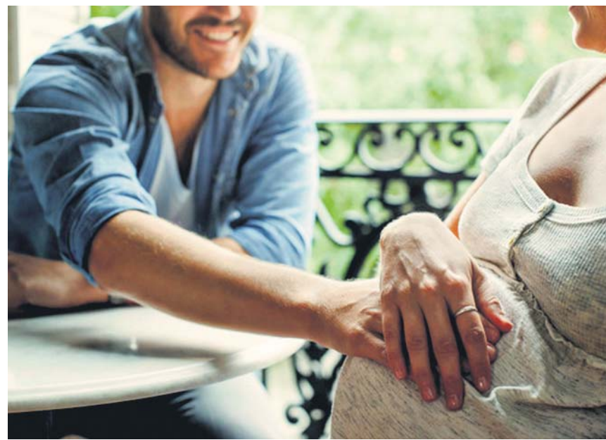
El uso clínico de la música es también recomendable en los embarazos de riesgo.

Los equipos de emergencia desplegados por el carnaval asumieron la atención de las víctimas hasta que se desplazaron 12 ambulancias y un helicóptero, así como numerosos agentes policiales y del servicio de bomberos. ● L. G. L.