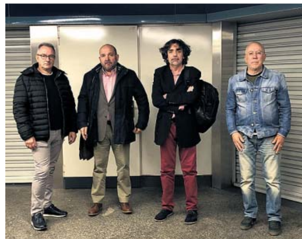
Algunos de los últimos comerciantes de Metro. JORGE PARÍS

Sobre esta cuestión, las fuentes del suburbano consultadas por 20minutos ase-