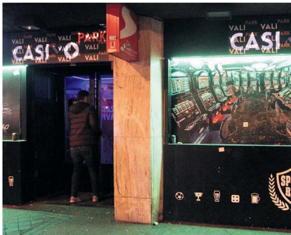
Un estudiante entrando en una casa de apuestas de Madrid.

Mientras, la edad media a la que se empieza en el consumo de alcohol en el municipio es de 14,1 años y el consumo va incrementando según va aumentando la edad de los individuos. En relación al género, el estudio asevera que la prevalencia se encuentra de manera general ligeramente más extendida entre las mujeres que en los hombres, en todas las edades.