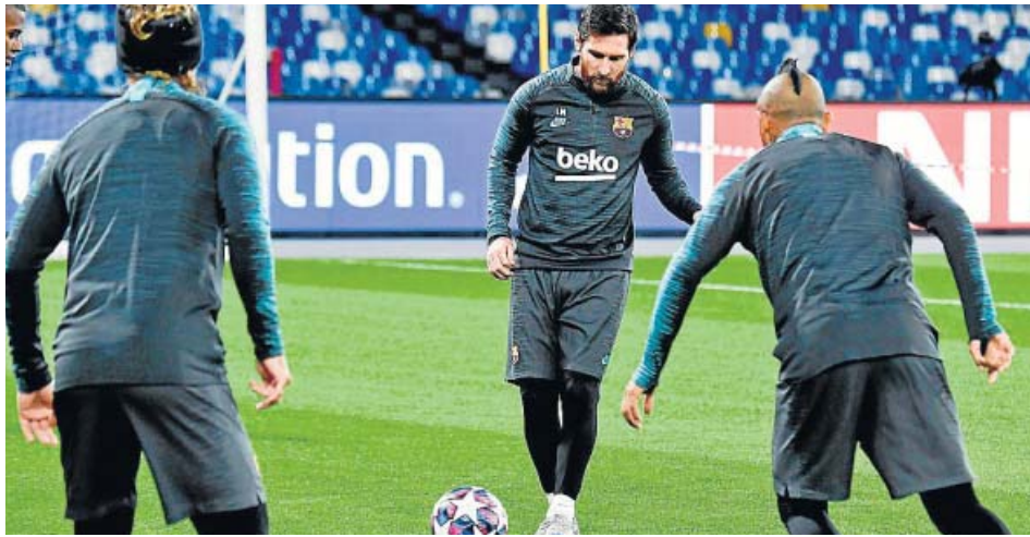
Leo Messi entrenándose en San Paolo con sus compañeros.