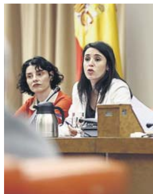
Irene Montero, ayer, durante la Comisión de Igualdad.

Con la ley LGTBI, lo que el departamento de Igualdad perseguirá será acabar con el estigma, la discriminación y las violencias que sufre este colectivo.