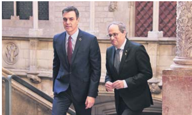
Pedro Sánchez y Quim Torra, el pasado 6 de febrero en el Palau de la Generalitat.

Además, el president dejó claro que quien debería acudir por