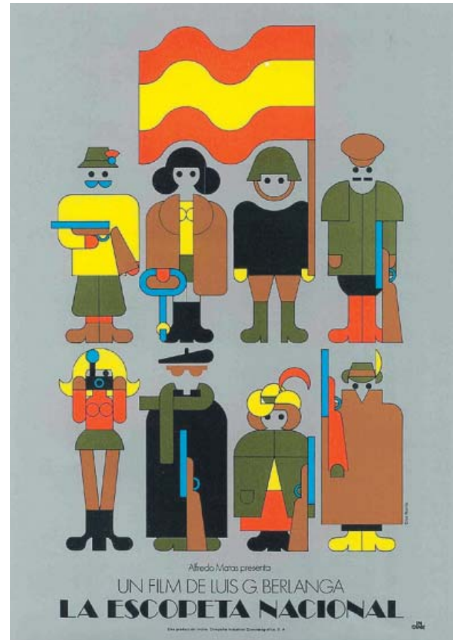
Fotograma del documental en el que aparece el diseñador; debajo, cartel de La escopeta nacional . LLANERO FILMS Y CRUZ NOVILLO