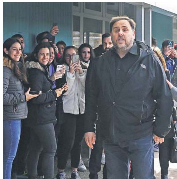
Los estudiantes fotografiaron a Junqueras a su llegada.