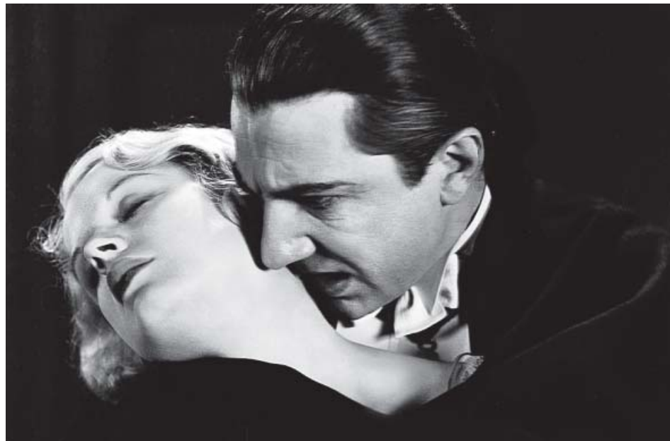
Béla Lugosi y Helen Chandler en Drácula (1931), de Tod Browning.

países arrasados por las guerras y las epidemias. Y en el siglo XVIII encontramos a pensadores ilustrados como Rousseau y Voltaire que teorizaban sobre su significado. Pero es a finales del siglo XIX, con la publicación de la novela Drácula (1897), de Bram Stoker, cuando se populariza la figura del vampiro moderno. Basada en dos personajes históricos —Vlad Tepes, el Empalador de Transilvania, y la húngara Erzsébet Báthory, 'la condesa sangrienta'—, en ella aparecen por primera vez elementos como las estacas o los ajos. Sin embargo, es el cine el que desarrolla el mito en todas sus facetas. Ya la película muda Nosferatu de Murnau (1922) contribuye a la propagación del mito. En la exposición pueden disfrutarse algunas de las escenas más famosas del conde más terrorífico y expresionista de principios del siglo XX. En la misma época destacó Theda Bara (1882-1956), la fa-