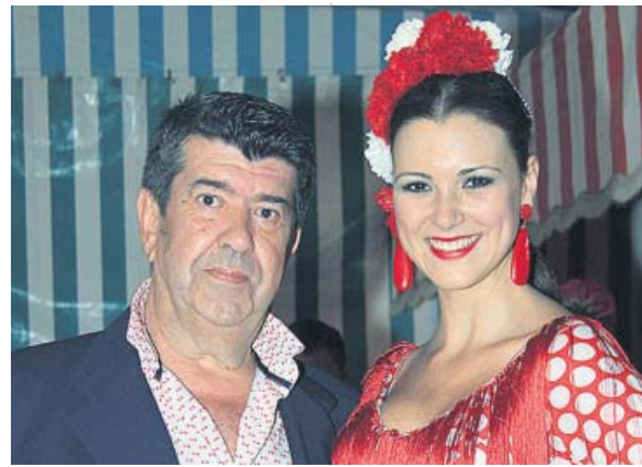
José María Gil Silgado y María Jesús Ruiz, en 2013.

El noviazgo con la maniquí hizo que todos los focos se encendieran sobre él. Tras la separación, la guerra entre ellos fue más que evi-