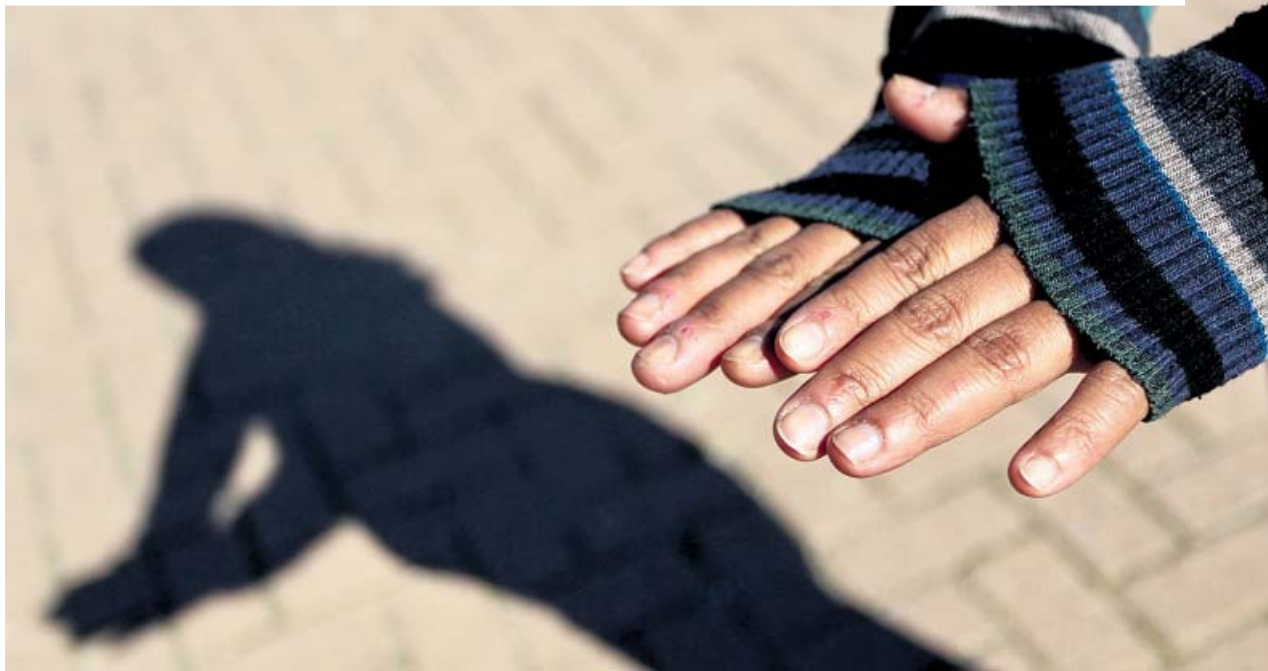
María muestra sus manos tras haber trabajado durante 14 años como interna en viviendas de clase alta en Madrid. JORGE PARÍS

Las 600.000 trabajadoras de este sector no tienen derecho a paro y su despido es más barato que el del resto de asalariados