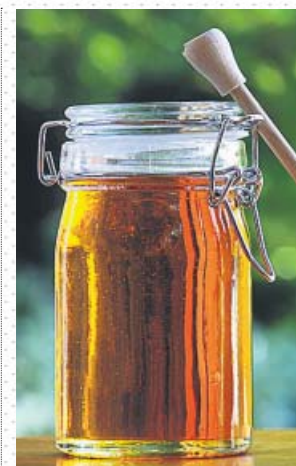
Sustitutivo de la miel no hecho por abejas. BEE APPROVED

Esa es la propuesta de Bee Approved, una compañía inglesa que elabora esta especie de miel vegetal a base de sirope de arroz integral y que, según sus creadores, sabe mejor que la miel real. ¿Usos? Los mismos que la miel, tanto