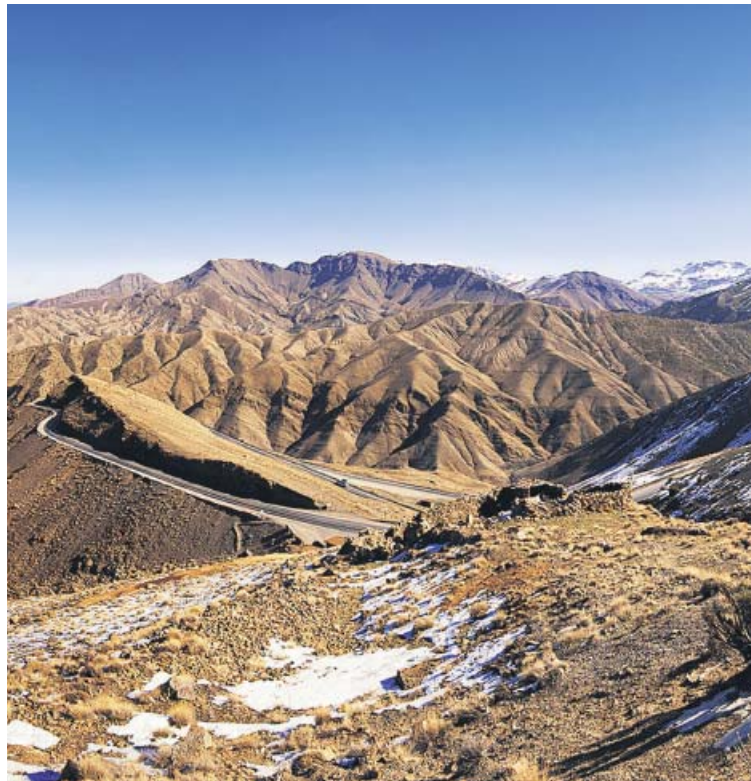
Los parques nacionales son la delicia de quienes recorren a pie el país.

Bordeando Marrakech se imponen las montañas del Atlas marroquí, una cor-