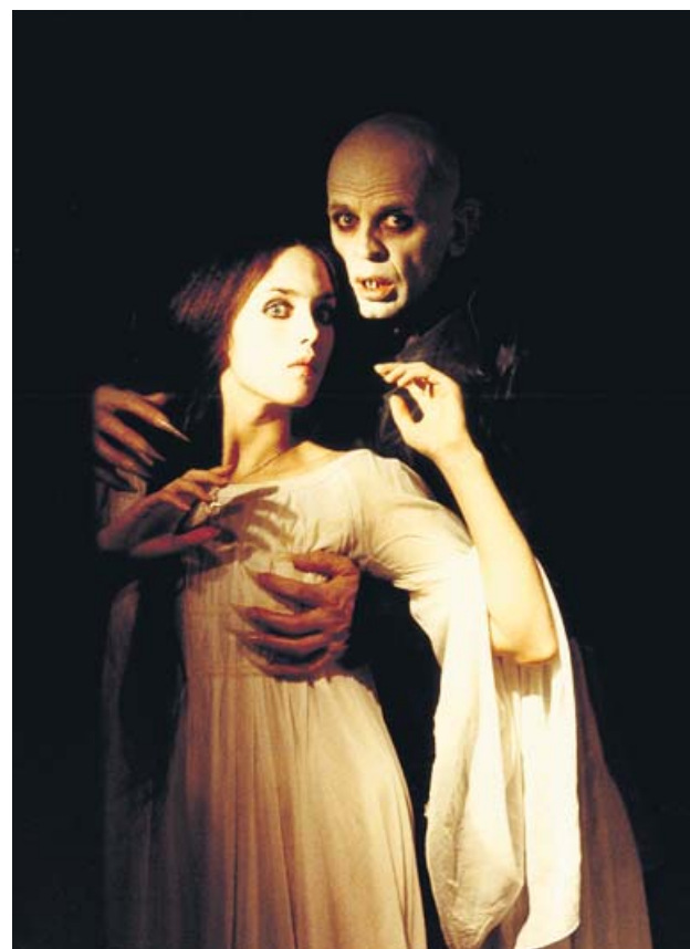
Isabel Adjani y Klaus Kinski en Nosferatu (1979).