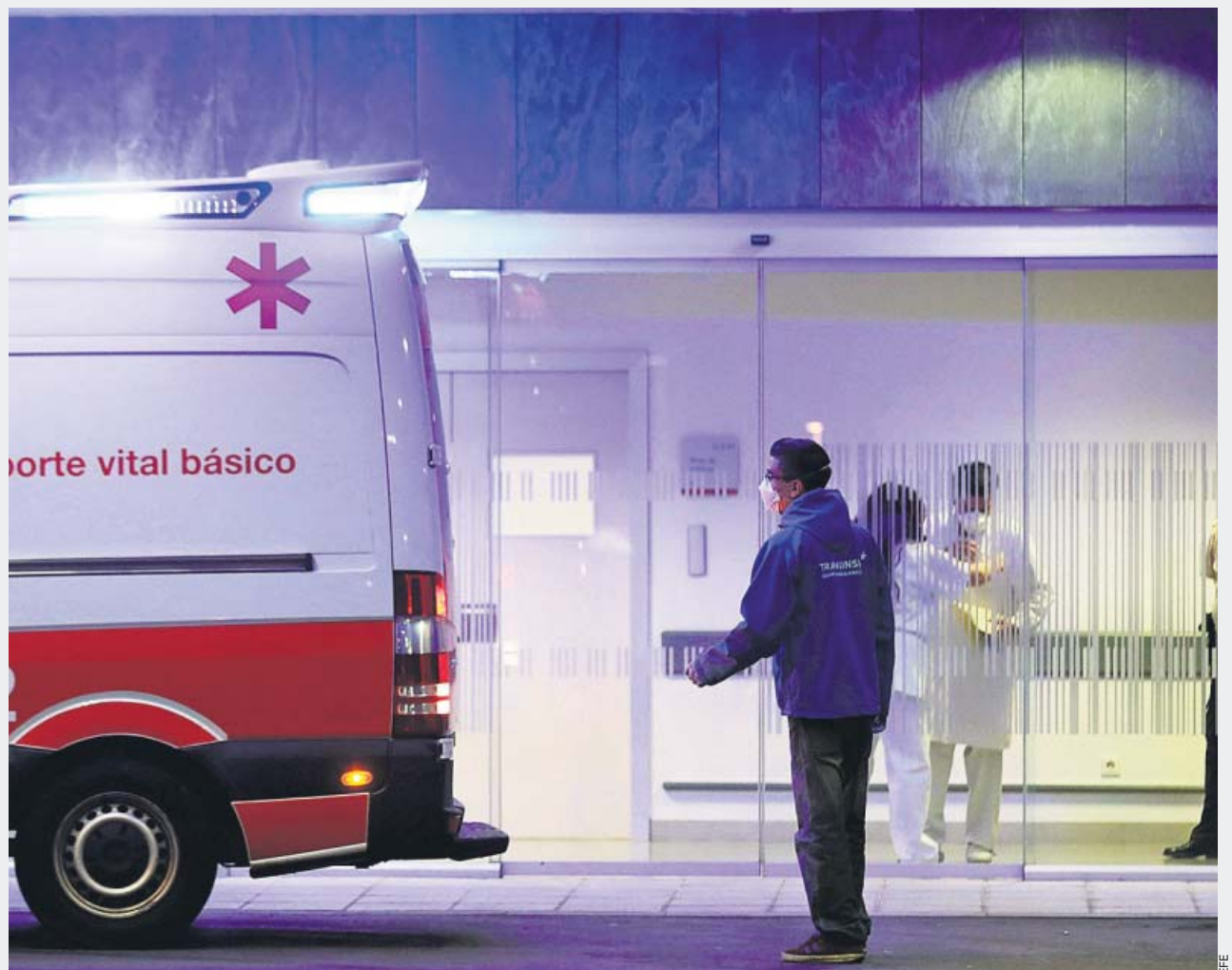
El segundo paciente infectado por coronavirus en Asturias llegó ayer en ambulancia al Hospital Universitario Central de Asturias.