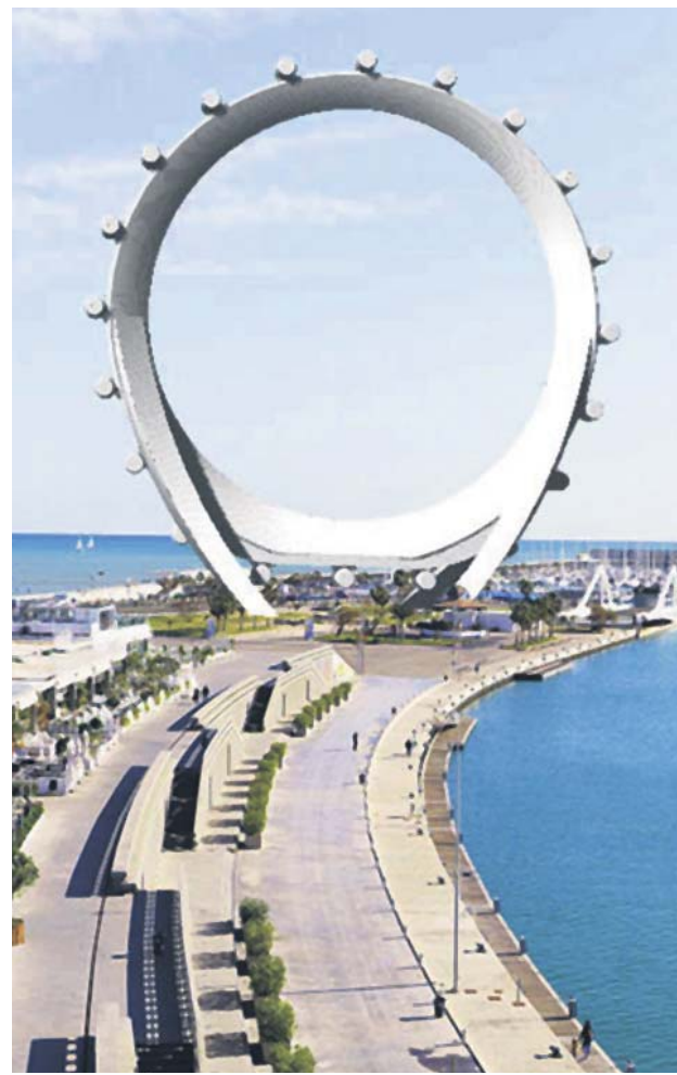
El proyecto que fracasó en Valencia. CIRCULAR VIEW

«Te has quedado corta en tu lucha contra el Populismo, todavía puedes promover: Circuito urbano de Fórmula 1; la visita del Papá. No olvides decir: 'No costará ni un euro a los madrileños'. @VicentMarza