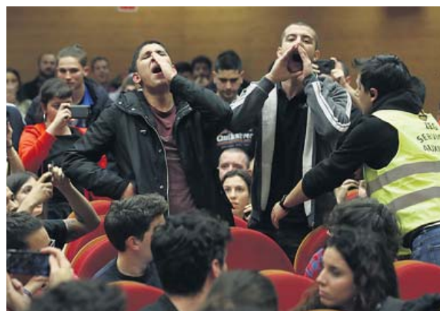
Dos de los militantes de Frente Obrero autores del escrache.

No obstante, el grupo —el mismo que hace un año realizó otro escrache contra Íñigo Errejón— se marchó, aunque antes uno de sus miembros acusó a Iglesias de no ir «a la raíz del problema, el capitalismo» y de ser responsable del «auge» del fascismo. ● DANIEL RÍOS