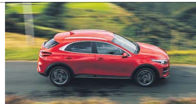
La autonomía en modo eléctrico llega a los 58 kilómetros.

Ya se pueden hacer pedidos del nuevo XCeed híbrido enchufable, modelo que Kia pone a la venta desde 26.150 euros. Este atractivo SUV dispone de una batería de 8,9 kWh, un motor eléctrico de 44,5 kW y otro de gasolina de 1,6 litros para ofrecer un total de 141 CV de potencia. La autonomía en modo totalmente eléctrico es de 58 kilómetros y dispone de la etiqueta «0» de la DGT.