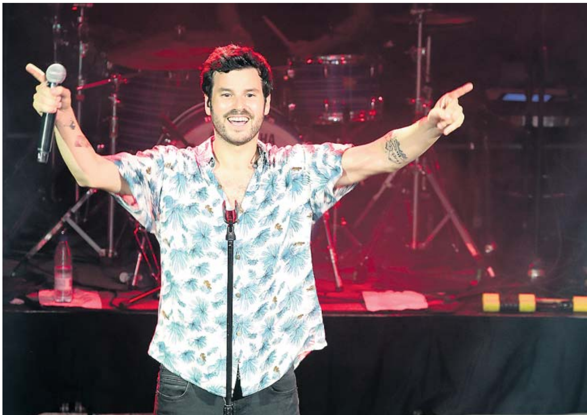
El cantante Guillermo Willy Bárcenas durante un concierto de Taburete en Madrid.