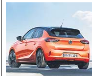
El nuevo Corsa-e se suma a la moda de los eléctricos.

Para cargar la batería, Opel ofrece de serie un cargador interno de 7,4 kW y otro opcional de 11 kW que es el recomendable para que los tiempos