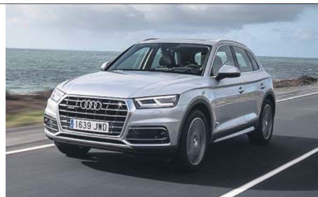
Este modelo es eficiente sin renunciar a interesantes prestaciones.

La marca de los cuatro aros ofrece esta versión como modelo de acceso a la gama Q5. Con tracción delantera y provisto de un contundente motor diésel asociado a un sistema de hibridación ligera (Mild Hybrid) de 12 voltios, entra por la puerta grande dentro de la categoría Eco, lo que le permite evitar una serie de restricciones de uso en el centro de las grandes ciudades. Con los 163 CV del remozado propulsor, las presen-