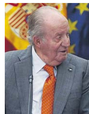
El rey Juan Carlos I, en una imagen de archivo.

Por otro lado, el Código Civil refleja que no se puede renunciar legalmente a una herencia paterna en vida, solo se