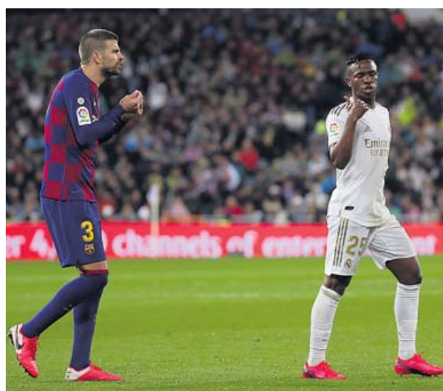
¿Un Barça campeón si la Liga no acaba? Hoy, día clave.

La realidad en estos momentos es que la pandemia se ha agravado y nadie sabe a ciencia cierta cuándo volve-