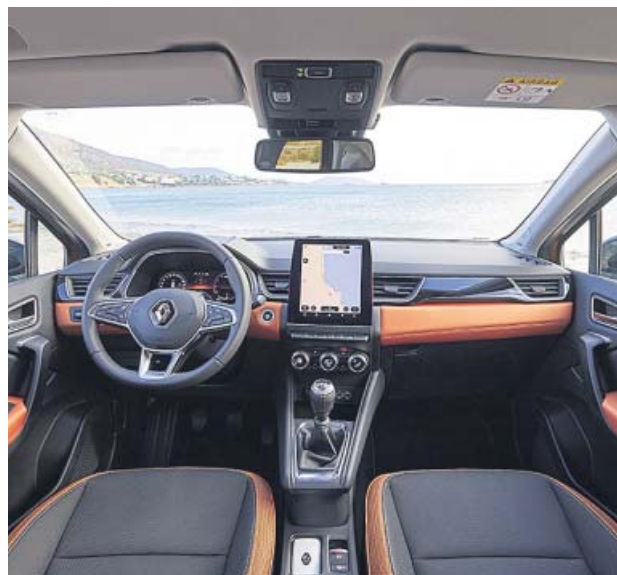
La gran pantalla central preside el salpicadero bicolor.

Por dentro, los acabados son de calidad y el diseño es sencillo, con gran peso de la enorme pantalla central (la de 9,3