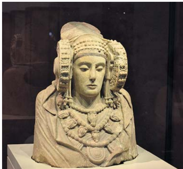
La Dama de Elche (v-iv a. C.), en el MAN.

La salida de una pieza del Museo Arqueológico, «cualquiera que sea su destino», explica el Gobierno, debe contar «con autorización del Patronato», que valora su estado de conservación y su papel en el montaje del centro, entre otras cosas. ●