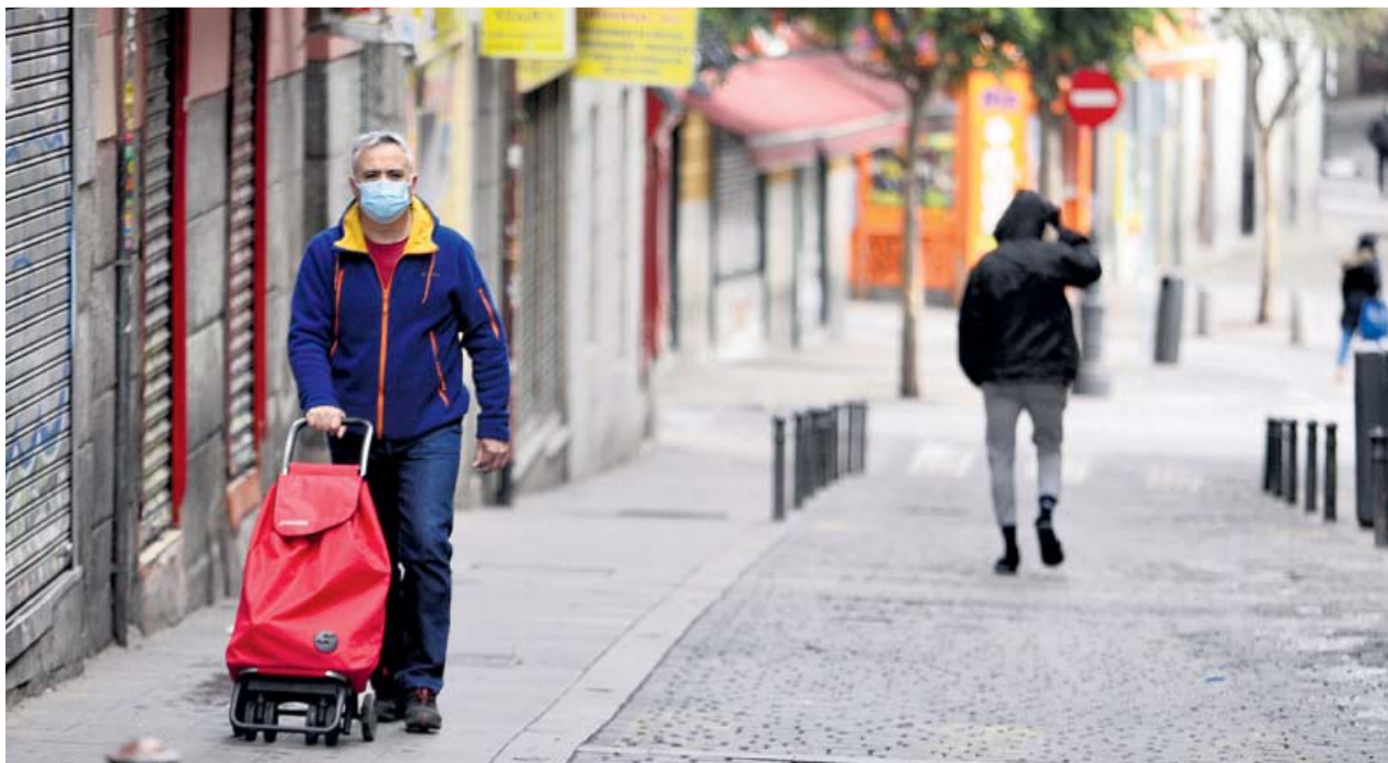
Un hombre camina con mascarilla y su carro de la compra por el barrio madrileño de Lavapiés.

Los inquilinos no quedan cubiertos por la medida. El Estado prohibirá de forma temporal cortar la luz, el agua y el gas a familias vulnerables, y también los desahucios