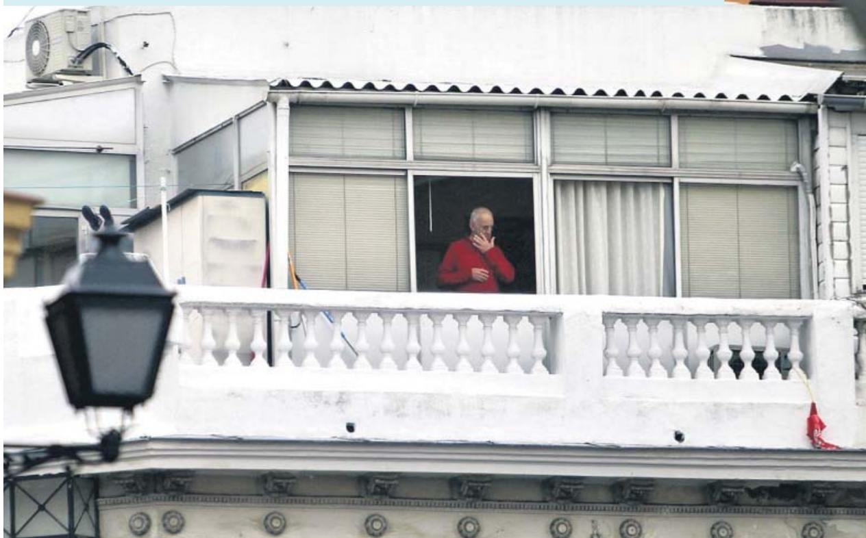
Un anciano asomado a la ventana de su casa durante la cuarentena por la epidemia del coronavirus en Madrid. JORGE PARIS