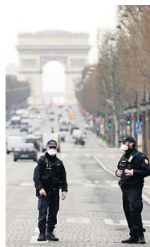
Gendarmes franceses, ayer en los Campos Elíseos de París.

Boris Johnson ha tardado en tomar medidas, pero lo ha hecho. El primer ministro británico ya ha pedido a los ciudadanos que mantengan «distancia» res-