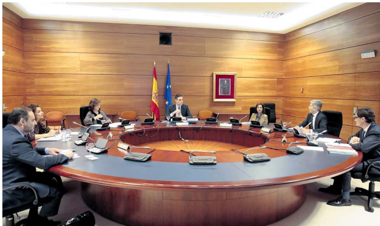
El presidente Sánchez junto a la vicepresidenta Calvo, la ministra de Hacienda y los ministros que forman el gabinete de crisis.

El Gobierno pretende que esos fondos se movilicen «lo más pronto posible», y Sánchez apela también a la fortaleza de la sociedad: «Se trata de un esfuerzo enorme, decidido, que responde a la magnitud del reto y al compromiso del Ejecuti-