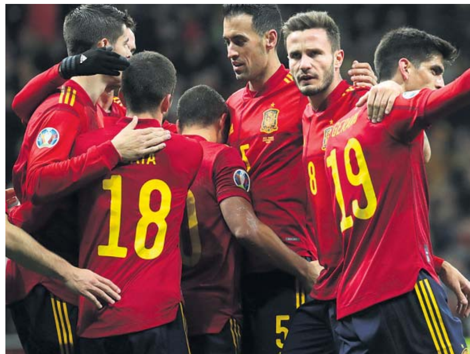
No habrá partidos de la selección este verano tras el aplazamiento de la Eurocopa.

«Consideramos una injusticia terminar con la clasificación como está ahora. Sería una tremenda injusticia. Es casi imposible asegurar que la clasificación que hay ahora será la misma que a final de temporada. Otros hablaban de dar por nula toda la temporada. Vamos a defender que no. El tercer escenario era retrotraer-