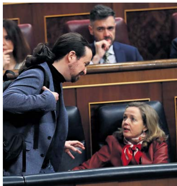
Los vicepresidentes Iglesias y Calviño, en el Congreso.

Pero lo cierto es que en el plan puesto en marcha no figuran algunas de las medidas señeras de los morados. Para empezar, Unidas Podemos apostaba por que la moratoria decretada para el pago de las hipotecas de las familias en si-