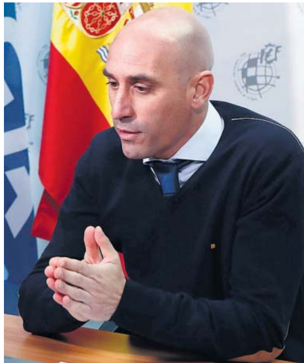
Luis Rubiales en la rueda de prensa telemática de ayer.

Sobre cuándo acabará la temporada, la postura de la RFEF es clara: hay que acabar la aunque sea bien entrado el verano. «Una temporada que