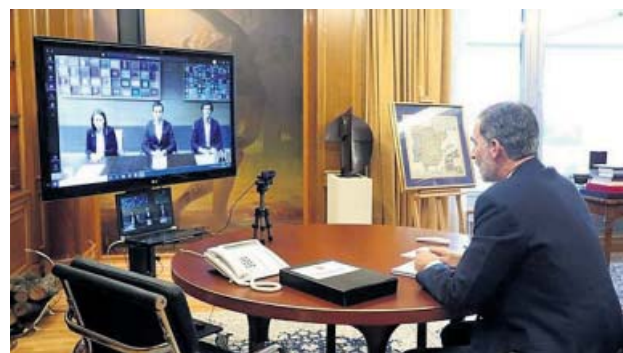
Felipe VI en la videoconferencia con Mercamadrid.

Dio las gracias «a todos los sectores productivos que permiten la continuidad del funcionamiento básico del país» y lanzó un «mensaje de ánimo, fortaleza y unidad a todos». ●