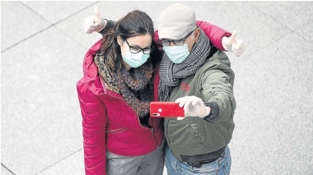
Una pareja protegida con mascarillas se hace un selfi en Madrid en plena crisis del coronavirus.