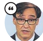
SALVADOR ILLA Ministro de Sanidad

«Lo que detectamos la tarde noche del día 8 de marzo quiere decir que se produjo ocho o diez días antes»