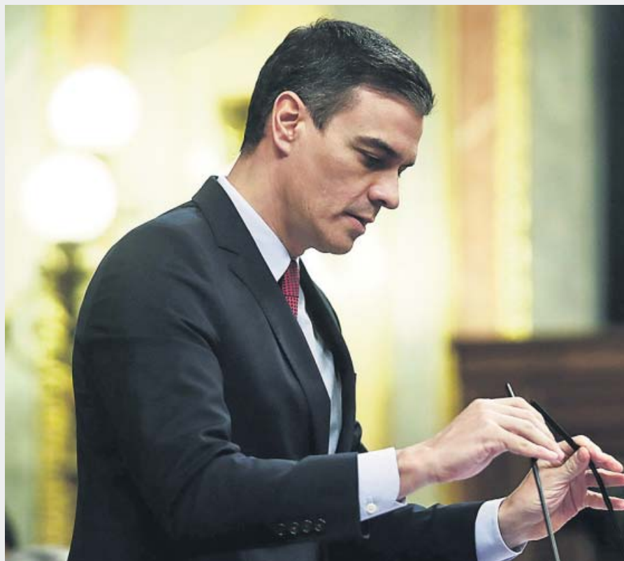
El presidente del Gobierno, Pedro Sánchez, en el Congreso.