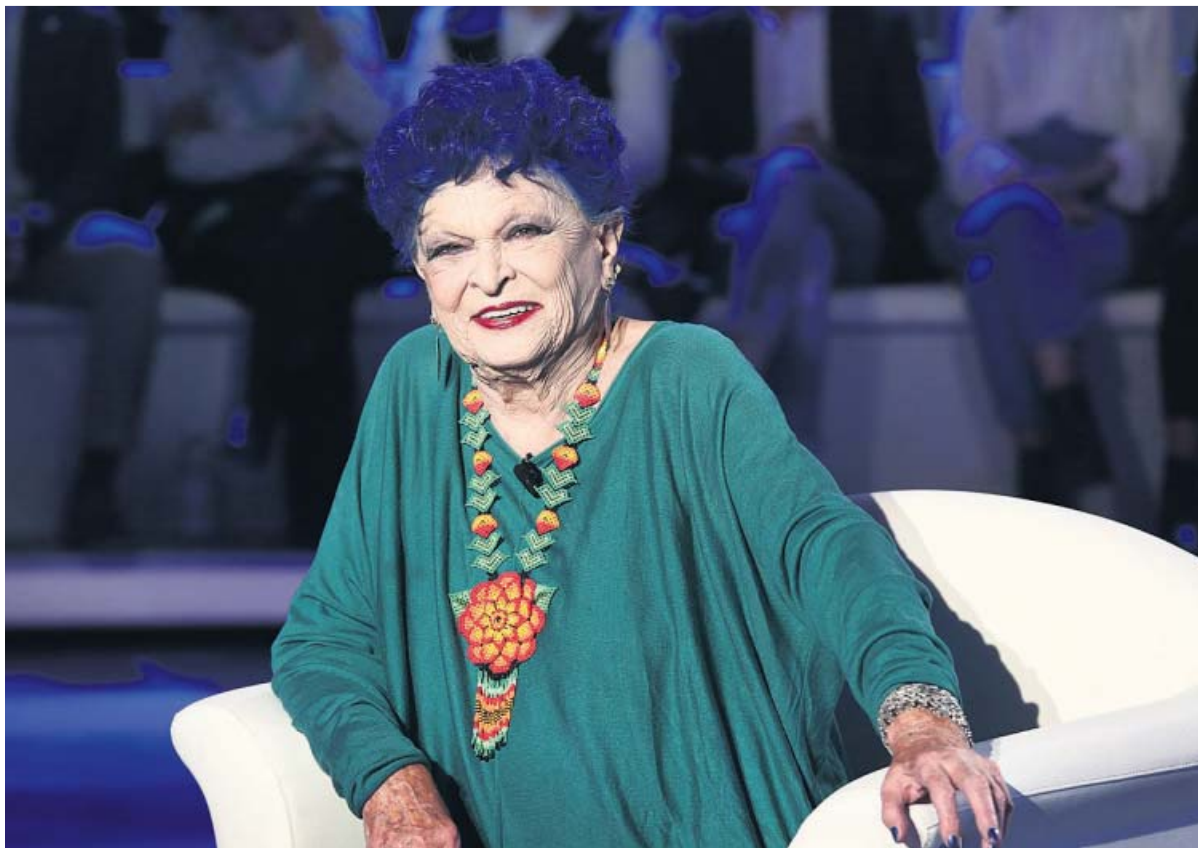
Lucía Bosé durante un programa de televisión italiano en octubre de 2019.