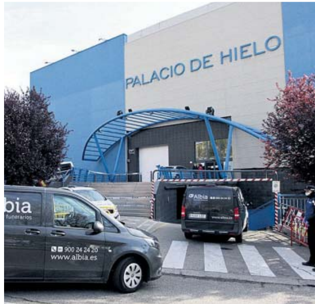
Furgones funerarios entrando en el Palacio de Hielo.

Pese a haber encontrado una solución de urgencia al problema, el equipo de Almeida volvió ayer a denunciar que el material sanitario «sigue siendo muy limitado: trajes de buzo, guantes, gafas... siguen escaseando». Este fue, de hecho, el motivo que llevó al regidor a reclamar ayudas al Gobierno; y, a falta de respuesta, a comprar nuevo material, por cuenta del Consistorio, por una cuantía de nueve millones de euros, destinados a cubrir las necesidades de todo