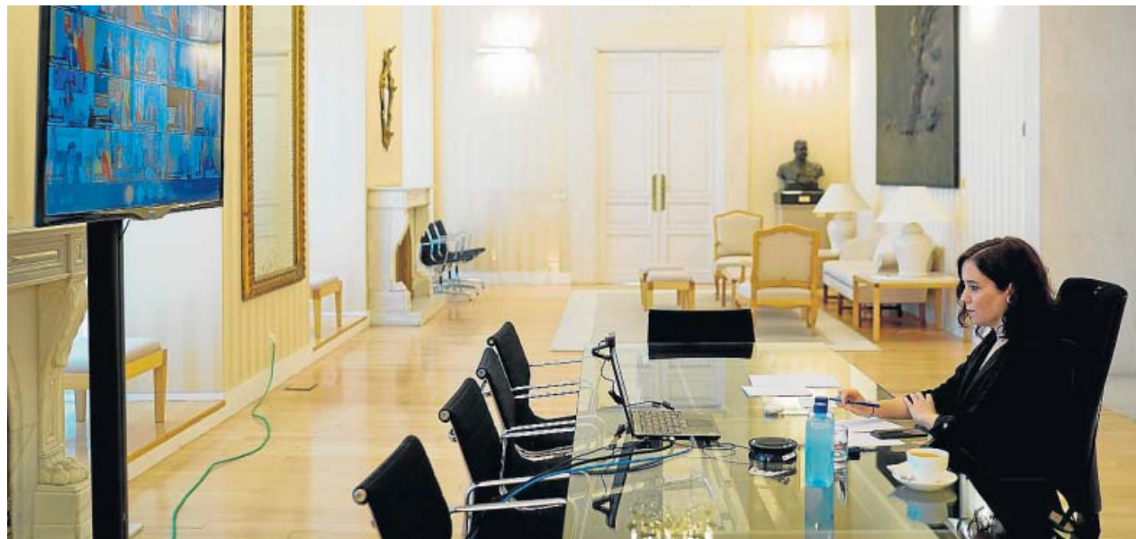
La presidenta de la Comunidad de Madrid, Díaz Ayuso, durante la videoconferencia que mantuvo Sánchez con las CCAA.