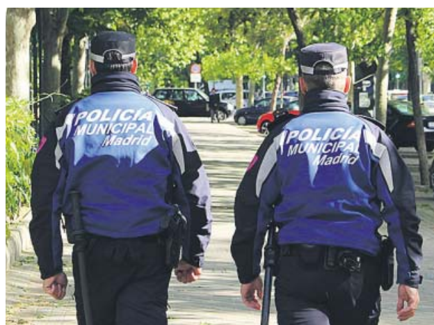
Dos agentes de la Policía Municipal de Madrid.

Los grupos que estaban de botellón no eran muy gran-