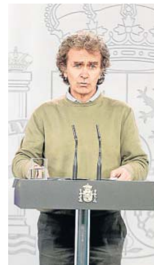
El doctor Fernando Simón en la rueda de prensa.

En esta línea de no dejar cabos sueltos ante posibles rebro-