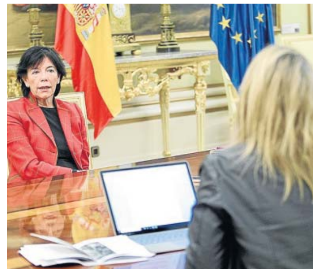
La ministra de Educación y FP, Isabel Celaá. JORGE PARÍS

Hablan de mantenerlos para alumnado 'muy especial'. ¿Está ahí el matiz? La ley está en tramitación, tiene un plazo de enmiendas donde se verá si es 'muy' o no. Quiero tranquilizar, pero no es óbice para que el resto de centros progresen en tener más medios. ●