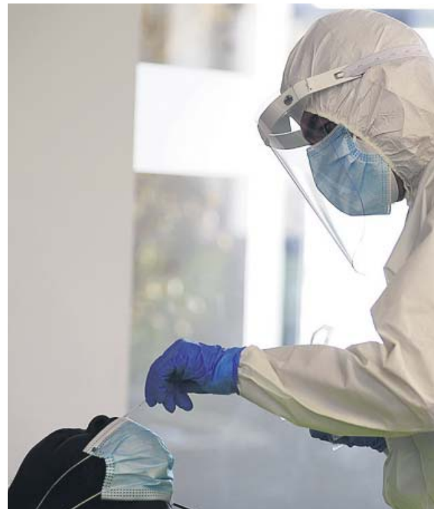
Un sanitario extrae una muestra para un test.

Ayer se informó de 164 nuevas muertes. Para encontrar una cifra diaria más baja hay que remontarse al pasado 18 de marzo, cuando se registraron 94. El dato de nuevos contagios es incluso inferior al de días anteriores al estado de alarma. Ayer se confirmaron 838 nuevos casos a través de pruebas PCR. El día que entró en vigor el primer