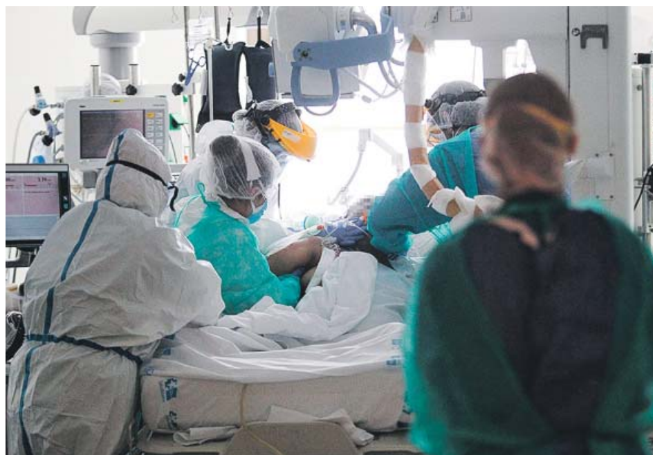
Sanitarios tratando a un paciente en la UCI del hospital Ramón y Cajal de Madrid.

DIRECTOS CONTRA EL VIRUS. Son terapias pensadas para pacientes moderados. Actúan inhibiendo la replicación de las