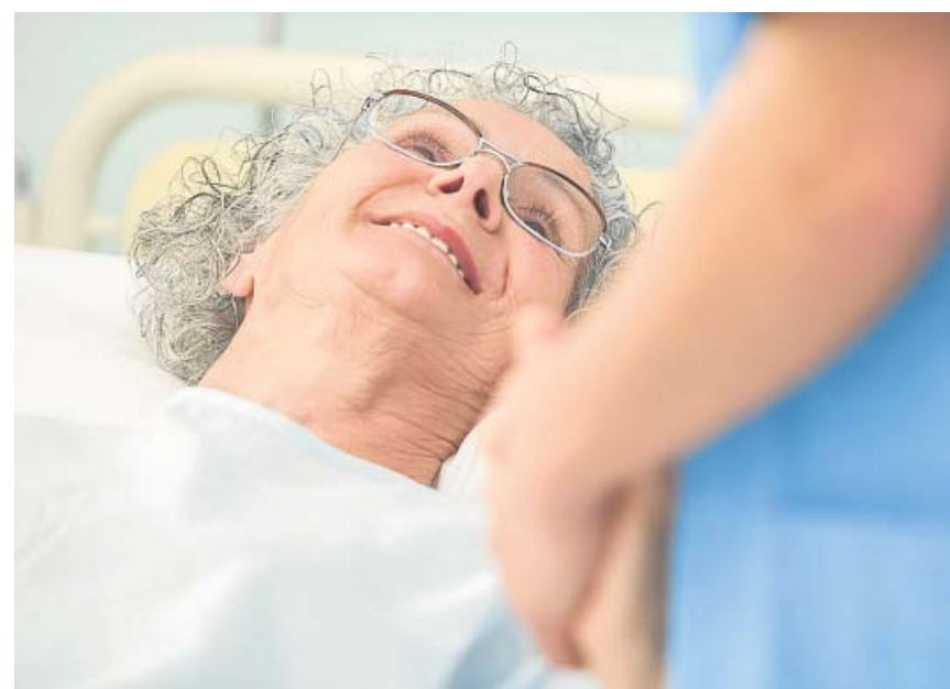
Los hospitales están preparados para atender con seguridad a los pacientes.

Cataluña (132 contagios, 35 muertes y 1.566 recuperados en el último día) es a día de hoy la comunidad con mayor incidencia. Madrid (1 contagio, 44 muertes y 104 curados en un día), sigue a la baja, aunque sus casos confirmados diarios reales se notifican con retraso. Valencia (ningún contagio, 5 muertes y 59 recuperados) se sitúa como una de las comunidades mejor posicionadas para iniciar la desescalada. ●