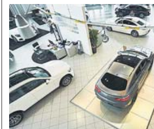
El sector acumula unas pérdidas del 95%.

Esta asociación estima que esta semana será de transición hasta retomar la activi-