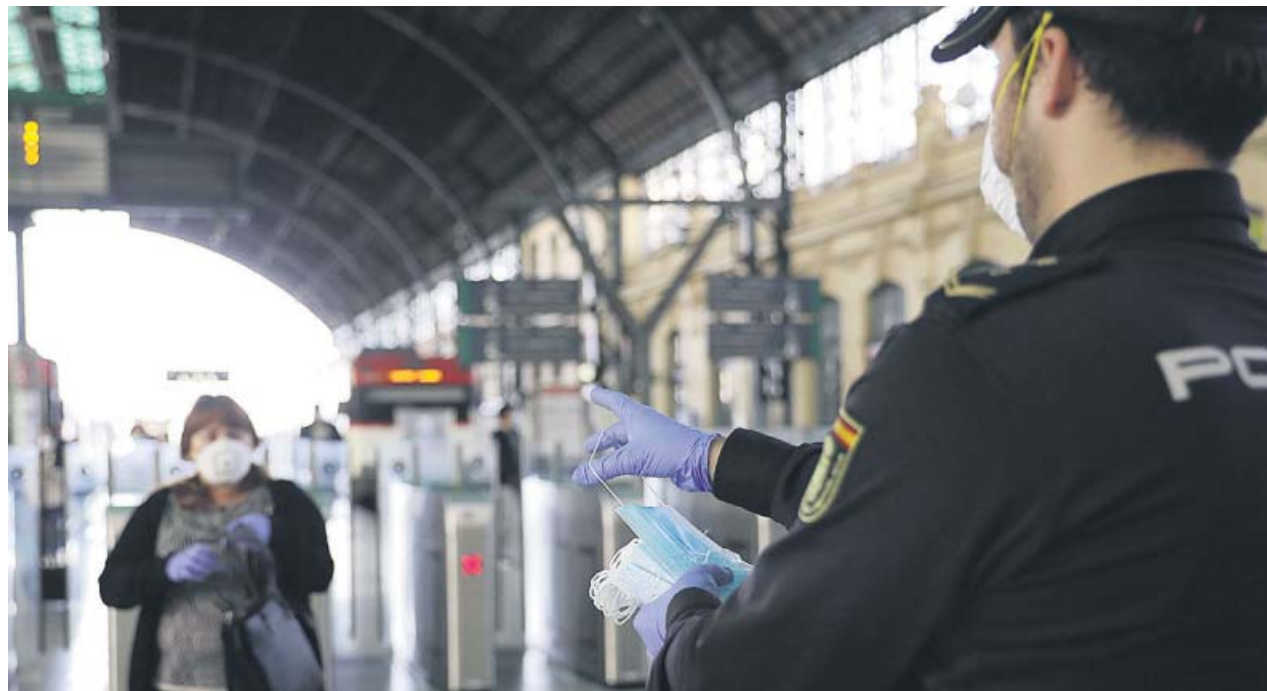
Un agente de la Policía Nacional reparte mascarillas y comprueba a una usuaria en la estación de ferrocarril de Valencia.

Dirigiéndose «especialmente al PP», Ábalos dijo que «tendrán que responder ante los ciudadanos si se produce un repunte de los contagios». Fue especialmente duro con la postura popular. «No aprobar un nuevo decreto de alarma es tanto como condenarnos a un caos del