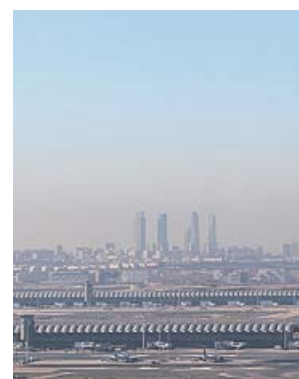
La boina de contaminación de Madrid en enero. JORGE PARÍS

En la ciudad de Madrid el descenso fue del 59% entre el 14 de marzo y el 30 de abril. Con esta reducción ha conseguido, por primera vez desde 2010, no rebasar los límites legales de emisión de este contaminante. Lo mismo ha sucedi-