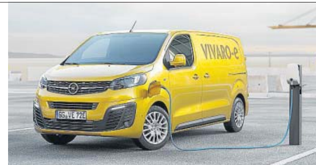
El Vivaro-e puede recorrer hasta 330 kilómetros sin recarga.

Con 136 CV de potencia, se puede elegir entre dos tipos de batería: una de 75 kWh, con una autonomía de hasta 330 kilómetros (según el ciclo de homologación WLTP), y otra de 50 kWh, con la que se es-