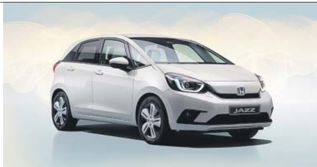
Este modelo llegará al mercado en verano.

Su objetivo es reducir la probabilidad de que los ocupantes sufran lesiones en la cabeza y en el pecho en caso