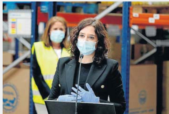
La presidenta Isabel Díaz Ayuso, ayer.

Actividad en mayo, pero bares y turistas en diciembre.