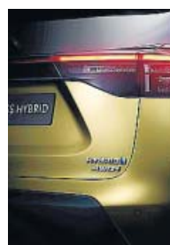
Detalle de la trasera, con la firma 'Hybrid' y de la tracción total inteligente 'AWD-i'.