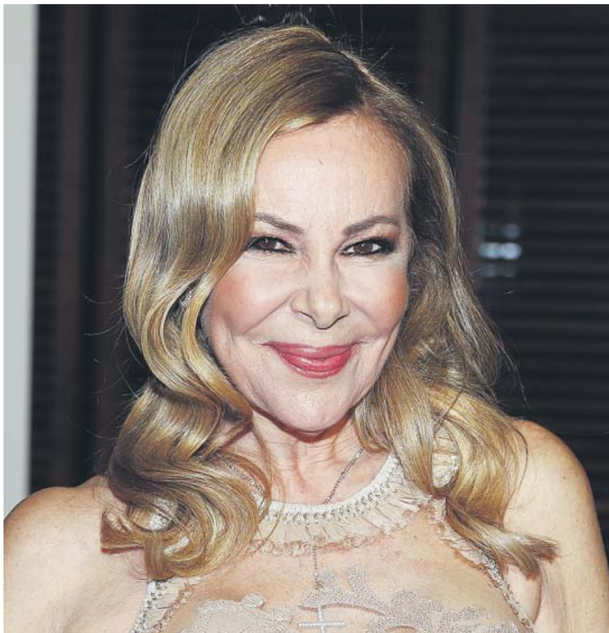
Ana Obregón, durante una entrega de premios en 2019.