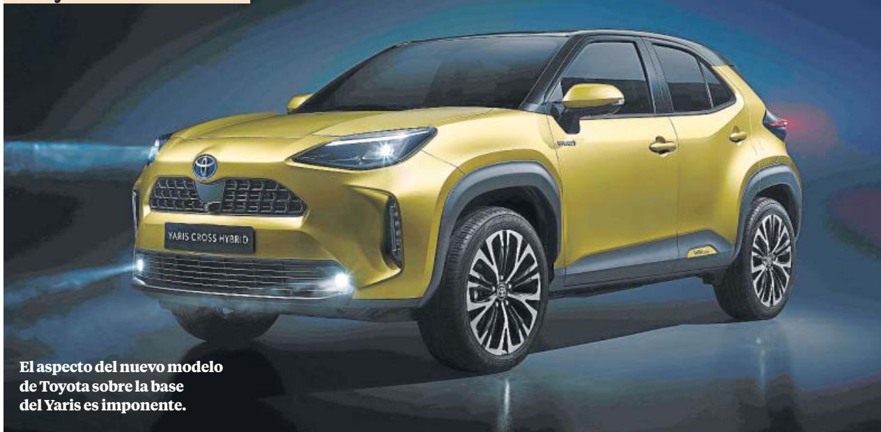
El aspecto del nuevo modelo de Toyota sobre la base del Yaris es imponente.