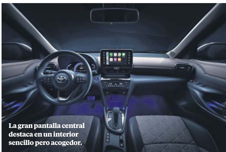
La gran pantalla central destaca en un interior sencillo pero acogedor.