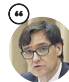
SALVADOR ILLA Ministro de Sanidad

«Es recomendable que los menores salgan a una hora en la que las temperaturas no son tan altas»