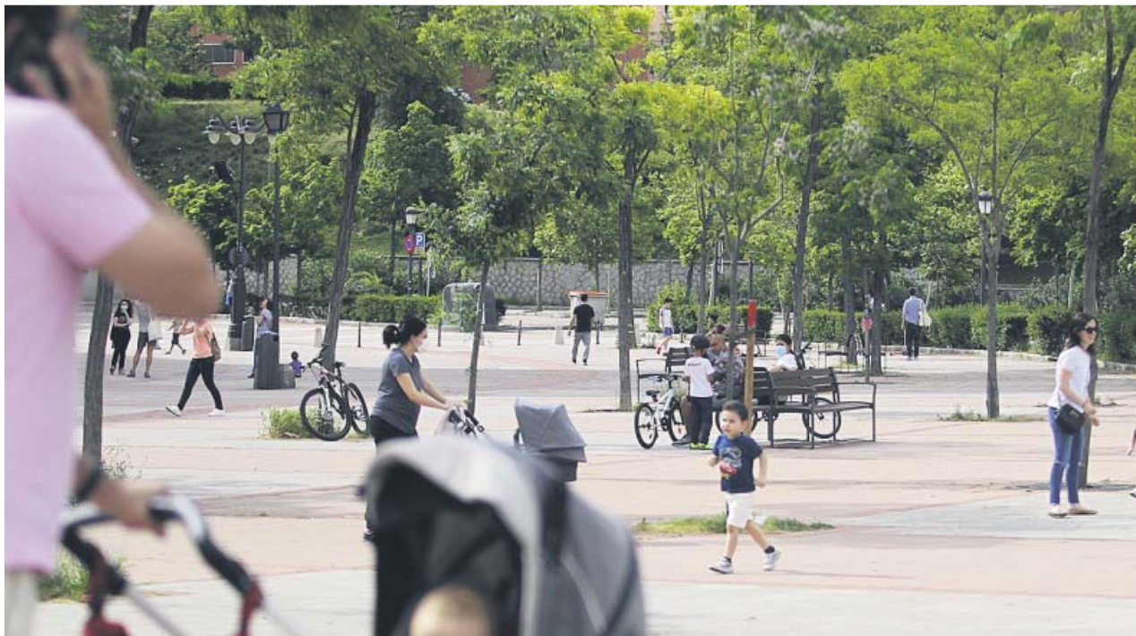
Niños jugando con sus madres y padres, durante la tarde de ayer en una plaza de Madrid.

DANIEL RÍOS daniel.rios@20minutos.es / @Dany_Rios13