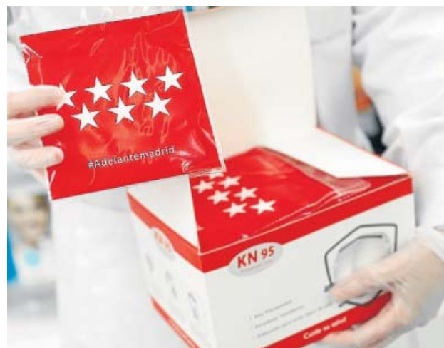
Podrán recogerse con la tarjeta sanitaria en las farmacias.

El Ejecutivo espera realizar un nuevo reparto en las próximas semanas, cuando llegue otra remesa de mascarillas. La idea es que cada madrileño tenga dos. Serán mascarillas autofiltrantes