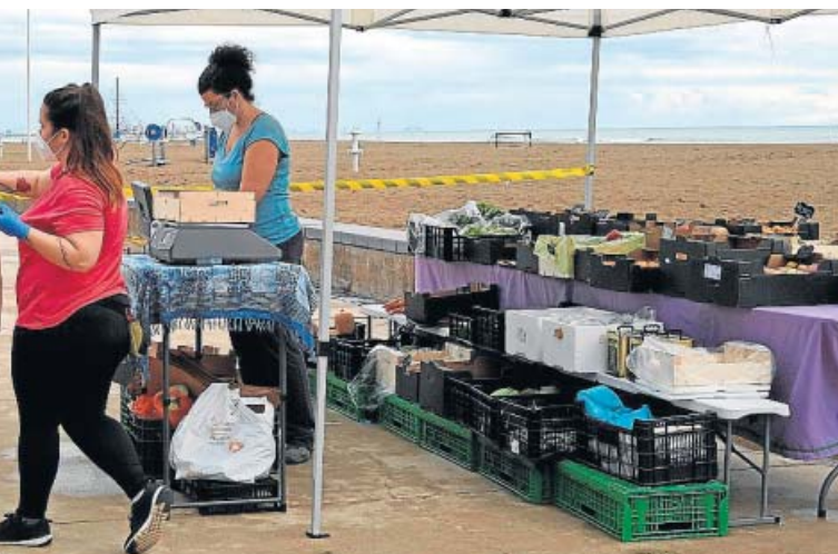
Valencia Puesto ambulante en La Malvarrosa