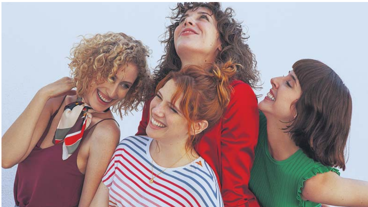
Las cuatro jóvenes protagonistas de la serie de Netflix Valeria . NETFLIX