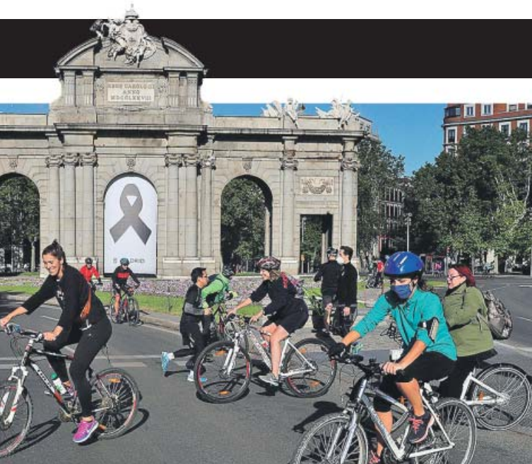
MADRID Las bicis toman un símbolo de la capital

Los deportistas de alto nivel y ligas profesionales volverán a entrenar, de forma individual, con un entrenador y sin público. ●