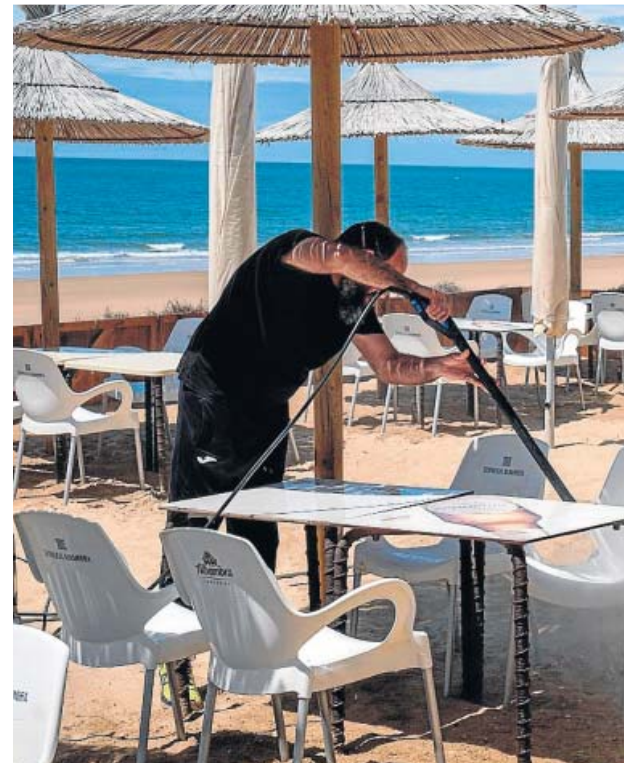
Un trabajador prepara una terraza en Punta Umbria, Huelva.