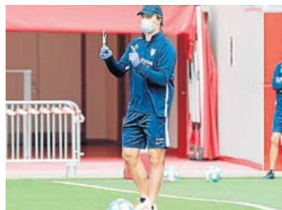
Julen Lopetegui dirigió ayer el segundo entrenamiento del Sevilla