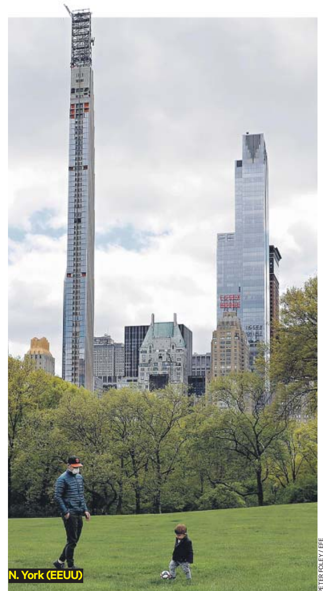
N. York (EEUU)