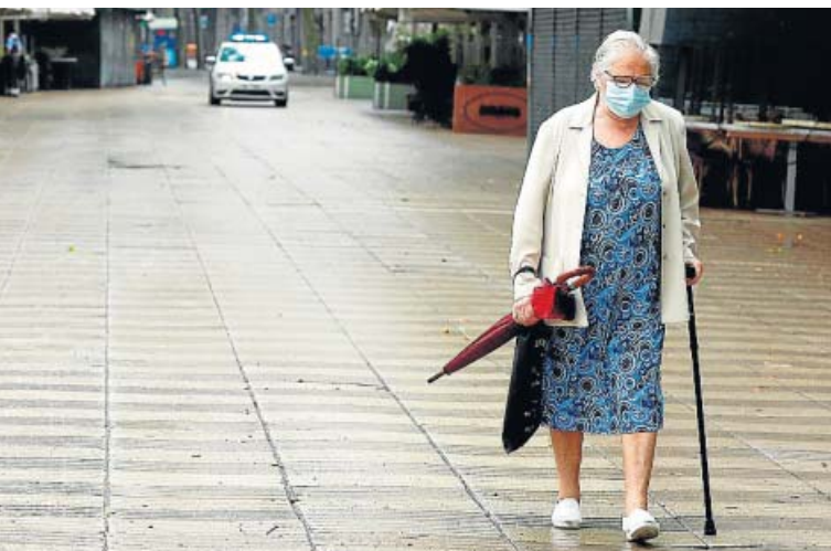
Barcelona Las Ramblas, casi vacías de visitantes