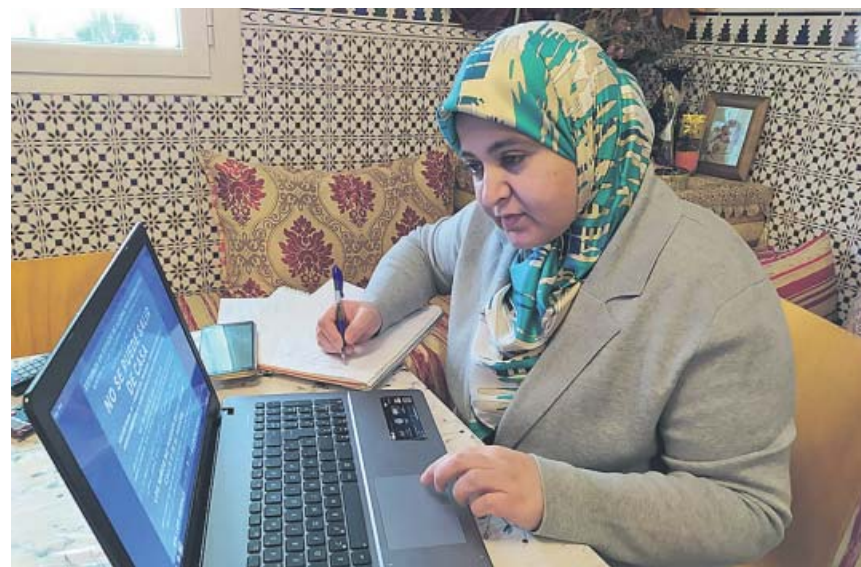
Una mujer que se beneficia del Proyecto ICI de Fundació La Caixa.

El Gobierno de Melilla ha decidido ampliar una hora la franja horaria de paseos por las noches, hasta las 00.00 horas a partir de este lunes 11 de mayo con la fase 1, para atender la demanda de la comunidad musulmana que hace el ayuno de Ramadán, para que después de comer por primera vez en toda la jornada, puedan pasear o hacer ejercicio físico.