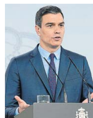
Imagen de Pedro Sánchez en rueda de prensa.

También generó polémica un estudio al que hizo mención el Gobierno y que parece que no existe. La CNN ha llegado a esta conclusión al seguir la pista del informe de la Universidad Johns Hopkins en el que se apoyó Sánchez para asegurar que España era el quinto país que más test había realizado. La cadena con-