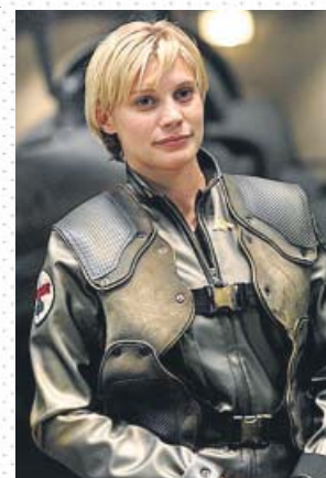
Katee Sackhoff, en su papel de Kara Starbuck.

Tan asfixiante como corresponde a una historia de refugiados y fugitivos, agraciada con figuras memorables (del coriáceo Adama -Edward James Olmos- a la presidenta Roslin -Mary McDonnell- y su realpolitik en el vacío), Battlestar Galactica es un cuento de criaturas y creadores centrado en la