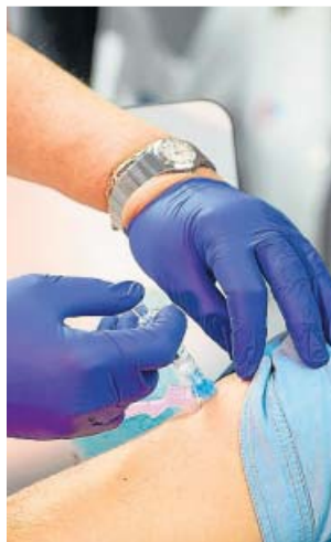
Una persona mientras se vacuna contra la gripe.

Hay que tener en cuenta que para que una vacuna llegue a las venas de la ciudadanía debe ir superando una serie de escalones: el desarrollo preclínico, que incluye pruebas en animales; la fase I, donde la vacuna se prueba en un grupo de entre 10 y 100 voluntarios sanos; la fase II, donde se am-