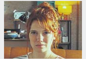
La actriz interpreta a Valeria en la serie de Netflix.

Diana Gómez «Yo hace un año estaba sin dinero y sin trabajo»