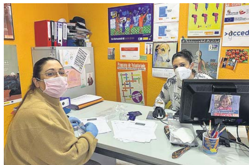
Mujeres que colaboran en el programa de ayudas de Fundación La Caixa.

20M.ES/CORONAVIRUS Para conocer las últimas noticias relacionadas con la epidemia en tiempo real visita 20minutos.es