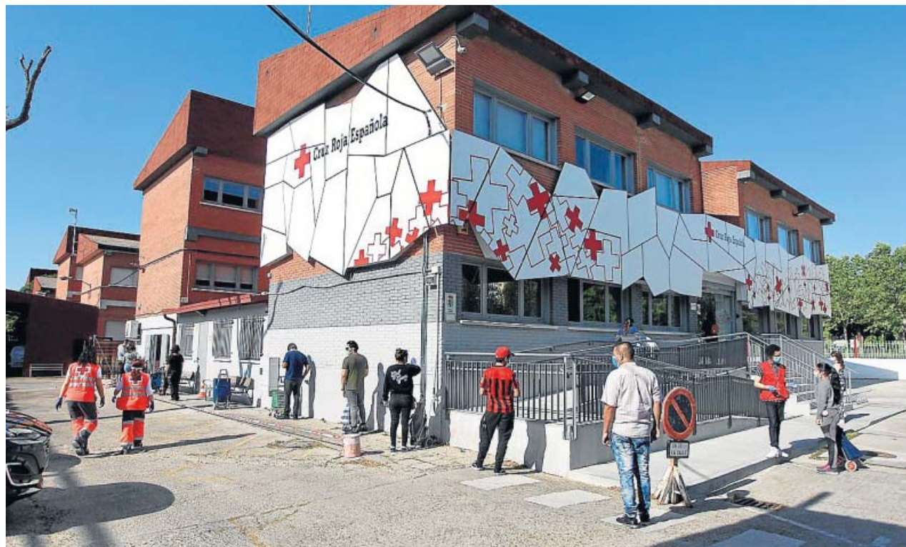
Vecinos de Getafe hacen cola ante el almacén de alimentos de la sede de Cruz Roja.