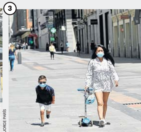
Las medidas de prevención seguirán

En el corto plazo, los viajes estarán orientados a los pueblos pequeños y las zonas rurales, por lo que las grandes urbes tardarán más en recuperar los flujos de viajeros de antes de la pandemia.