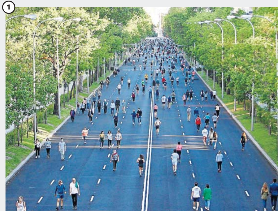
Adiós a las megaciudades: las distancias serán más cortas