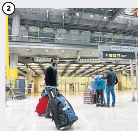
Un turismo de corta distancia