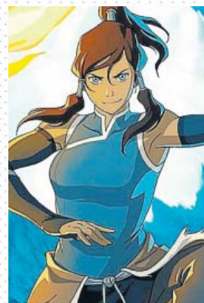
La protagonista de 'La leyenda de Korra'.