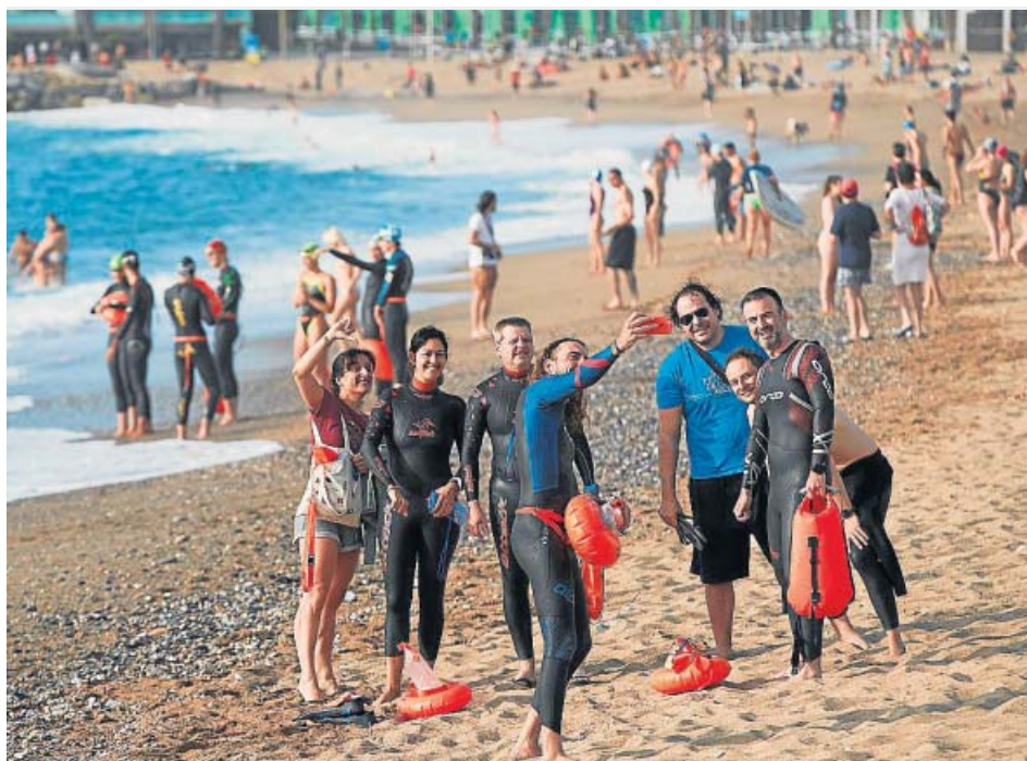
Un grupo de personas, ayer, en la playa de la Barceloneta.

La ministra explicó que el Gobierno pretende conseguir un