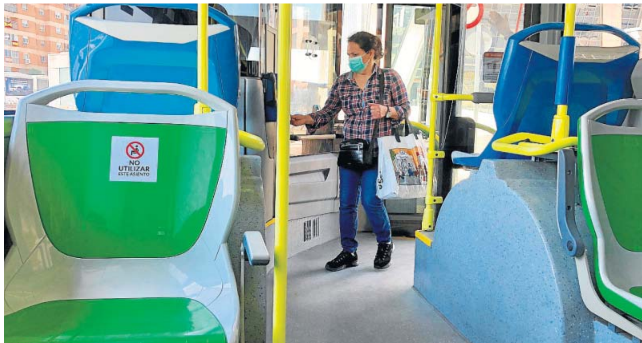
Los autobuses de la EMT guardan la distancia física entre viajeros marcando asientos donde está prohibido sentarse.

También mantendrán las medidas extraordinarias de limpieza y desinfección de sus autobuses. «Toda la flota se desinfecta diariamente en nuestros centros de operaciones mediante la técnica de nebulización con virucidas autorizados y prestando especial atención a las superficies de contacto», explica el servicio municipal. Aquellos madrileños que escojan este medio