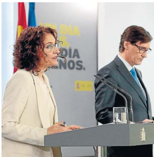
María Jesús Montero y Salvador Illa, en su comparecencia.

No obstante, algunos detalles ya han sido adelantados por el ministro de Seguridad Social, José Luis Escrivá, que