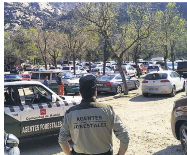
La Pedriza el pasado sábado 14 de marzo. 112 COMUNIDAD DE MADRID

Así, se refería al caso «concreto» de la utilización de espacios naturales, y en aplicación de la orden del Ministerio de Sanidad del 30 de abril, sobre las