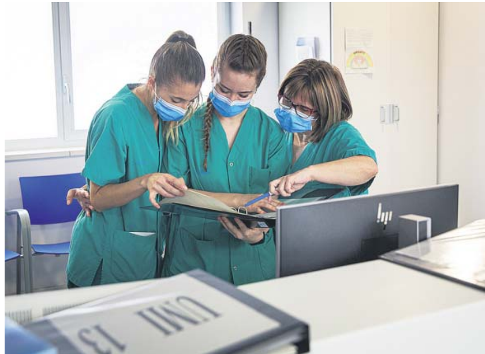
Personal sanitario en la unidad polivalente de críticos en el Hospital de Logroño.