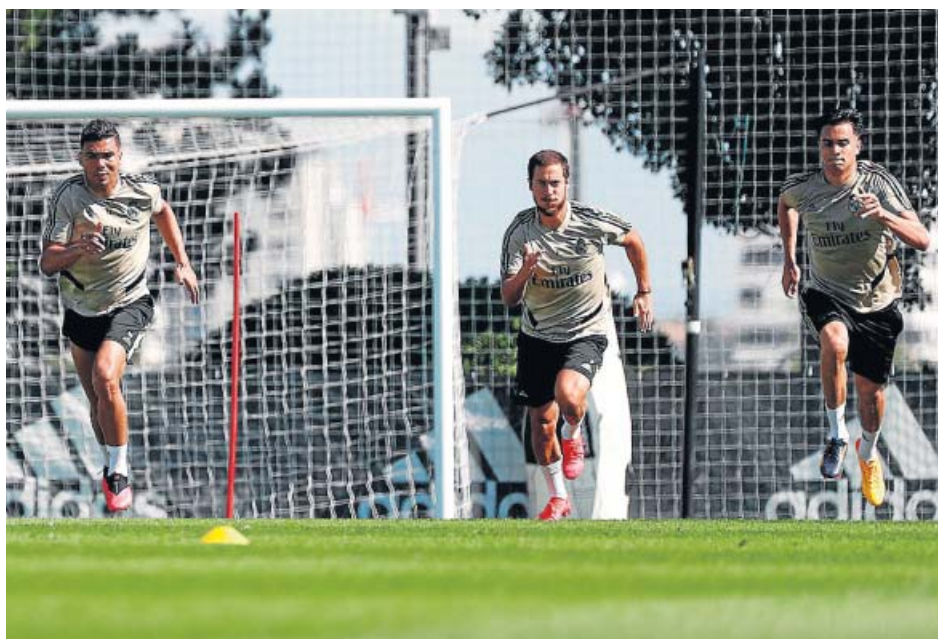
Los jugadores del Real Madrid tuvieron el fin de semana libre y hoy vuelven al trabajo.

20M.ES/DEPORTES Toda la información sobre cómo afecta el coronavirus al mundo del deporte, en nuestra web