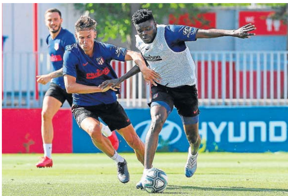
El Atlético entrenó el sábado, descansó ayer y hoy vuelve al trabajo.