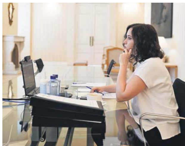
Isabel Díaz Ayuso, ayer, en la reunión de líderes autonómicos.

Así se lo trasladó ayer en la duodécima videoconferencia de presidentes autonómicos, en la que también insistió en reclamar un protocolo claro en el aeropuerto de Barajas de cara al control de llegada de los turistas procedentes de