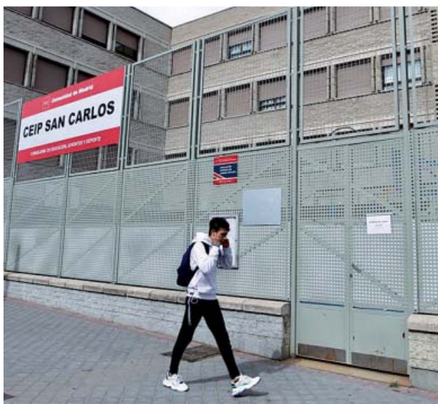
Un colegio de Villaverde (Madrid), en la mañana de ayer.