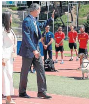
Los Reyes, ayer durante la visita al CAR.

Felipe VI lanzó este mensaje durante la visita que realizó junto a doña Letizia al centro de Alto Rendimiento del Consejo Superior de Deportes (CSD), su primer acto