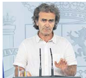
Fernando Simón.

En el mismo documento se dice que «no es posible saber