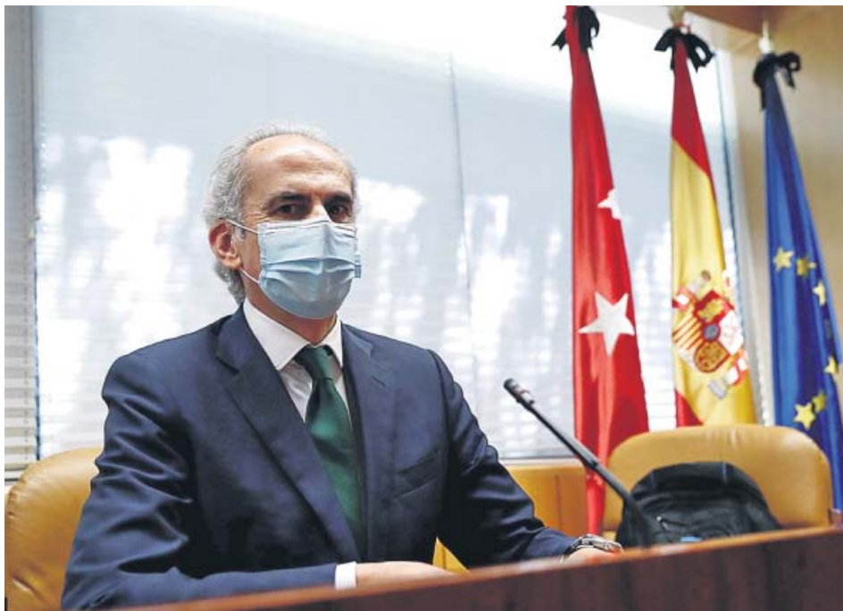
El consejero de Sanidad, Enrique Ruiz Escudero, durante una comisión en la Asamblea.

PSOE, Más Madrid, Unidas Podemos y los sindicatos exigen a la presidenta que destituya al consejero de Sanidad