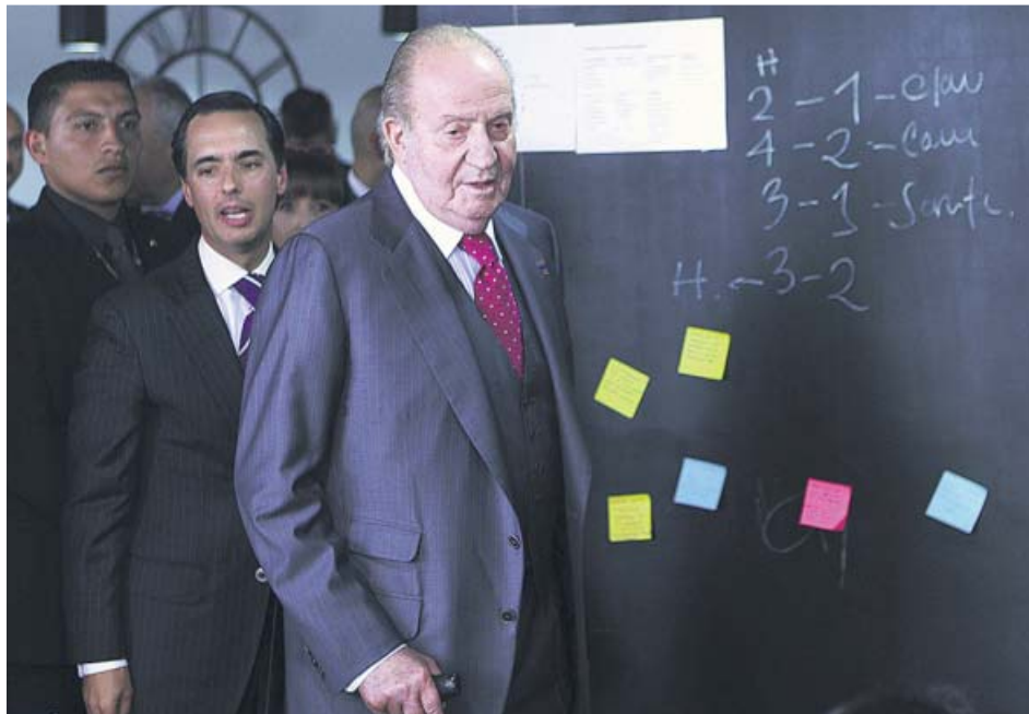
Juan Carlos I, ya emérito, llega a Colombia para asistir a la investidura del presidente Santos.

ADJUDICACIONES Se enmarca en la causa por el presunto cobro de comisiones por las obras del ferrocarril CALIFICACIÓN Tiene que decidir sobre la relevancia penal, pues son hechos posteriores a la abdicación