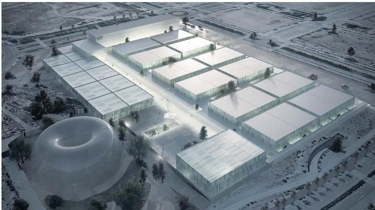
Recreación del futuro hospital de emergencias de Valdebebas, en los terrenos donde se proyectó la Ciudad de la Justicia.