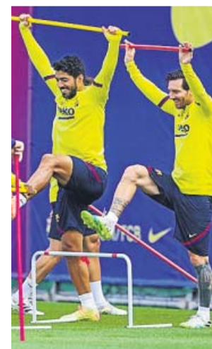
Messi ya se entrenó ayer con sus compañeros.

Al conjunto madridista le toca remontar, algo que en los últimos años no se le ha dado demasiado bien. En el global de las diez temporadas anteriores, el Barcelona ha sumado de media más puntos que el Real Madrid en las últimas 11 jornadas de Liga, las que faltan por jugar ahora, y en 7 de las 10 ediciones, el conjunto catalán ha acumulado más puntuación que el madri-