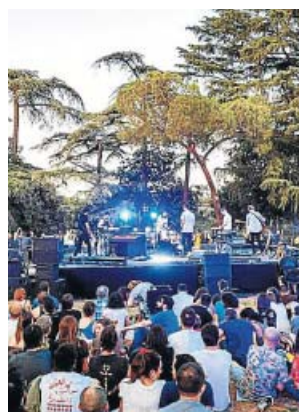
Vetusta Morla, en los Veranos de la Villa 2019.

Otro de los cambios será la duración del ciclo. Ya en abril, la concejala de Cultura,