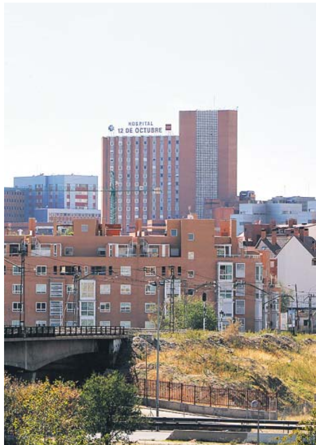
Hospital 12 de Octubre, en el distrito de Usera. JORGE PARÍS

inferior a una hora en total. Además, prestará servicio de lunes a domingo, dado que se trata de un proyecto que nace «como experiencia de prueba a consecuencia de la crisis sanitaria de la Covid-19, con la idea de acortar distancias y tiempo con origen y/o destino estos dos centros hospitalarios», indica el área de Medio Ambiente y Movilidad.