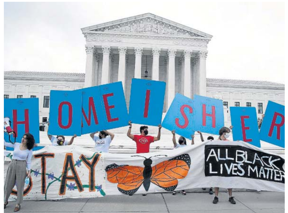
Manifestantes contra el plan de expulsión de jóvenes inmigrantes, ayer en Washington.

En cuanto a la evolución anual de 20minutos , el crecimiento de usuarios en sites (incluyendo todas sus webs vinculadas) fue del 20% en un año, según constata el medidor oficial Comscore. Mientras, la página principal del periódico ha tenido un crecimiento del 25% en internet entre mayo de 2019 y de 2020. Es el más alto entre los periódicos que están en el top 10 y tienen edición digital e impresa. En el caso de El Mundo.es , su crecimiento ha sido del 16%; ABC ha subido un 23%, La Vanguardia un 7% y El País se ha mantenido en los 23,2 millones de usuarios, igual que el pasado año. ●