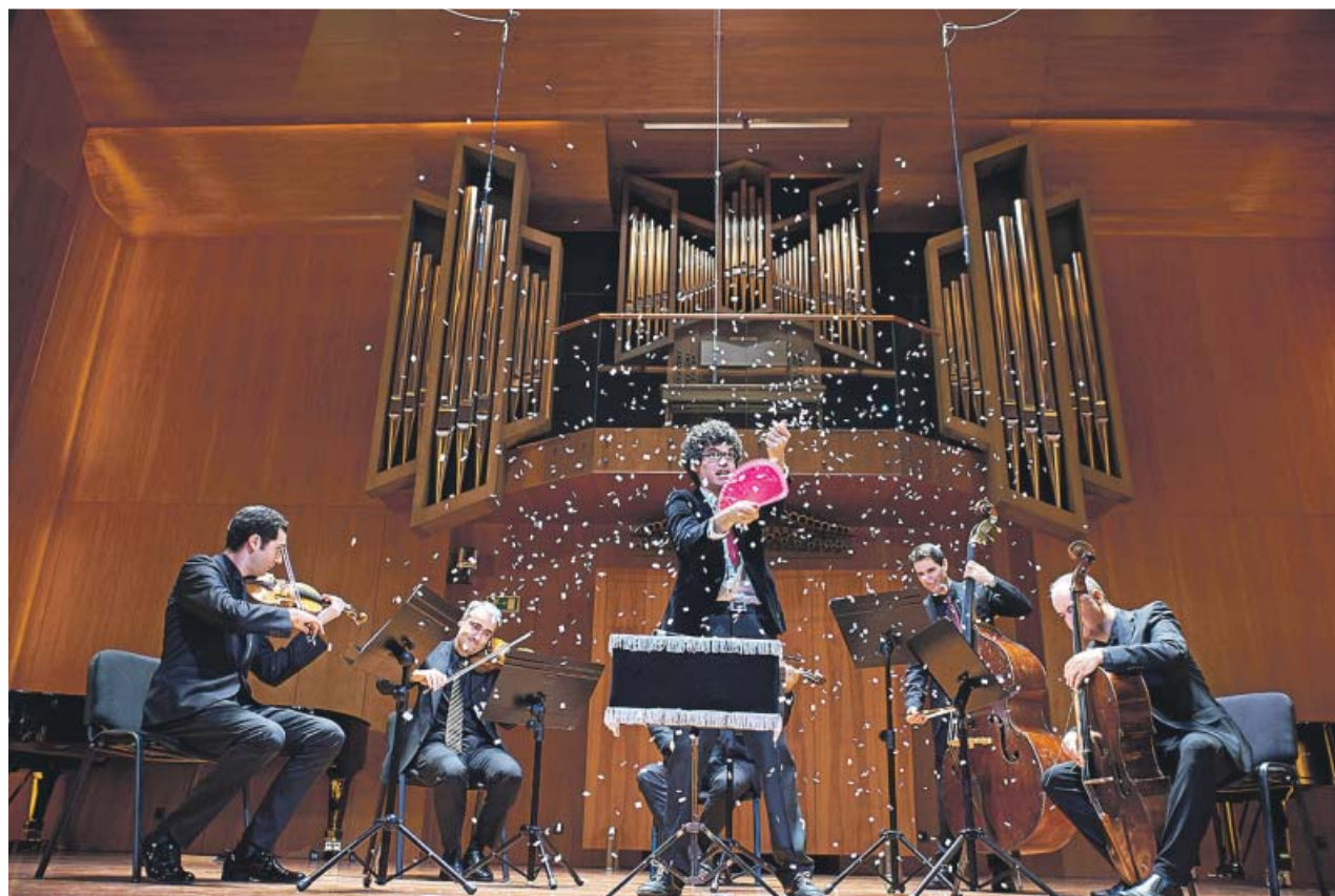
Un espectáculo melódico de magia en la Escuela Superior de Música Reina Sofía.

«Las artes escénicas funcionan como aglutinadoras y catalizadoras de la diversidad social y nos ayudan a construir identidades y personalidades saludables dentro de la sociedad moderna en la que vivimos. Son muy importantes para quebrar las barreras de las diferencias culturales. En otras palabras, sirven para unirnos más, para aprender unos de otros, pues la cultura y la sociedad siempre han estado directamente conectadas. Las artes escénicas son una parte fundamental en el fortalecimiento del bienestar y de la libertad que querríamos alcanzar. Nos ayudan a razonar, a comprender y a imaginar. Y, particularmente, la música tiene un gran poder en la sociedad, pues su impacto emocional es innegablemente evocador y sanador. Hay una frase del filósofo Arthur Schopenhauer con la que no podría estar más de acuerdo: 'La música expresa la filosofía más elevada en un lenguaje que la razón no comprende'. Por otra parte, no hay que olvidar su poder para atraer visitantes, funcionar como catalizador urbano y potenciar el tejido económico del territorio en el que se desarrolla».