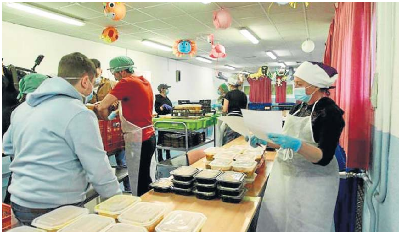
Varios voluntarios reparten comida a personas vulnerables en un colegio municipal de Madrid.