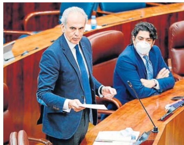
El consejero de Sanidad y el de Vivienda, en el pleno.