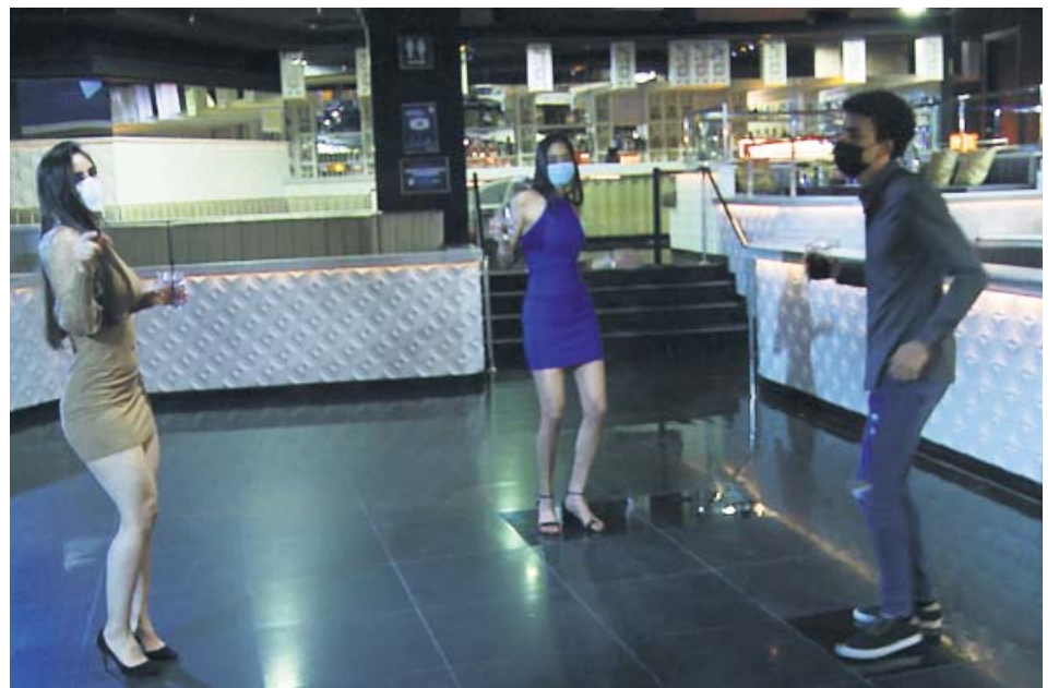
Tres personas bailando en la pista de una discoteca con mascarilla. ESPAÑA DE NOCHE

Aseos con aforo limitado. Los aseos deberán tener definida su capacidad máxima y se insta a que haya una persona dedicada a limpiarlos y a controlar que se cumplan las medidas de seguridad.