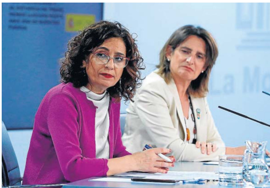
La portavoz del Gobierno, María Jesús Montero, y la vicepresidenta cuarta, Teresa Ribera.

El Gobierno no tiene previsto actuar por ahora ante los últimos brotes de coronavirus, pero no descarta tomar medidas si fuera necesario. En caso de «agravarse» la situación, se plantea cerrar el país al turismo internacional y restringir de nuevo los movimientos mediante la declaración del estado de alarma. El Gobierno lanzó ayer estos dos mensajes —uno más voluntario que otro— al mismo tiempo que intentaba mantener la calma sobre los casos que se registran estos días. «No hay nada que temer en estos momentos», dijo su portavoz, María Jesús Montero.