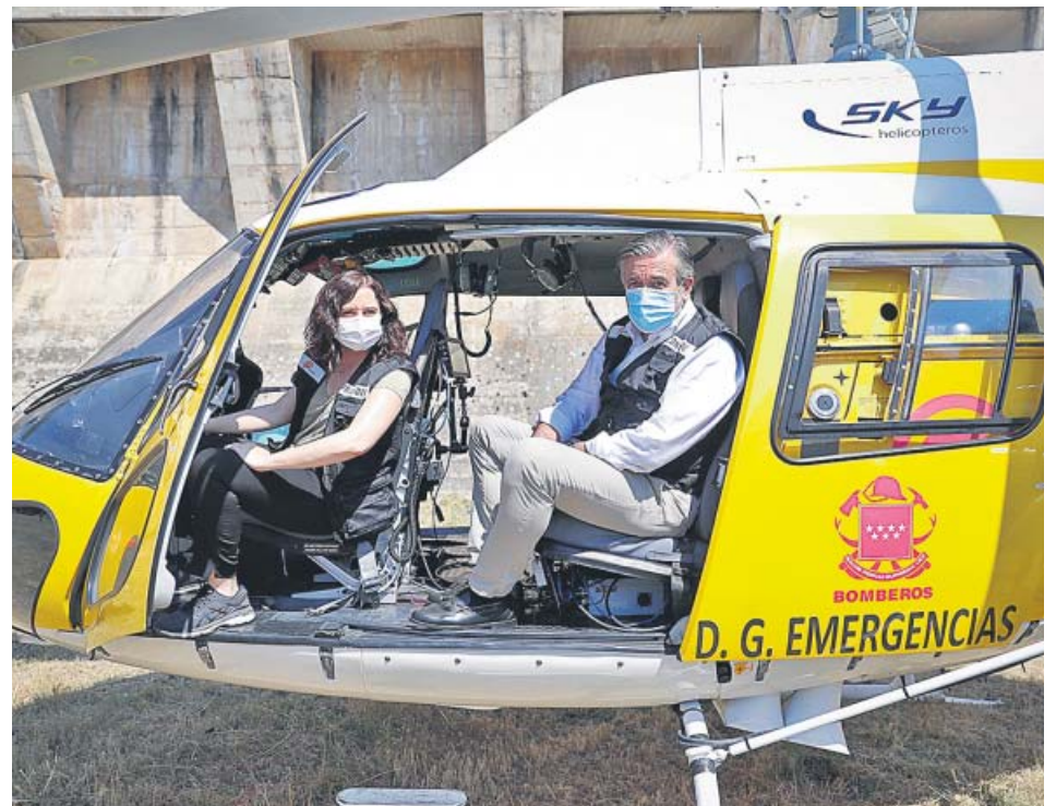
La presidenta Isabel Díaz Ayuso y el consejero de Justicia, Enrique López.

López también apuntó que se retoma el plan de inspecciones que comenzó el pasado febrero «con el objetivo de asegurar e involucrar al sector en la tarea de controlar los accesos a los locales». La consejería espera culminarlo en noviembre. ● M. TRAGACETE