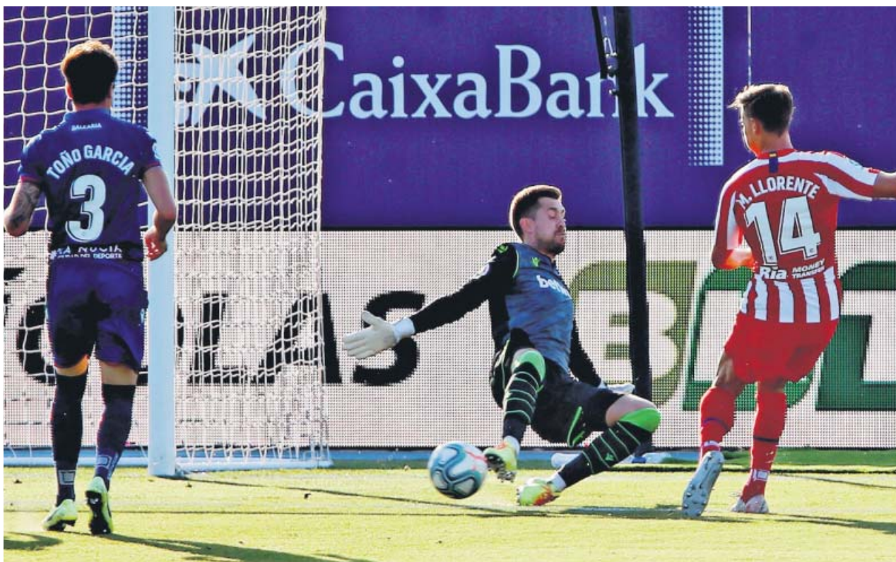
Marcos Llorente mete el pase de la muerte que se convirtió en el gol de la victoria del Atlético.