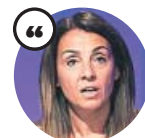
MERITXELL BUDÓ Consellera portavoz del Govern

«Hemos de avanzar para hacer el máximo de cosas posible, pero a la vez controlar al máximo el riesgo de rebrotes»