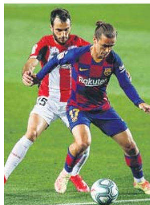
Griezmann acabó sustituido ante el Athletic.

Garitano sorprendió con una alineación reservando a numerosos habituales como Raúl García, Muniain, Dani García, Íñigo Martínez o Capa. Pero el que pensara que, por eso, no iba a competir el Athletic, no podía estar más equivocado. El equipo vasco plantó cara desde el primer momento defendiendo con orden y no renunciando en ningún momento al ataque.