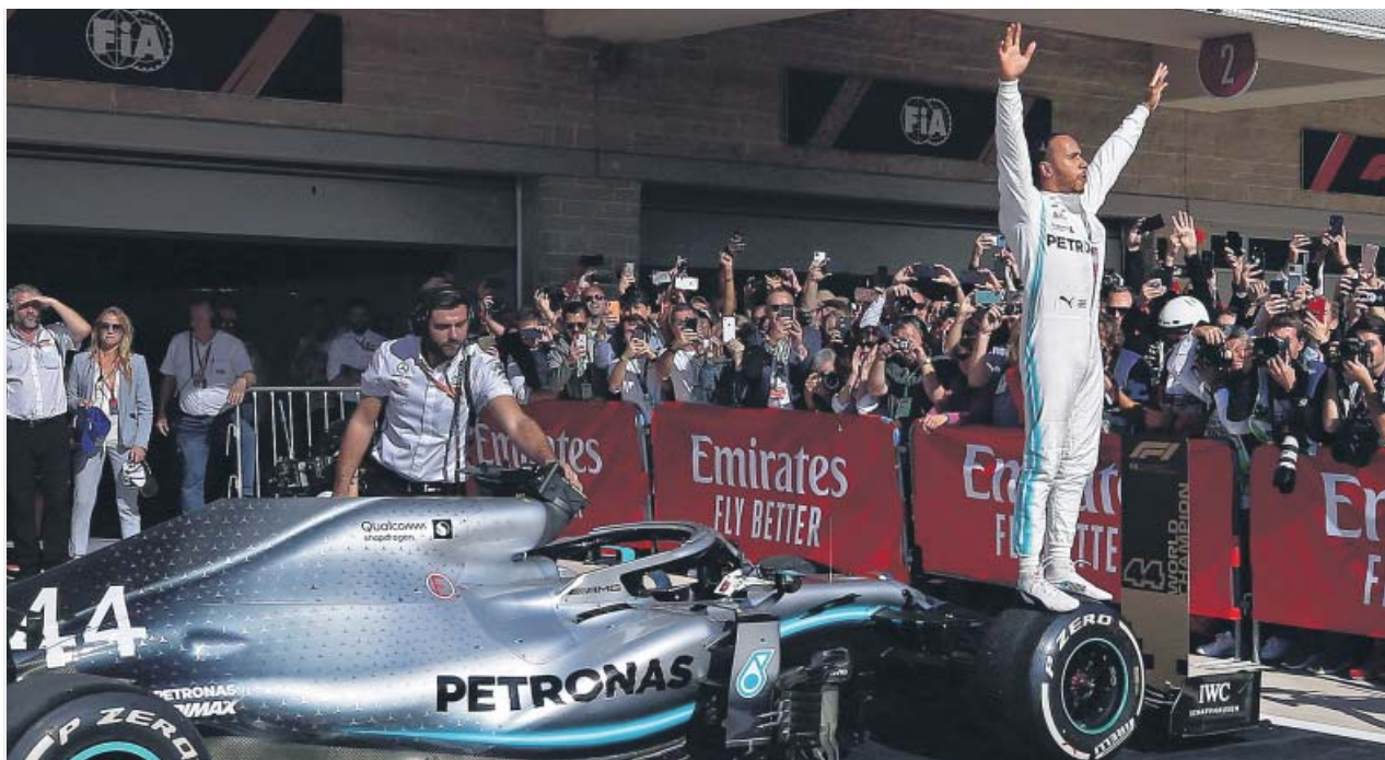
Lewis Hamilton celebrando un triunfo: el británico volverá a ser el rival a batir en la parrilla.

AUSTRIA acoge este fin de semana la primera carrera del 'nuevo' Mundial de F1 SAINZ La noticia deportiva de estos meses ha sido el fichaje del madrileño por Ferrari