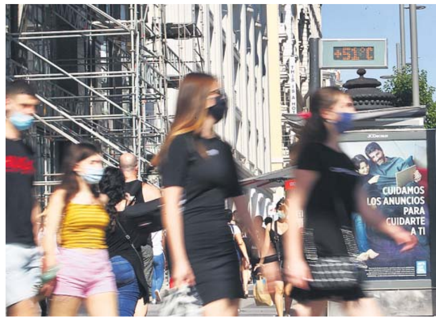
El calor y la humedad del verano pueden agravar los problemas que causan. J.PARIS

Uno de los grandes retos que supone el desarrollo de la vacuna de la Covid-19 es que la enfermedad tiene un nivel muy bajo de contagio en los países que están desarrollando los proyectos de investigación más avanzados, como es el caso de China, por lo que no está garantizado que las pruebas con militares acaben dando un resultado concluyente. ●