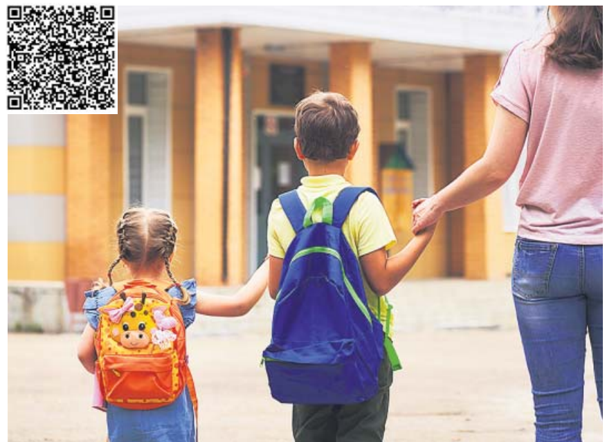
Las familias con dos o más hijos a cargo y rentas bajas serán las que reciban las mayores ayudas.