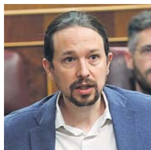
Pablo Iglesias, en una sesión en el Congreso.

Vox anunció una denuncia contra e Iglesias por supuestos delitos de denuncia falsa, estafa procesal y revelación de secretos. La formación de Santiago Abascal denuncia también al fiscal Ignacio Stampa, a la propia Bousselham y a su abogada, Marta Flor. Desde Vox aseguran que todo obedece a una campaña «para beneficiar a Iglesias y a Podemos».